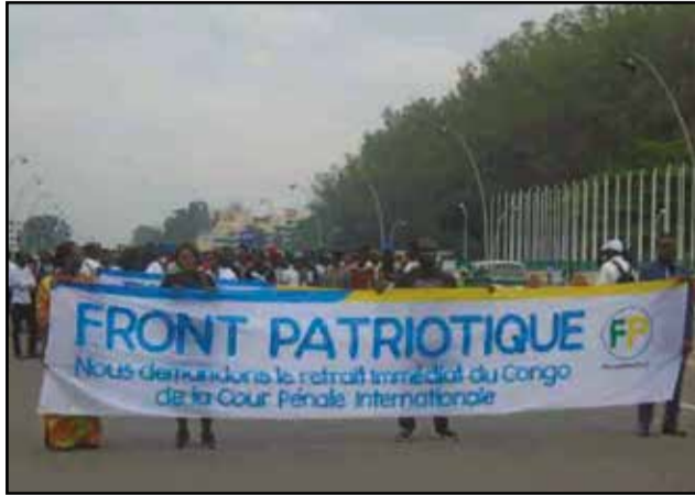
Marche populaire du Front patriotique.