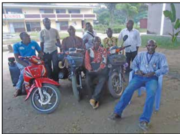
Les membres de la plateforme, à la fin de la réunion