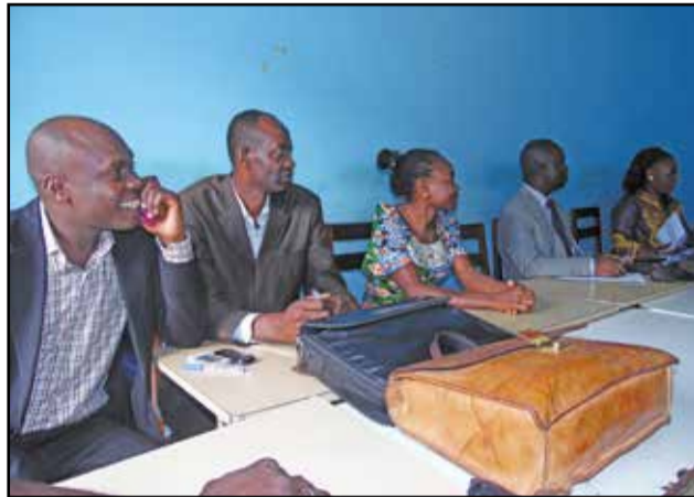
Une vue des participants à la réunion.

lycée. L'objectif, selon la C.i.e (Classification internationale type de l'éducation), est d'augmenter ce pourcentage des élèves fréquentant le privé à 10% à tous les cycles. S'agissant du personnel enseignant actif par année scolaire, le chef de service a dit qu'en moyenne, 61% d'enseignants évoluant au primaire pendant ces cinq dernières années font partie du public. Ils ne sont plus que 34% au collège public où le privé représente 66%. Quant au lycée, le public l'emporte avec 67% d'enseignants. Pour les résultats au B.e.p.c de 2010 à 2015, le pourcentage d'admis n'a jamais atteint 55%. L'embellie a été observée en 2010, avec 53,68% d'admis. Les résultats les moins bons ont été observés en 2015, avec 34,04% d'admis, tandis que les plus grands effectifs présentés