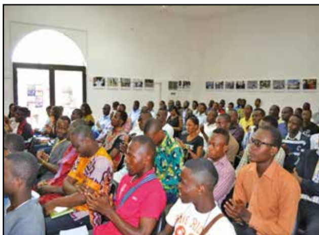
Une vue des boursiers.

pour que le Congo soit fier de vous. Vous n'êtes pas là-bas pour vous amuser, vous distraire ou faire autre chose. Le ministère est en train de s'organiser pour vous accompagner dans cette portion de votre vie... Nous allons moderniser le fonctionnement du ministère, notamment avec l'introduction du numérique, de façon à ce que vous ayez un site Internet, pour que vous puissiez vous