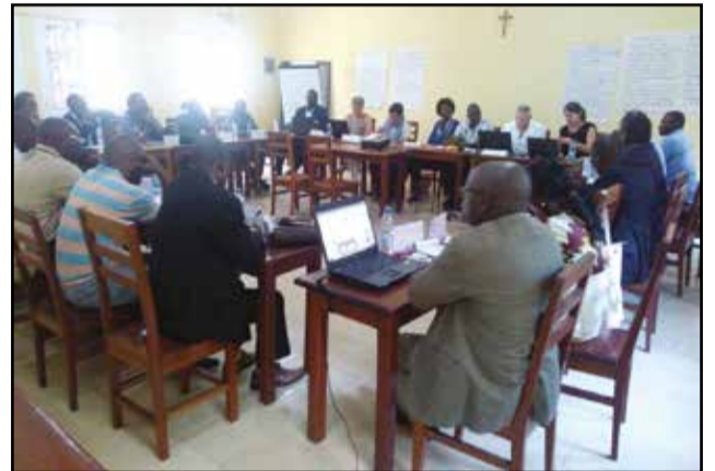
Pendant l'atelier de formation.

Dans le cadre du projet intitulé: «Promotion, respect et mise en œuvre des droits des enfants au Congo», financé par l'Union européenne pour la période allant de 2016 à 2019, la Fondation Apprentis d'Auteuil de France, œuvrant dans le domaine de l'éducation des enfants vulnérables, en partenariat avec le Reiper (Réseau des intervenants sur le phénomène des enfants en rupture) au Congo, ont initié, depuis quelques temps, une série de formations en vue de permettre aux éducateurs et travailleurs sociaux intervenants auprès des jeunes vulnérables et des enfants en situation de rue, d'acquérir de nouvelles connaissances et méthodes de travail, suivant les objectifs visés par le projet.