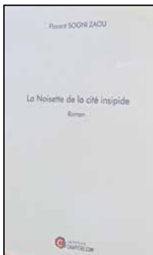
La couverture du livre.