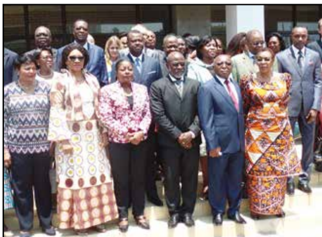
Les membres du gouvernement et le représentant résident du système des Nations unies, à la fin de la cérémonie.