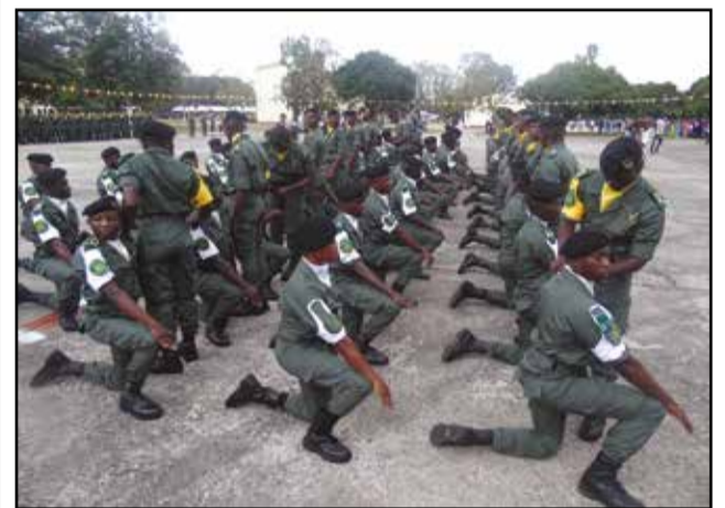
Port des alphas dorés par les élèves officiers d'active de la 21 ème promotion.

De tous les engagements prioritaires que le commandement des F.a.c (Forces armées congolaises) tient à cœur, en vue de leur mise en œuvre imminente, au regard des enjeux géostratégiques actuels, il y a celui qui relève du domaine de la formation. C'est dans cet élan que le ministre de la défense nationale, Charles Richard Mondjo, a présidé, samedi 29 octobre 2016, la cérémonie marquant la fin de formation de la 20 ème promotion des élèves officiers d'active, et le baptême de la 21 ème promotion des E.o.a de l'Acmlil (Académie militaire Marien Ngouabi), établissement de formation militaire supérieure situé à Djiri, dans le 9 ème arrondissement de la capitale.