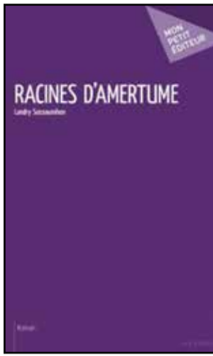
La couverture du livre.