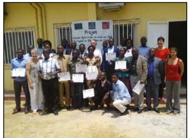
Munis de leurs diplômes, les participants posant pour la postérité.