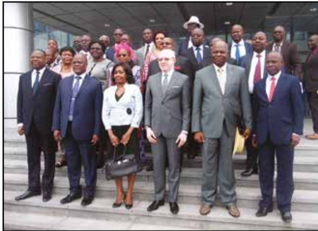
Photo de famille des officiels et participants, après la cérémonie d'ouverture.

Le recensement a été démontré que 77% des ménages font l'agriculture et pour l'autoconsommation et pour la vente de leurs productions; 22,1% des ménages