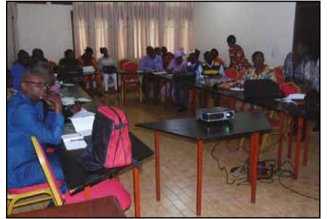
Les participants au symposium.