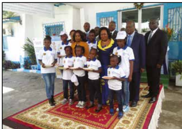
Mme Antoinette posant avec les légumineuses et quelques ministres.

Lors de la 68 e assemblée générale des Nations unies, tenue le 20 décembre 2013, 2016 était déclaré comme année internationale des légumineuses. A cet effet, la Fao (Organisation des Nations unies pour l'alimentation et l'agriculture), en collaboration avec le gouvernement congolais, par le biais du Ministère de l'agriculture, de l'élevage et de la pêche, a organisé, lundi 5 décembre 2016, dans ses locaux, à Brazzaville, une journée portes-ouvertes sur le thème: «Rôle des légumineuses dans la promotion de la sécurité alimentaire et nutritionnelle au Congo. Produisons et consommons suffisamment les légumineuses, pour une meilleure sécurité alimentaire et nutritionnelle de nos familles».