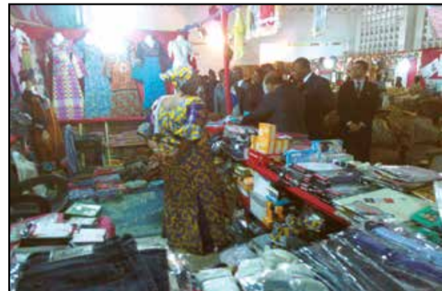
Les officiels visitant les articles.

La Mairie de Poto-Poto, le 3 e arrondissement de la ville capitale est devenu un centre d'affaire au regard des diverses activités commerciales qu'y ont cours. Depuis le lundi 21 novembre jusqu'au 31 décembre 2016, la salle de conférence de cette mairie d'arrondissement abrite, une fois de plus, la 5 e édition de la foire d'exposition-vente des produits égyptiens organisée par la Maison moderne, en partenariat avec le Ministère du commerce extérieur et de la consommation.