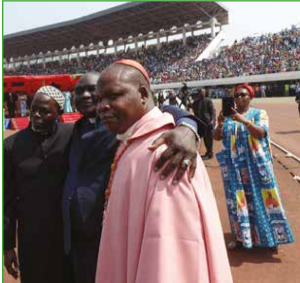
Le cardinal Dieudonné Nzapalainga (à d.) au Stade Barthélemy Boganda. (P.9)