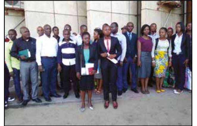
Les étudiants Rwandais posant pour la postérité.

Depuis la tenue de leur assemblée générale en 2013, au cours de laquelle, les étudiants Rwandais regroupés au sein d'une association, avaient exigé du pouvoir de Kigali, de convoquer une concertation nationale, afin de réconcilier les Rwandais. Mais depuis lors, leur cri du cœur est resté lettre morte.