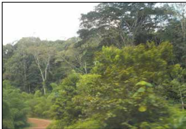
Une forêt aux environs de Mitele, non loin de Mossendjo (Niari).

dont le terrible dioxyde de carbone issue de la déforestation et de la dégradation des forêts, afin de limiter les effets des changements climatiques. Ce mécanisme est doté d'une enveloppe de 15 milliards de dollars (plus de 7500 milliards de francs Cfa) par année. Des fonds qui devraient être versés aux Etats ou aux populations qui préservent leurs forêts ou en créent d'autres. Quitte à craindre des risques de corruption dans la mise en œuvre de la Redd+, car les instruments mis en place par l'Etat (Commission nationale de lutte contre la corruption et Observatoire national de