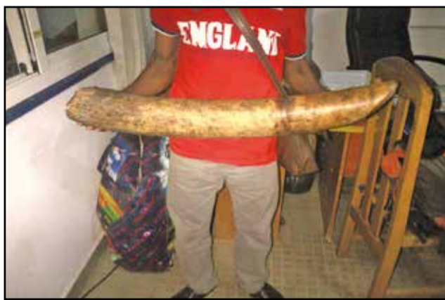
Un des présumés posant avec la pointe d'ivoire.

La lutte contre le braconnage, loin d'être une simple vue de l'esprit en République du Congo, est bel et bien une réalité. Mercredi 7 décembre 2016, dans la ville océane, six présumés trafiquants de différentes nationalités: malienne, guinéenne, congolaise (R.d Congo) et congolaise de la République du Congo, ont été pris en flagrant délit de détention et de com-