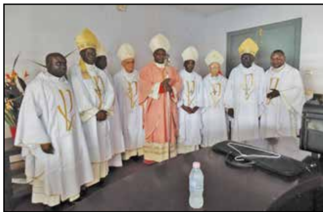
Les membres de la Conférence épiscopale du Congo autour de l'archevêque de Bangui.