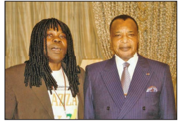
Nzongo Soul et Denis Sassou Nguesso.

Dans l'article annonçant le décès à Paris du chanteur congolais Nzongo Soul (page 12, édition n°3757 du vendredi 12 janvier), nous avons, par inadvertance, placé une photo qui ne cadre pas avec la légende. Nous nous en excusons et vous proposons la photo appropriée.