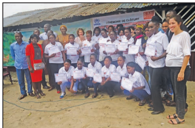
Les bénéficiaires posant avec les responsables ou représentants des structures ayant été impliquées dans leur formation.

formation dans cinq différents corps de métiers: pâtisserie, restauration, boucherie, coiffure et esthétique. Elles ont été formées en six semaines auprès de maîtres artisans qualifiés (pour la boucherie), à l'école professionnelle des Sœurs François Régis (pour la restauration et la pâtisserie) et au centre de formation (Alisha Coiffure) pour la coiffure et l'Esthétique.» Les frais d'inscription ont été pris en charge par le projet et chaque bénéficiaire a eu droit à un kit de formation et un kit d'insertion (matériel et équipement en nature) leur permettant de démarrer leur activité. Outre l'appui à l'insertion, les femmes et jeunes filles ont eu droit à des focus organisés sur différents thèmes tels la santé ou la découverte du monde de travail tout au long du projet. Et un soutien leur a été apporté dans le paiement du loyer. En parallèle, 20 enfants de ces réfugiées ont été accompagnés sur les plans éducatif et récréatif par des cours de soutien à l'AEED. Ils ont été encadrés par deux animatrices qualifiées. Plusieurs activités ont été organisées à leur profit pour leur permettre de découvrir au mieux le pays d'accueil. Ces activités ont également permis la mixité entre enfants