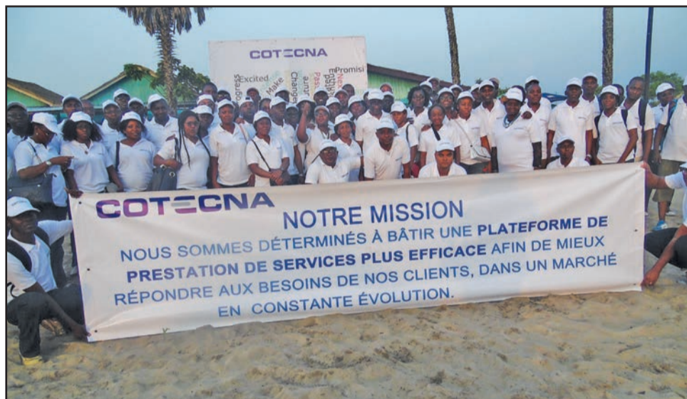
Le personnel de COTECNA Congo.

exploitant cinq autres scanners aux principaux aéroports et ports du Congo. A noter que la formation et le renforcement