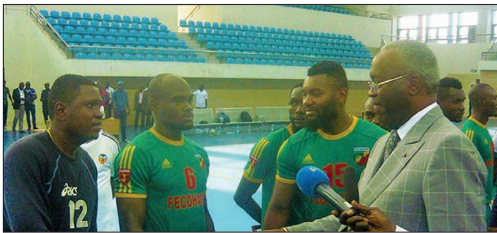
Malgré une préparation peu sérieuse, les Diables-Rouges sont soumis à une obligation de résultat.

Comme on le constate en jetant un coup d'œil sur les pays présents, l'Afrique centrale, du moins la zone 4, y sera représentée outre le Congo, par le Cameroun qui s'est préparé au Brésil, la RDC, en France, et le Gabon, en Suède et France. C'est une bonne nouvelle pour