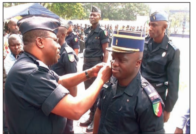
Port des galons à un colonel.

Les gendarmes promus au premier trimestre de cette année ont porté leurs nouveaux galons, mercredi 10 janvier 2018, au commandement de la Gendarmerie nationale, à Brazzaville. Il s'agit de quinze officiers et douze sous-officiers. C'était au cours d'une cérémonie placée sous l'autorité du commandant de cette institution le général de brigade Paul Victor Moigny qui a affirmé que malgré la crise économique et financière qui a durement frappé le pays en 2017, la Gendarmerie, avec la même abnégation, a marqué des avancées dans le cadre de son plan d'action "Gendarmerie 2025".