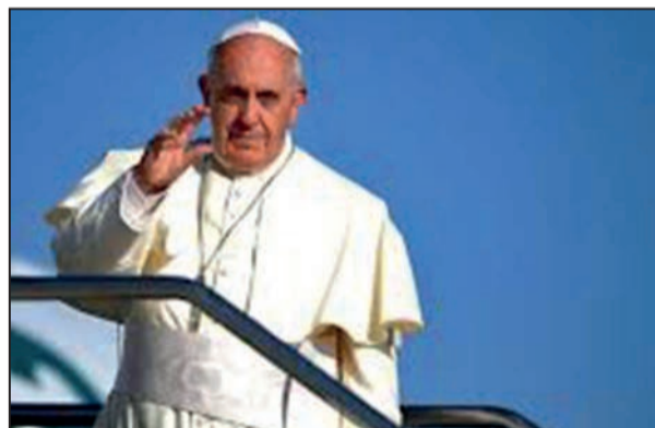
Le Pape François. (P.8)