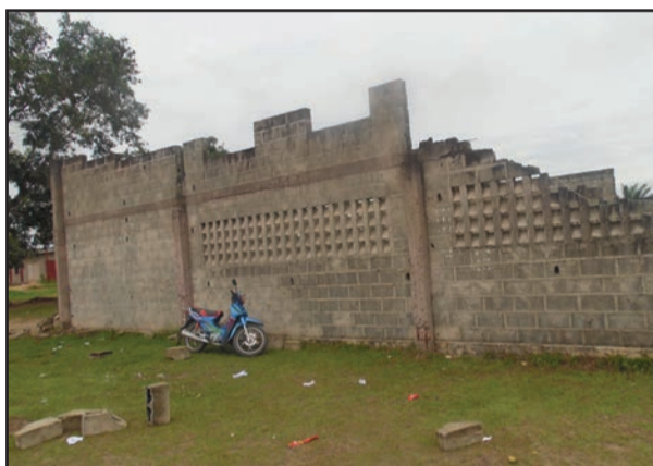
La nouvelle église inachevée et en ruine. (P.9)