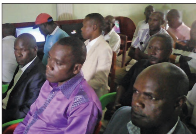
Quelques réfugiés rwandais pendant la conférence de presse.