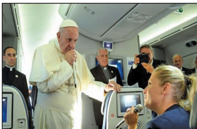
Le Pape François répondant aux questions des journalistes dans l'avion.

Le Pape se rendra en avion, jeudi 18 janvier, à Iquique, le grand port du nord du Chili. Il y célébrera la messe à 11h30