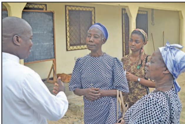
Le curé avec les religieuses congolaises du Rosaire, après la messe.