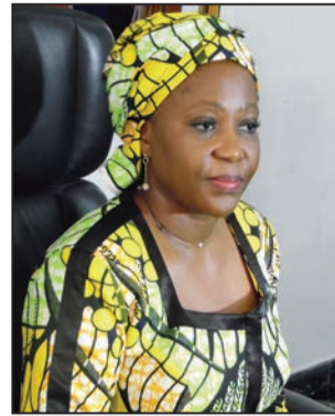
Jacqueline Lydia Mikolo.

Face à la résurgence de l'épidémie de grippe que connaît le Congo depuis quelques jours, la ministre de la Santé Jacqueline Lydia Mikolo a rendu publique, vendredi 12 janvier 2018, une déclaration du Gouvernement dans laquelle sont indiquées les principales mesures d'hygiène que doivent observer les populations. Ainsi que des actions immédiates prises par son ministère. Il s'agit de la réactualisation du plan de contingence, le renforcement de la surveillance épidémiologique, la vulgarisation des mesures d'hygiène personnelle et collective, la prise en charge gratuite des cas et des mesures promotionnelles.