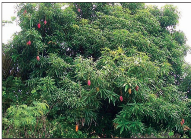
Un manguier portant des fruits.

Mais cette facilité est aussi certainement la cause des inconvénients que le manguier commence à représenter chez les citadins. Car tout le monde, désormais, a son manguier dans sa parcelle. Mais comme c'est une plante à croissance rapide, chacun se retrouve désormais aussi avec un géant tutélaire que ne réussissent plus à contenir les 20X20 m classiques des parcelles en ville. Conséquence : le manguier devient un arbre à problème. On ne compte plus le nombre de litiges nés du fait de mangues mûres qui tombent sur la toiture des voisins, voire qui se fracassent sur les parebrises des voitures. Le ramage étendu se traduit aussi par un amas gêné de feuilles mortes qui ont tendance à tomber chez le voisin, ou qui se déposent sur les toitures de tôles accélérant