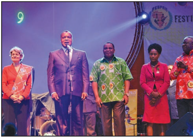
Le président Denis Sassou-Nguesso donnant le coup d'envoi de l'édition 2015.

C'est par communiqué, le soir du mercredi 12 juillet 2017, que le Gouvernement avait décidé du report sine de l'acte XI du FESPAM, placé sous le thème: «Musique et environnement en Afrique et dans la diaspora». «Le Gouvernement informe l'opinion nationale et africaine que des impératifs insurmontables d'agenda obligent la République du Congo à procéder au report de la 11e édition du Festival panafricain de musique (FESPAM). Initialement prévu du 19 au 21 juillet 2017, le FESPAM sera organisé à une date ultérieure. Les autorités compétentes annonceront, en temps utile, un nouveau calendrier», précisait ce communiqué. Mais, plus de cinq mois après, pas un seul mot de