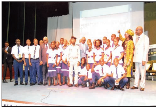
Les meilleurs élèves cuvée 2016-2017 posant avec des officiels.