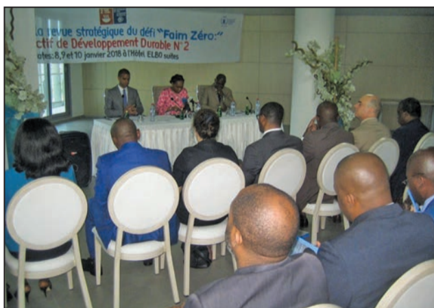
Les experts suivant attentivement l'étude.

améliorer la nutrition et promouvoir l'agriculture durable. «Il s'agit donc d'établir un diagnostic complet de la situation alimentaire et nutritionnelle afin de définir les écarts en termes de politiques d'intervention à mener en priorité pour atteindre les objectifs du défi «Faim zéro» d'ici 2030», a-t-elle précisé. Elle a exhorté les partenaires techniques et financiers du pays à se mobiliser. «La revue stratégique du défi «Faim zéro» fera ressortir outre les défis de développement dans les domaines de la sécurité alimentaire et la nutrition, ceux des secteurs de l'éducation, de la protection sociale, de la ré-