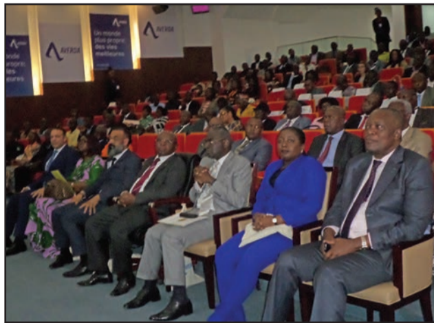
Les officiels au lancement de la campagne

dit la coordonnatrice du projet. Elle a précisé, en outre, que des séances de travail et des ateliers seront organisés avec le concours des enseignants et directeurs des établissements concernés. «Nous allons distribuer des manuels de coloriage et des bandes dessinées aux enfants, question de faciliter leur compréhension. Dans la création des ateliers, il s'agira donc de montrer aux élèves comment par exemple recycler», a-t-elle fait savoir. Le ministre de l'Enseignement primaire, Anatole Collinet Makosso, saluant le projet, a affirmé que son souhait le plus ardent est de voir l'enseignement à l'environnement et au développement durable figurer parmi les programmes scolaires, notamment l'instruction civique. «Il s'agit, à travers ce programme, d'éduquer les élèves dès leur plus jeune âge pour qu'ils s'imprègnent des comportements favorables à