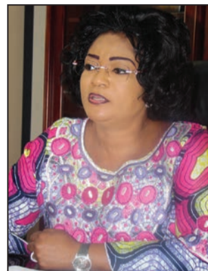
Inès Néfer Bertille Ingani,

La ministre Inès Néfer Bertille Ingani rappelle que le 8 mars de chaque année, la célébration de la Journée internationale de la femme, «c'est une occasion pour les femmes de toutes les nations de dresser le bilan des progrès réalisés dans la lutte pour la promotion et la défense de leurs droits et libertés. D'appeler à des changements divers, de reconnaître et de rendre hommage aux différents actes de courage et de détermination accomplis par les femmes dans l'histoire de leurs pays et de leurs peuples». Elle a également rappelé qu'en République du Congo, la journée du 8 mars a été célébrée pendant une certaine période de manière tournante dans tous les départements à l'exception du Pool en 2012, suite aux événements du 4 mars. Cette célébration tournante s'est faite à la faveur de la municipalisation accélérée, une politique gouvernementale qui a permis de doter les départements de multiples infrastructures. Pour elle, le thème de cette journée répond bel et bien à l'appel du président de la République, sur l'impérieuse nécessité de l'implication de toutes et de tous dans la diversification de l'économie nationale et dans l'atteinte de l'autosuffisance alimentaire des produits de base, afin de réduire l'importation des aliments de première nécessité. D'où le choix porté à la ville océane en jumelage avec le département du Kouilou. «Ça sera sous le haut-patronage du premier ministre et le parrainage de la première Dame, Mme Antoinette Sassou-Nguesso», a-t-elle indiqué.