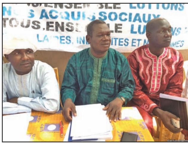
Les responsables syndicaux

la nouvelle grille salariale des fonctionnaires. Il avait ensuite promulgué un décret qui approuve et rend exécutoires les grilles salariales consécutives au relèvement du Salaire minimum interprofessionnel garanti