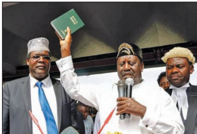
Raila Odinga prêtant serment, Bible à la main

Au Kenya, le bain de sang a été évité. Car pour le gouvernement qui a dû réviser sa position, cela servirait bien plus à l'opposition