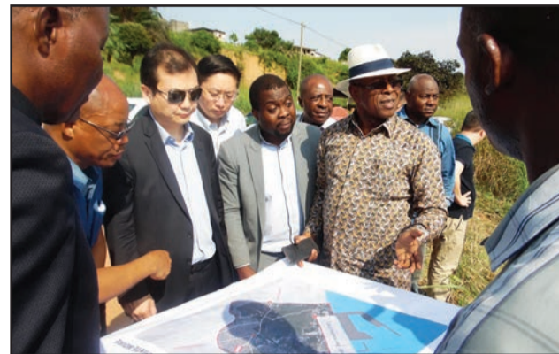
Le ministre Gilbert Mokoki (chapeau sur la tête) se faisant expliquer une carte de la ZES de Pointe-Noire

Cette partie industrielle de la ZES qui va abriter les usines se doit impérativement d'être reliée au Port autonome de Pointe-Noire pour les besoins d'import/export des produits industriels. D'où la nécessité de construire au port un quai multifonctions de 1200 m, avec un terminal y afférent. Le tout sur une surface de 60 ha. Et pour relier ce quai du port à la Zone économique spéciale, une route dédiée va être construite sur une longueur d'environ 15 km. Il s'agit d'un ensemble de pro-