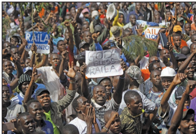
Le public pendant la cérémonie

Alliance (NASA), coalition de l'opposition, a salué un jour «historique», marquant