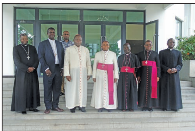
Le président (4 e de g. à dr.) posant avec les membres du Conseil permanent de l'ACERAC