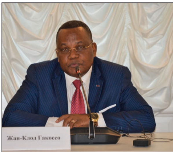
Le chef du département des Affaires étrangères (P.3)