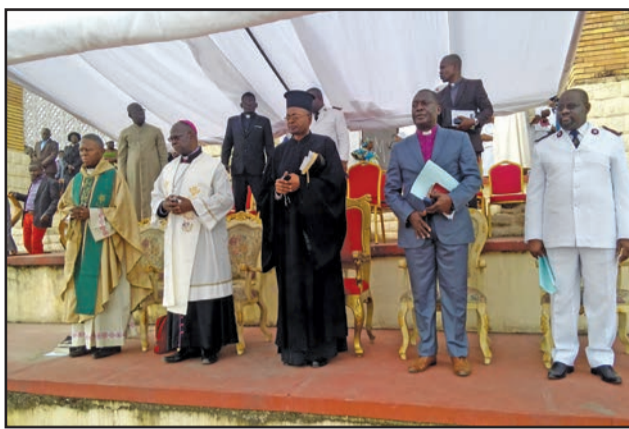
Les responsables du Conseil œcuménique présents au culte

peuples des Caraïbes ont un chant de victoire et de liberté à chanter, et ce chant les unit. Cependant, les défis contemporains constituent encore une menace d'asservissement et mettent de nouveau en péril la dignité de la personne humaine créée à l'image et à la ressemblance de Dieu. Si la dignité humaine est inaliénable, elle est souvent masquée par le péché individuel et le mal qu'engendrent nos structures sociales. Dans notre monde déchu, la justice et la compassion qui honorent la dignité humaine font trop souvent défaut dans nos relations sociales. La pauvreté, la violence, l'injustice, la dépendance de la drogue et de la pornographie, la douleur, la détresse et l'anxiété qui en découlent sont des expériences malheureuses qui portent atteinte à la dignité humaine.