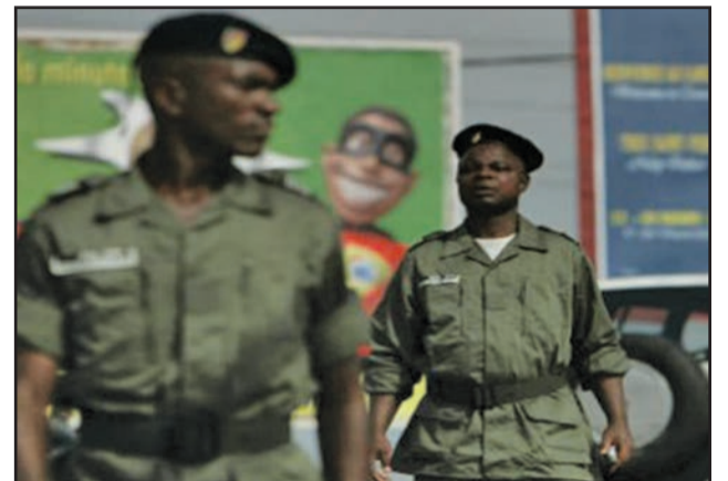
La Force publique camerounaise sur le terrain

Après deux mois de calme relatif, les revendications sécessionnistes ont repris à Bamenda et dans les villages de la région du Nord-Ouest du Cameroun. Les populations réclament la fin des hostilités. Jeudi 25 janvier, un gendarme a été tué dans une localité du département de Bui (région du Nord-Ouest), et une bombe artisanale a explosé au passage d'un véhicule de l'armée à la frontière nigériane.