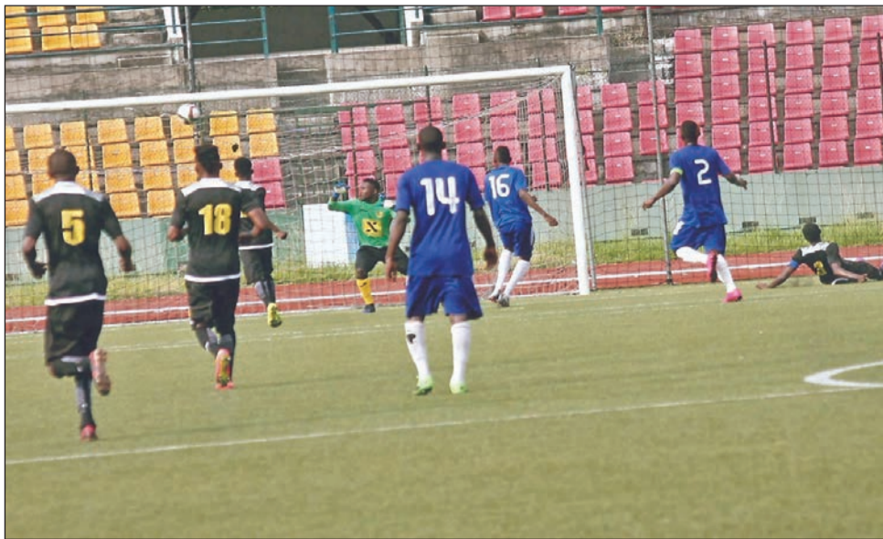
Le but victorieux de JST qui a coupé souffle et jarrets aux Diables-Noirs

Au Complexe sportif de Pointe-Noire, V.Club Mokanda et FC Kondzo se sont emparés les premiers de l'aire de jeu. Pour une partie tournée à l'offensive en faveur des locaux qui ont fait perdre à Kondzo sa su-