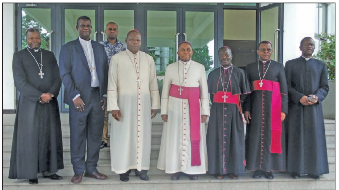
Les membres du Conseil permanent de l'ACERAC (P.9)

Construire des communautés qui soient sel de la terre et lumière du monde