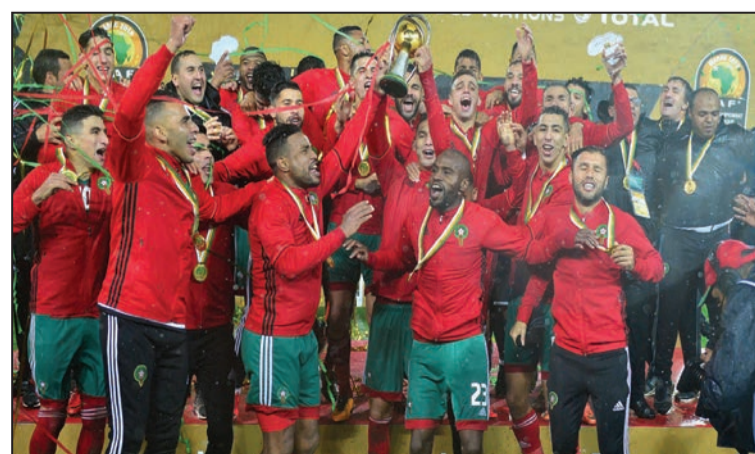
Les Marocains au paroxysme du bonheur (P.14)