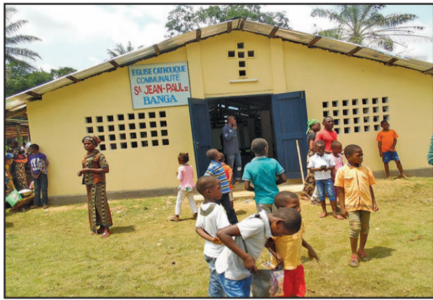
La devanture de l'église Saint Jean-Paul II de Banga