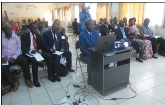
Une vue de la séance de restitution de l'étude

PVIH au Congo; évaluer le degré de mise en œuvre de la gratuité des ARV et du bilan biologique; évaluer l'impact de la mesure de la gratuité des ARV sur la qualité de vie des PVIH. Elle précise en outre les personnes ciblées, à savoir: les PVIH, les prestataires des soins dans les Unités de prise en charge des PVIH, les techniciens des laboratoires, les responsables des Organisations de la société civile (OSC) de prise en charge des PVIH, et les localités où s'est déroulée l'enquête. L'étude révèle qu'au cours des 12 derniers mois qui ont précédé cette enquête, les ARV ont été disponibles dans 26,2% de cas et en rupture de stock dans 73,8% de cas. 52,4% des PVIH ont noté que les ARV étaient en rupture pendant 1 à 6 mois. 76,1% des PVIH ont déclaré que les autres produits médicaux n'étaient pas disponibles non plus: 70% des PVIH s'approvisionnent en pharmacie en cas de manque. 63,7% ont affirmé n'avoir jamais bénéficié gratuitement de la prise en charge des infections opportunistes (IO). 54,6% ont acheté les produits en pharmacie: 21,1% n'ont rien fait et, 19,1% se sont approvisionnés auprès des «Bana Manganga». Plus de la moitié des PVIH ont affirmé n'avoir «rien fait» en cas de rupture et 35,9% se sont réapprovi-