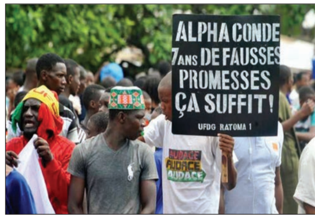
L'attente des électeurs guinéens était devenue trop longue

Les Guinéens se sont rendus aux urnes dimanche 4 février 2018, pour élire les conseillers régionaux et communaux, dont les maires de quelque 342 communes du pays. Plusieurs fois reportées, ces élections locales devaient se tenir depuis 2010. Elles ont mis en lice 30 mille candidats et mobilisé près de 6 millions d'électeurs. Le président Alpha Condé a mis fin à 12 ans d'attente.