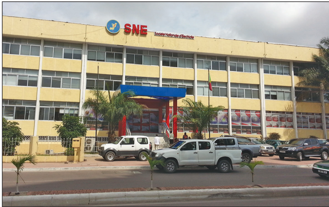
Le siège de la désormais défunte SNE à Brazzaville (P.3)

Vie d'entreprises La SNE et la SNDE dissoutes!