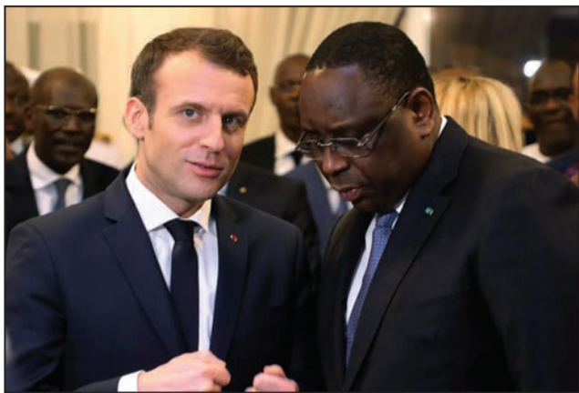
Retrouvailles entre Emmanuel Macron et Macky Sall à Dakar

La capitale sénégalaise, Dakar, a abrité vendredi 2 février dernier la troisième conférence sur le Partenariat mondial pour l'éducation (PME). C'est Macky Sall et Emmanuel Macron, les présidents sénégalais et français qui ont coprésidé cette rencontre qui a rassemblé un parterre des chefs d'Etat du continent, des bailleurs de fonds et experts du domaine de l'éducation. Pour Emmanuel Macron, «la seule réponse à l'obscurantisme, c'est l'éducation».