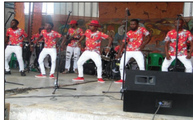
L'orchestre K. Musica pendant le concert

Ce don était composé de riz, sel de cuisine, oignons, tomate concentrée, bidons d'huile d'arachide, savons, boîtes de conserves et d'allumettes, habits, etc. La remise officielle de cette donation aux ayant droit a eu lieu lundi 29 janvier 2017.