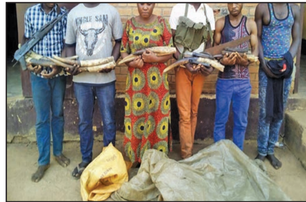
Les six présumés trafiquants posant avec leur butin

Une quinzaine de pointes d'ivoire représentant huit éléphants sacrés entre les mains de six trafiquants présumés d'ivoire. C'est sans doute l'une des plus belles prises de la Gendarmerie dans le cadre de la lutte anti-braconnage qu'elle mène avec l'administration des Eaux et forêts et le Projet d'appui à l'application de la loi sur la faune sauvage (PALF).