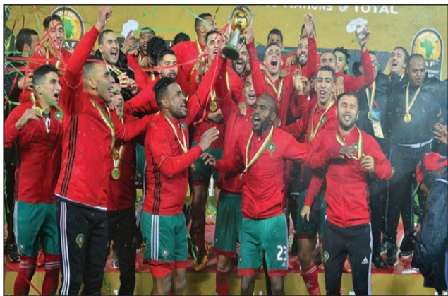
Les Marocains au paroxysme du bonheur

Marocains et Nigériens se sont retrouvés dans une finale inédite que les locaux ont fini par gagner de fort belle manière. Y croyaient-ils vraiment? Un peu. Les Marocains avaient