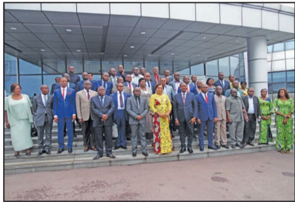
Photo de famille après la cérémonie d'ouverture