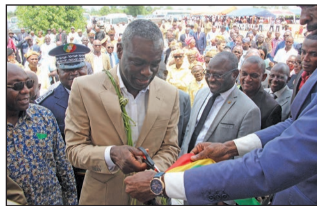
Anatole Collinet Makosso coupant le ruban symbolique

Les cités scolaires sont des regroupements des écoles traditionnellement disséminées sur un rayon de moins de 10 Km et dont les effectifs totaux n'atteignent pas 350 élèves. Ces cités obéissent à une vision de modernisation de l'école, en vue d'offrir aux écoliers des zones rurales de bonnes conditions d'apprentissage et de réduire le taux de redoublement, d'abandon et de décrochage scolaire. Pour le ministre Makosso, la vision est de créer à terme au moins une cité par district. Il a rappelé à l'occasion que son Département ministériel ne met en œuvre que la politique du président de la République renouvelée en 2009, dans son ouvrage intitulé « L'Afrique enjeu de la planète ». « Dans cet ouvrage, le président de la République pensait que l'on pouvait s'appuyer sur les zones rurales, en vue de développer un système éducatif de qualité qui amène les enfants d'Afrique