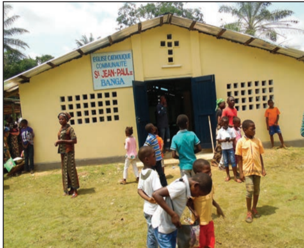
L'église Saint Jean-Paul II de Banga (P.9)

Un Dimanche en paroisse: Diocèse de Pointe-Noire Communauté catholique Saint Jean-Paul II de Banga