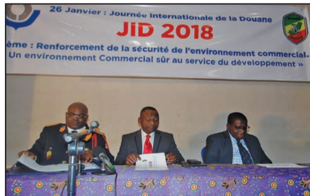
Les officiels lors du focus