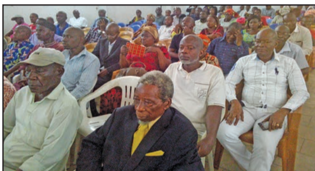
Les commerçants de Poto-poto pendant la rencontre

sonnes non habilitées. L'opération «Bâtissons Brazzaville ensemble» est une complicité entre la mairie et les populations. Elle consiste à conjuguer ensemble des efforts à travers une contribution modeste permettant à l'autorité municipale d'engager les travaux prioritaires. «Le problème d'assainissement reste une épine dorsale pour la mairie qui se battra bec et angle pour que la ville redevenue propre», a-t-il déclaré avant d'ajouter: «Pour rentabiliser les recettes municipales