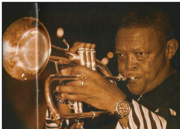
Hugh Masekela avec son instrument de prédilection

Hugh Masekela crée alors son groupe qui se fait parler de lui dans le milieu jazz jouant aux côtés du tromboniste Jonas Gwangwa et du grand pianiste de jazz Abdullah Ibrahim, plus connu sous le nom de Dollar Brand. Considéré comme un talent précoce, «Hugh», comme on l'appelait familièrement, jouait à cette époque un jazz très cool influencé par les rythmes d'Afrique du Sud. Son mentor, le père Huddle-