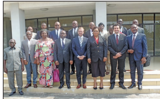
La ministre Rosalie Matondo posant avec les partenaires

de l'accès aux ressources génétiques et aux connaissances traditionnelles associées, ainsi que le partage juste et équitable des avantages découlant de leur utilisation par le point focal du protocole de Nagoya sur l'accès aux ressources génétiques et le partage équitable des avantages découlant de leur utilisation. Les participants ont validé avec amendement le projet de décret de base fixant les conditions de gestion et d'utilisation des forêts et le document dans lequel est consigné les autres projets de décret et arrêté correspondants aux renvois de l'avant-projet de loi portant régime forestier. Cet atelier a été un engagement à accompagner le Congo jusqu'à l'aboutissement du processus d'élaboration des nouveaux textes législatifs et réglementaires. Rosalie Matondo a rappelé que le Congo par ses forêts contribue « au maintien des équilibres géo-écologiques, notamment à travers la séquestration du carbone atmosphérique, processus à travers lequel ces forêts contribuent à la lutte contre le changement climatique, l'une des menaces de notre siècle ».