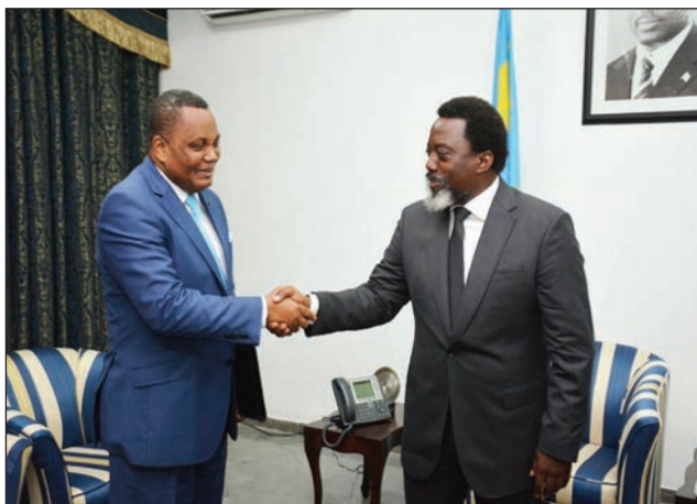
Poignée de main cordiale entre le chef de la Diplomatie congolaise et le Président Joseph Kabila de la RDC.

** Votre question rejoint au fond la précédente. Nous sommes pour des partenariats plus justes et plus équilibrés, des «partenariats gagnant-gagnant», selon la formule consacrée, et ce, dans le respect strict de la souveraineté de chacun. Si cette conditionnalité n'est pas prise en compte, pour nous, la relation ou le partenariat est sans objet. Cette position est invariable. Les Congolais sont un peuple généreux et ouvert. Le Congo, qui est une terre d'opportunités, ouvre perpétuellement ses bras aux nations étrangères qui viennent