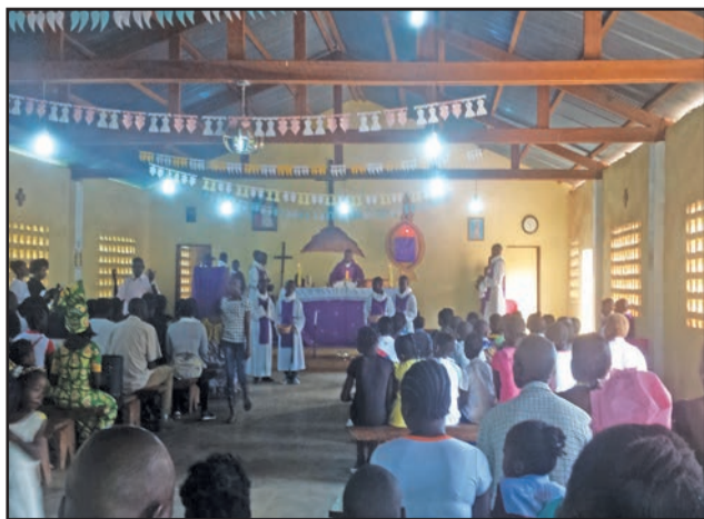
Des fidèles participant à la messe

la communauté paroissiale, dans la construction d'une nouvelle église plus grande que l'actuelle. Certainement pour convenance personnelle, le curé de la paroisse Saint Jean Paul II a préféré que seules les œuvres en réalisation au sein de sa paroisse parlent à la place des mots. Si bien que toute tentative d'entretien avec lui était d'avance découragée. Pour le moment, sa préoccupation majeure c'est faire aboutir les travaux de construction de la paroisse.