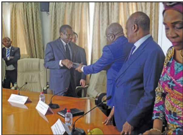
Echange de parapheurs après la signature

Les groupes particulièrement vulnérables tels que les jeunes, les veuves, les filles-mères et les handicapés éprouvent d'énormes difficultés à subvenir à leurs besoins quotidiens. Le projet d'appui à la promotion des moyens de subsistance sera coordonné par le Haut-commissariat à la réinsertion des ex-combattants, principal organisme gouvernemental responsable. Le Haut-commissariat s'adjoindra les services de l'unité de mise en œuvre du projet d'appui au développement de l'agriculture commerciale (P.D.A.C) qui dispose des capacités requises pour en accélérer la mise en œuvre.