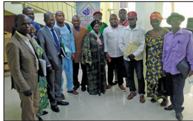
Les acteurs agricoles posant avec le directeur général de l'ADPME

attaché une grande importance à tout ce qui a trait à l'activité agricole. «Le Congo importe par an près de 500 milliards de F CFA en produits alimentaires. Donc, il est grand temps que les producteurs congolais puissent mettre du sérieux dans leur travail pour s'ouvrir au marché international». Il a affirmé que l'ADPME ne ménagera aucun effort pour accompagner les groupements des maraîchers et les entrepreneurs pour la formation et la promotion des produits locaux leur permettant d'accéder au marché international pour la