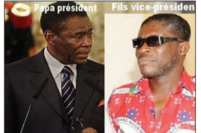
Les deux hommes forts de la Guinée Equatoriale

Le procureur de la République de Guinée équatoriale a requis mercredi 14 février la peine de mort contre 147 opposants, dont des cadres du Parti citoyen pour l'innovation (PCI). Ils sont accusés de «sédition» et d'«attentats contre l'autorité». Le Parti citoyen pour l'innovation dénonce des tortures, et affirme qu'une trentaine de ses militants n'étaient plus capables de se tenir debout lors des audiences qui ont débuté lundi, «en raison de la torture subie» au cours de leur détention à «Guantanamo».