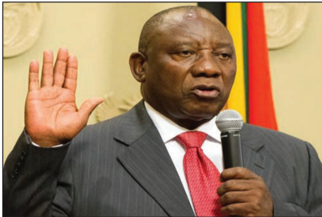
Cyril Ramaphosa pendant la prestation de serment

Elu jeudi 15 février dernier pour assurer la transition jusqu'en 2019, après la démission de Jacob Zuma, l'ancien syndicaliste et homme d'affaires Cyril Ramaphosa a prononcé ses premiers engagements politiques. Ses priorités déclarées sont dans l'éradication de la corruption, phénomène endémique dans le pays, qui a terni le règne de neuf ans de son prédécesseur. Devant le Parlement, il a promis: «Je travaillerai très dur pour essayer de ne pas décevoir le peuple sud-africain».