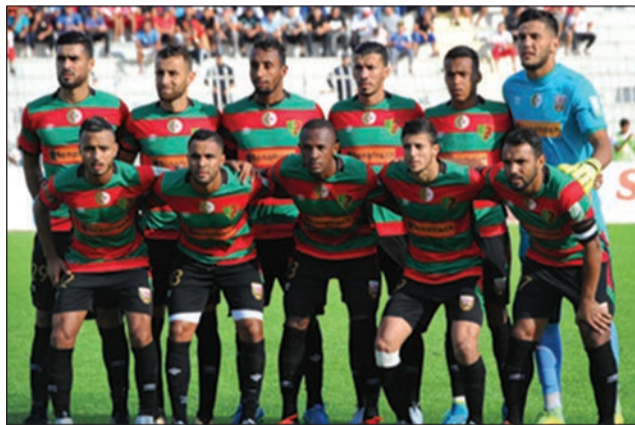
Mouloudia Club d'Alger, adversaire d'Otohô

1. AS Otohô (10 points, +8, 4 matches). 2. La Mancha (10, +3, 4 matches). 3. Diables-Noirs (9 points, +8, 4 matches). 4. AC Léopards (9 points, +6, 4 matches). 5. CARA (9 points, +2, 4 matches). 6. Etoile du Congo (8 points, +3, 4 matches). 7. AS Cheminots (8 points, +3, 5 matches). 8. JST (8 points, -1, 5 matches). 9. V. Club Mokanda (7 points, 0, 5 matches). 10. Patronage Sainte-Anne (5 points, -5, 5 matches). 11. Tongo FC (4 points, -5, 5 matches). 12. FC Kondzo (4 points, -7, 5 matches). 13. Nico-Nicoyé (3 points, 0, 5 matches). 14. JSP (2 points, -5, 5 matches). 15. Inter Club (2 points, -4, 4 matches). 16. Saint-Michel de Ouenzé (2 points, -7, 5 matches).