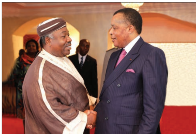
Poignée de main entre les présidents Denis Sassou-Nguesso et Ali Bongo à Kinshasa le 14 février 2018, notamment sur le processus politique en République Démocratique du Congo. Au plan continental, les deux chefs d'Etat ont réitéré leur attachement aux idéaux de l'Union africaine, en vue de la mise en œuvre de l'agenda 2063 et se sont félicités des conclusions du dernier sommet de cette organisation.

aux ressortissants de la CEEAC, prise par tous les Etats membres de cette communauté. Ils ont réaffirmé leur ferme volonté d'impulser davantage le processus d'intégration régionale pour le développement de l'Afrique Centrale tout entière. Le président Denis Sassou-Nguesso a informé son homologue des conclusions de la rencontre tripartite, tenue