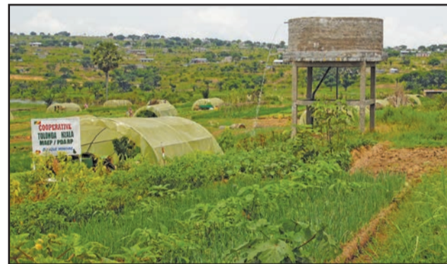
Une vue du Centre de Nsougui

les maraîchers, on peut relever le problème d'engrais. Pour l'heure ils n'utilisent que de l'herbe fraîche comme fumier, écologiquement mais avec des rendements plus réduits. Les maraîchers bénéficient également des investissements réalisés par le financement du PDARP: 4 châteaux d'eau de 25m 3 chacun; 4 motopompes; 2 abris de motopompes; un système d'irrigation (tuyauterie vannes, regard, tuyau tricoflexes, etc.); 854 serres dont 4 champs d'exploitation; 80 équipe-