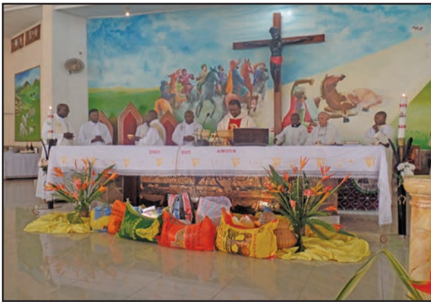
Une vue de l'autel pendant la messe

Dans l'archidiocèse de Brazzaville, la paroisse Saint-Paul de Madibou a été retenue pour la célébration de la Journée mondiale de la vie consacrée. Cette journée est célébrée, le 2 février de chaque année depuis 1997. Une messe a été célébrée, dimanche 4 février 2018, rassemblant beaucoup plus les religieuses venues de plus de quarante-huit congrégations présentes dans l'archidiocèse de Brazzaville et les religieux. Cette fête a été couronnée par un repas avec l'ensemble des invités. Cette messe a été célébrée par le père Nicaise Wilfrid Ossebi, vicaire épiscopal, chargé de la vie consacrée dans l'archidiocèse de Brazzaville, curé de la paroisse Notre-Dame des Victoires de Ouenzé.