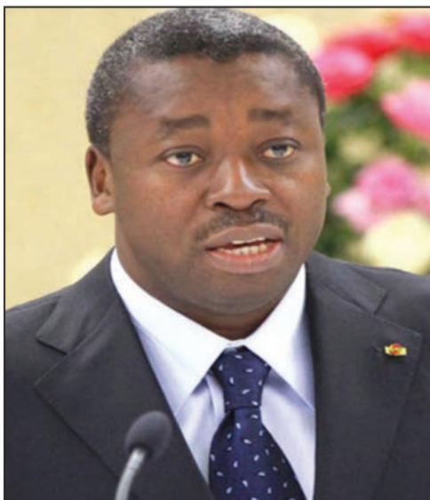
Faure Gnassingbé (P.7)

Un dialogue national pour exorciser des incertitudes de violence