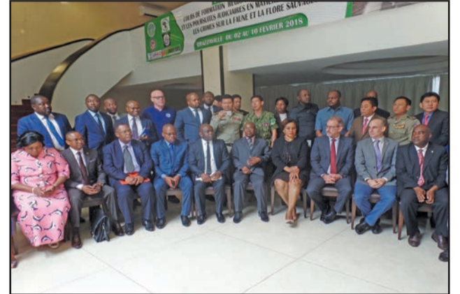
Participants et organisateurs après la cérémonie d'ouverture

Le ministère de l'Economie forestière, l'Equipe spéciale de l'Accord de Lusaka et la Fondation Freeland ont organisé conjointement à Brazzaville, du 5 au 10 février 2018, un atelier de formation sur les enquêtes et les renseignements en matière de lutte contre l'exploitation illégale et le commerce illicite des espèces de la faune et de la flore sauvages d'Afrique.