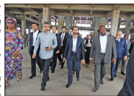
Sheikh Ahmed et les ministres congolais visitant les infrastructures

Sur la qualité des infrastructures visitées, Sheikh Ahmed s'est dit impressionné. «Avec le travail abattu, le monde doit avoir l'opportunité de voir et de venir investir au Congo», a-t-il affirmé. Pour Olga Ebouka-Babackas, ministre du Plan, le Gouvernement a la conviction qu'en installant des services de qualité au Congo, il va