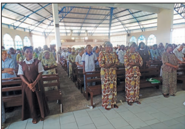
Des religieuses participant à la messe

l'église, don que je fais pour l'église et au service de l'église et de son peuple. La vie est un don que Dieu m'a fait, donc notre vie nous la consacrons au service des pauvres et de l'église. C'est