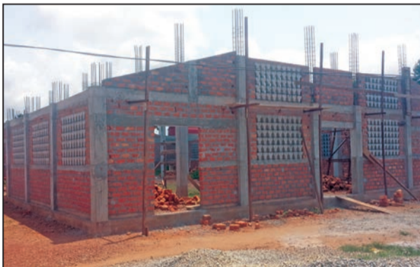
Une vue de la nouvelle église en construction (P.9)