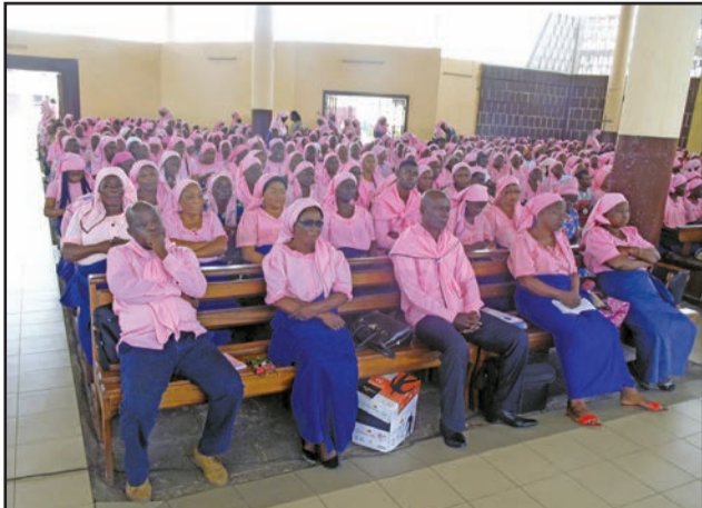
Les membres du bureau diocésain (au 1 er plan) participant à la messe

les participants à la messe à bien formuler les demandes adressées à Dieu, au cours de