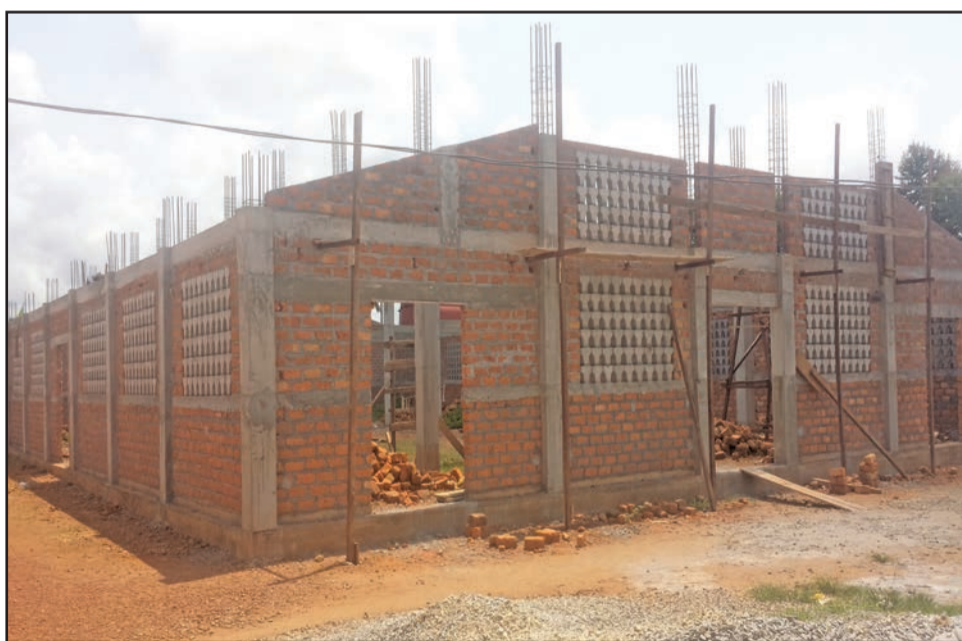
La nouvelle église en construction