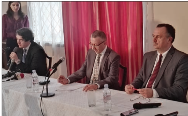
L'ambassadeur, au milieu, pendant la conférence de presse