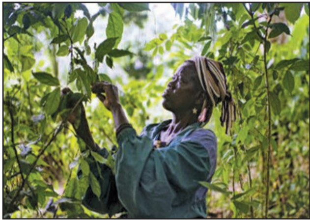
Mettre en place un cadre institutionnel pour le développement d'un modèle efficace de forêts communautaires

La société civile, pour conclure, a fait des recommandations, dans le but d'impulser les changements requis en faveur d'une foresterie communautaire durable et équitable. On peut citer: la promotion d'une notion élargie de la forêt communautaire; l'identification des terres pouvant recueillir des forêts communautaires; l'utilisation de la procédure de reconnaissance des droits fonciers coutumiers; l'aménagement de toutes les concessions forestières et conversion des SDC en forêts communautaires; l'adoption des textes d'application de la loi de 2011 portant promotion et protection des droits des populations autochtones et enfin