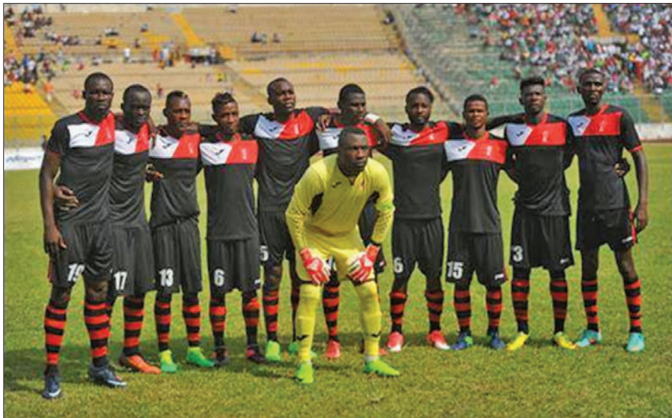
Un gros challenge pour le CARA: éliminer enfin Kotoko de Kumasi