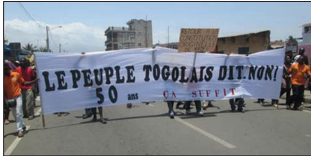
Les opposants exigent le départ du président en place

Kpodzro, a exhorté lundi 12 février ses compatriotes: «Les prières que nous ferons à Dieu pour demander la paix, ces prières-là auront un sens concrètement lorsque toute la Nation se mobilise avec son chef de l'Etat en tête, pour allumer