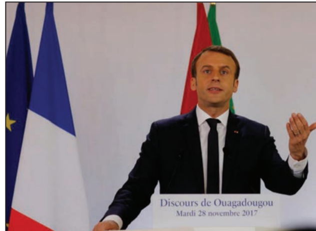
Lors de son passage à Ouagadougou, Emmanuel Macron affichait déjà son engagement pour faire évoluer la Francophonie

Le monde francophone a célébré, le 20 mars dernier, la Journée internationale de la francophonie. Une manière de redorer le blason de la langue française dans les différents pays où elle est pratiquée et où elle semble en recul. En France, le président