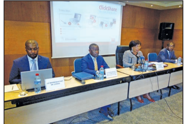
Le présidium de la rencontre.

Mougany, les membres du comité de pilotage et les administrations partenaires doivent valider une option technique et fonctionnelle proposée par le groupement Manstrict consulting et CAMAX et déjà enrichie par les divers apports techniques, dont le plus récent est le test réussi de connexion entre le greffe du Tribunal de commerce et l'antenne ACPCE de Brazzaville via la fibre optique de Congo Télécom, soldé par la délivrance du RCCM en quinze minutes seulement. «Le résultat va nous faire avancer dans notre démarche favorisant l'éclosion et l'épanouissement d'un entrepreneuriat dynamique dans notre pays. Le Gouvernement tend vers l'informatisation, l'interconnexion et la mise en réseau du guichet unique de création des entre-