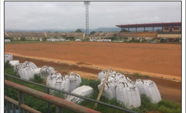
Stocks de gazon synthétique au bord de l'aire de jeu

Avez-vous visité le Stade Denis Sassou Nguesso de Dolisie, dans le département du Niari? Il se trouve aujourd'hui dans un état d'abandon. Les travaux d'installation de la pelouse synthétique commencés tambour battant, sont stoppés alors que l'arrêt des pluies constaté actuellement est propice à leur reprise.