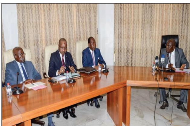
Le ministre et les opérateurs économiques