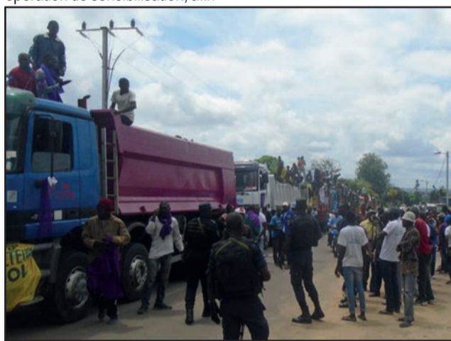
Le convoi de camions au départ de Brazzaville