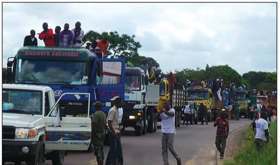
Le convoi des véhicules marquant l'ouverture officielle de la route

Les auteurs d'actes répréhensibles subiront la loi