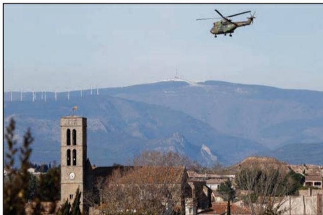
Un hélicoptère de l'armée survolant le village de Thèbes

Quant à l'attentat qui a frappé la deuxième ville égyptienne, il a été causé par une voiture piégée, qui a explosé samedi, tuant au moins un policier et faisant quatre blessés. L'explosion s'est produite près d'un commissariat, deux jours avant l'élection présidentielle se déroulant du lundi 26 au