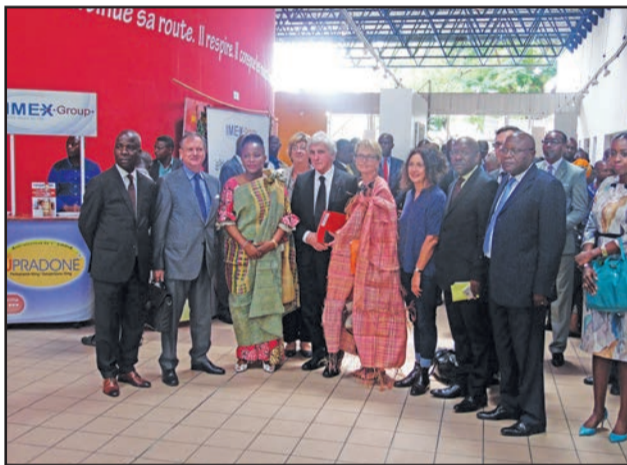
Une photo de famille, après la journée de mobilisation

chance à l'Afrique. La France est bien disponible à soutenir les actions du Gouvernement congolais qui contribuent à la «Les médicaments, qui sont vendus au Congo de manière non appropriée sont pollués, non seulement par des importateurs véreux, mais surtout par ceux qui vendent sur des étalages non appropriés. Ils constituent un crime exacerbé», a affirmé Philippe Ngondongo, directeur général de l'Observatoire de lutte contre les faux médicaments au Congo. Il a dégagé les mesures pour éradiquer ce phénomène, notamment la réforme pharmaceutique, la promotion de la santé. Il a invité les Congolais à prendre la pleine mesure du danger des