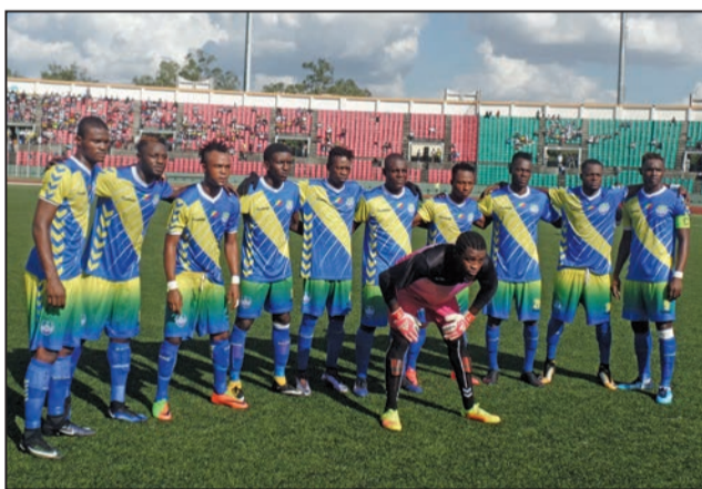
AS Otohô, un déplacement périlleux à Madingou

Le lendemain, toujours à Massamba-Débat, Saint-Michel de Ouenzé a engrangé le plus