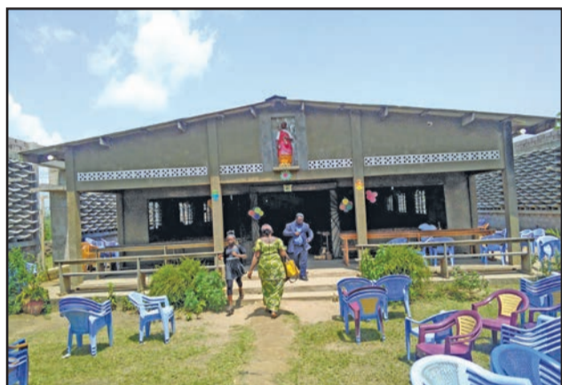
L'ancienne église Saint-André Kaggwa