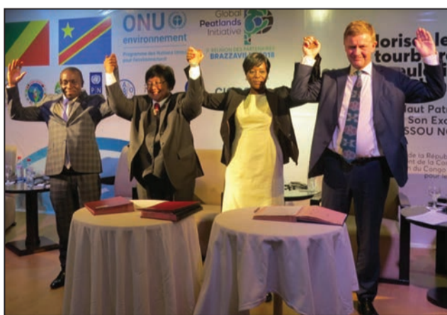
Après la signature de la déclaration de Brazzaville

la Convention de Ramsar, l'Accord de Paris, les Objectifs de développement durable, etc. Par ailleurs, ils se sont engagés à mettre en œuvre une coordination et une coopération entre différents secteurs gouvernementaux afin de protéger les avantages fournis par les écosystèmes de tourbières. A cet effet, les pays se sont engagés à mettre en place des cadres nationaux multisectoriels et multidisciplinaires pour assurer la gestion des tourbières de la Cuvette centrale du bassin du Congo; mettre en place