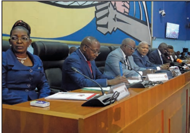
Le bureau de l'Assemblée nationale

Le projet de loi portant organisation et fonctionnement de la Cour constitutionnelle apporte, quant à lui, des innovations