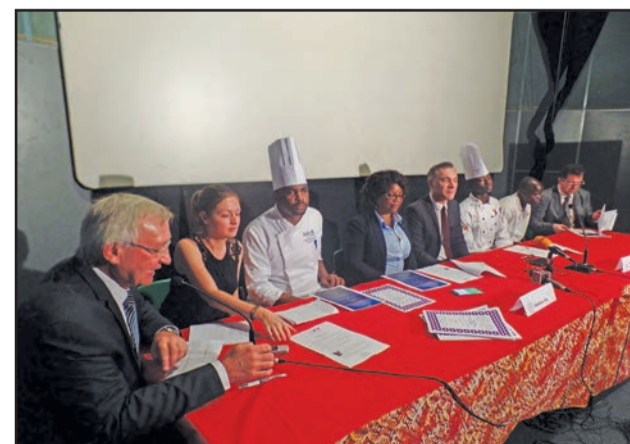
Les animateurs de la conférence de presse