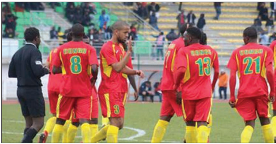
Les Diables-Rouges ont retrouvé le sourire à Mantes-la-Ville

Ce match et le stage des Diables-Rouges à Amiens qui l'a précédé ont donc défrayé la chronique. Le match était initialement programmé le lundi 26 mars à Amiens. Mercredi 21 mars, on apprend son annulation purement et simplement pour des raisons qui ne sont pas encore révélées officiellement. Elles seraient, tout de même, d'ordre financière selon une source officielle. La même source explique