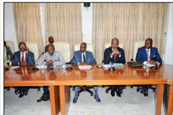
Les représentants des opérateurs économiques

Le ministre Calixte Nganongo, le Gouvernement attend de cette mission la production d'un fichier unique de la dette commerciale validée de la période allant du 1 er janvier 2014 au 31 décembre 2016. Il attend aussi des recommandations sur les modes d'apurement possibles en fonction des caractéristiques de la dette ou sur les procédures de gestion de la dette. «L'enjeu pour le Gouvernement est de connaître le stock de la dette intérieure commerciale réelle. Il convient de signaler que les négociations que nous menons avec le FMI ont abouti à une seule conclusion, c'est celle de la dette que le FMI a qualifiée de non-soutenable», a-t-il indiqué.