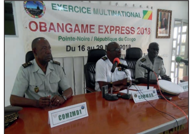
Le présidium au lancement de l'opération

La criminalité maritime constitue aujourd'hui un véritable fléau dans le Golfe de Guinée. Elle est multiforme, et prend parfois une extension insoupçonnée. Les pays de la sous-région sont déterminés à mettre en œuvre une nouvelle approche fondée sur l'amélioration de la sécurité maritime.