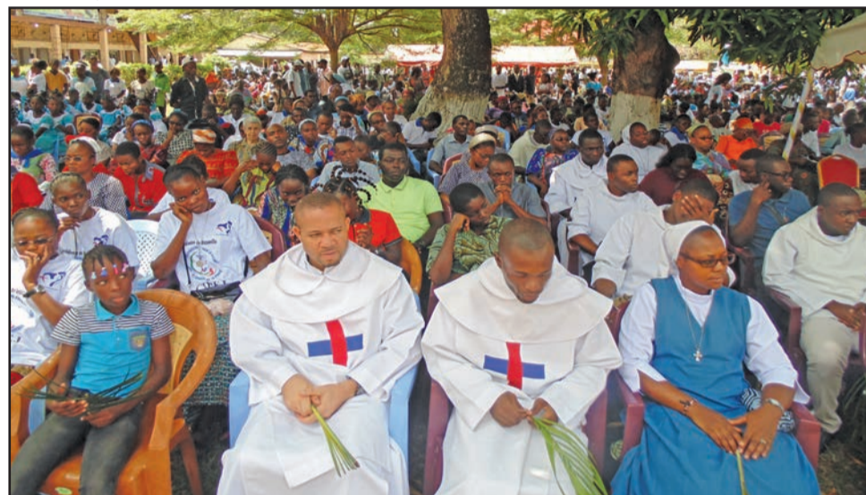
Les participants à la messe

l'archidiocèse de Brazzaville, Mgr Anatole Milandou a exhorté les enfants et les jeunes à lutter contre les déviances sur tous les plans: familial, social, et missions régaliennes consistant à s'occuper de l'éducation des enfants et jeunes, afin de garantir à la société congolaise et à l'Eglise un avenir rassurant,