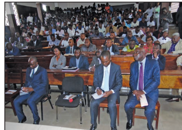
Vue partielle de l'assistance pendant la conférence inaugurale