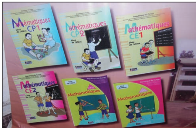
Les nouveaux manuels de mathématiques du cycle primaire

est structurée de la manière suivante: -Le thème (Pré-numérotation, structuration du temps et de l'espace, Numérotation, Opérations, Géométrie, Dénombrément, Proportionnalité, Mesure); -La notion à enseigner ou l'objet d'apprentissage (Le titre de la leçon); -Les objectifs spécifiques du programme. Cette collection, a dit Thomas Makosso, directeur général de l'INRAP, est une version contextualisée de différents manuels, autrefois en usage dans plusieurs pays francophones, notamment le calcul au quotidien, Auriol...ou les mathématiques tirées du projet CONFEMEN. «Le manuel scolaire classiquement composé de textes et d'images, synthétise, structure et rend accessible le temps de connaissances d'une discipline donnée pour assurer les bases d'un même apprentissage et d'une culture partagée à un âge donné. Il transmet donc à l'usage des plus jeunes le capital culturel qui peut les aider à un moment précis», a souligné