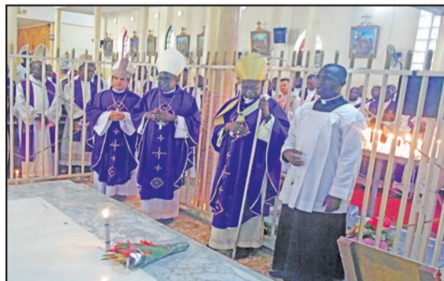
Pendant le dépôt de la gerbe de fleurs sur la tombe du Cardinal

repères, de valeurs, la figure du Cardinal Emile Biayenda est un modèle à imiter, à inculquer», a déclaré l'archevêque.