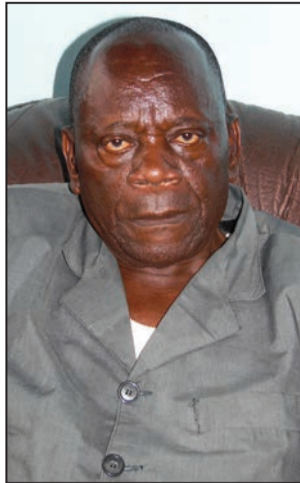
Abel Godefroy Bouckas

Président du Rassemblement des acteurs démocrates (RAD), un groupement politique situé à l'opposition modérée, Abel Godefroy Bouckas est également la troisième personnalité du Haut conseil national des sages du Congo. Dans cette interview exclusive, il parle de son groupement politique, de la collaboration du RAD avec le chef de file de l'opposition, Pascal Tsaty Mabiata, du processus de paix dans le département du Pool et de la session criminelle qui s'ouvre à Brazzaville.