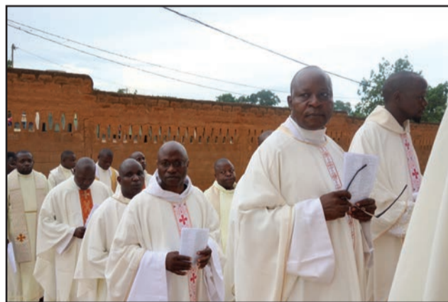
Les prêtres du diocèse de Nkayi en procession

zareth. Et se mit à l'écoute de la Parole de Dieu, la discerna et la vécut comme l'aujourd'hui de la mission que son Père lui avait confiée. Ecouter (Kuwidikila): Dieu nous rejoint de manière silencieuse et discrète dans notre vie. Il faut savoir l'écouter à travers sa parole, à travers le quotidien des événements de la vie. Nous aussi, nous avons la mission de lire et d'écouter la parole de Dieu non seulement dans nos églises et oratoires, mais surtout dans nos maisons (Inzo). Discerner (Kudimitila): En lisant dans la synagogue de Nazareth le passage du prophète Isaïe, Jésus discerne le contenu et le contenant de la mission pour laquelle il a été envoyé et la présente à ceux qui attendaient le Messie. Aujourd'hui nous avons grand besoin du discernement et de prophétie, surtout en ce temps de Médias, de communications sociales: Internet, Facebook, WhatsApp... Vivre (Kuzinga): Jésus annonce que les temps sont accomplis et proclame l'amour miséricordieux de Dieu pour toute la création. Chacun de nous est appelé du point de vue vocation dans le mariage,