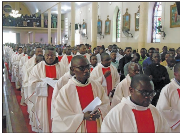
Les prêtres en procession

sera implantée au mont Cardinal Emile Biayenda, à Djiri, dans le 9 e arrondissement de Brazzaville. De même, l'archevêque a rappelé la nouvelle de la retraite mondiale des prêtres, à Ars en France, du 22