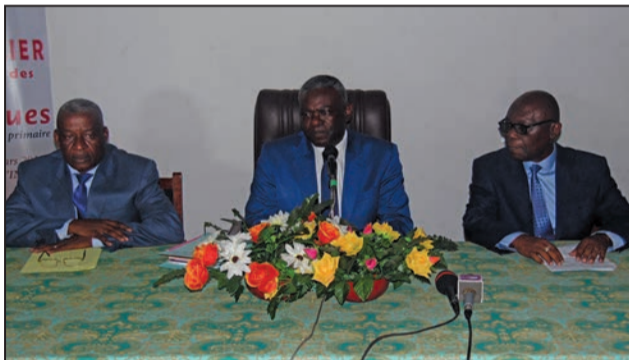
Une vue du présidium

Des cadres provenant de douze départements scolaires du Congo, plus précisément des inspecteurs en charge du cycle d'enseignement primaire, participent à un séminaire-atelier au maniement des manuels de mathématiques au programme du cycle primaire, du 26 au 30 mars 2018, à l'Institut national de recherche et d'action pédagogique (INRAP), à Brazzaville.