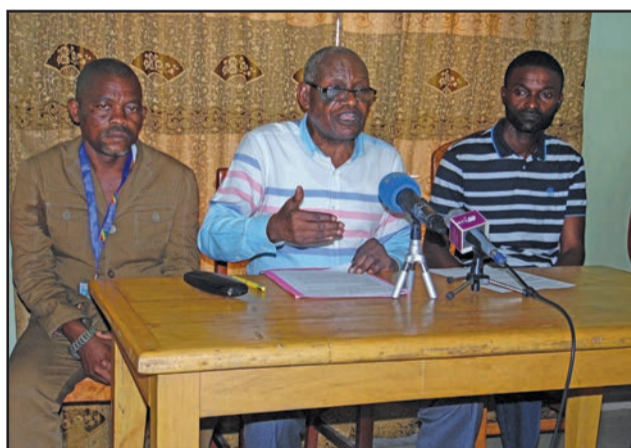
Le président Loamba Moke (au milieu)

Vu la crise politique qui persiste dans ce pays, l'ADHUC a reçu une pétition des demandeurs d'asile en détresse, convertis en migrants clandestins en République du Congo, en date du 18 octobre