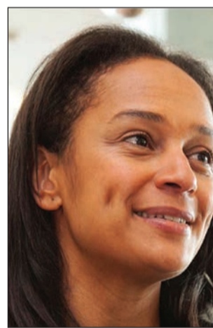
Isabel dos Santos

Ces limogeages qui concernent entre autres les enfants dos Santos frappent le symbole du népotisme reproché à l'ancien régime. Isabel dos Santos, fille de l'ex-président a été limogée de la direction de la compagnie pétrolière nationale