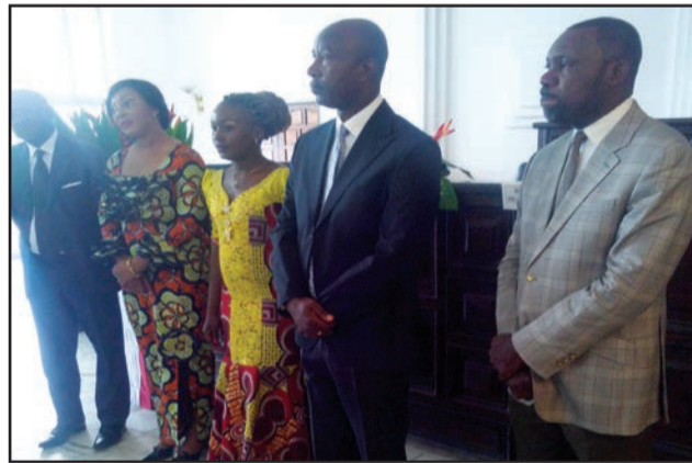
Les membres du bureau exécutif