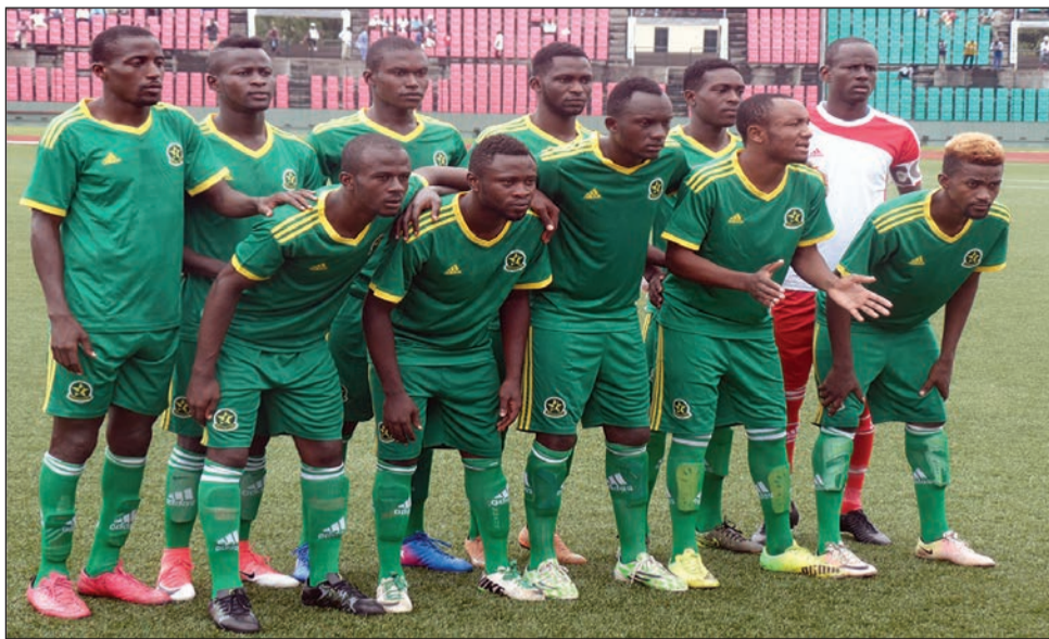
L'Etoile du Congo se refait une santé après avoir rajeuni son effectif (Ph d'arch.)

Sur ces entrefaites, Patronage Sainte-Anne et Inter Club