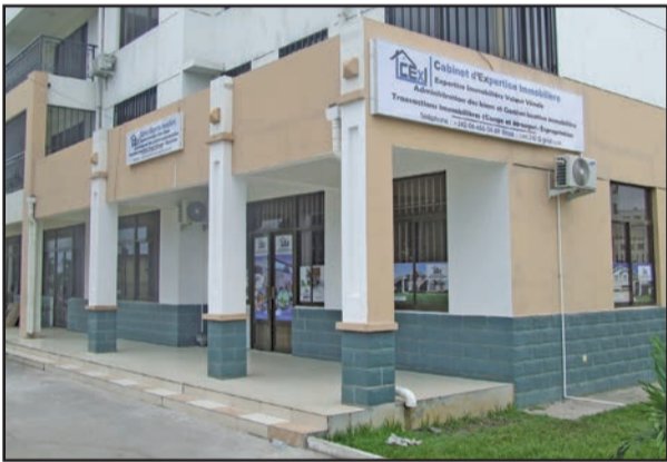
Une vue du siège de l'agence

de traitement et la garantie pour les usagers, d'un service sur mesure», selon le manager général de ce cabinet.