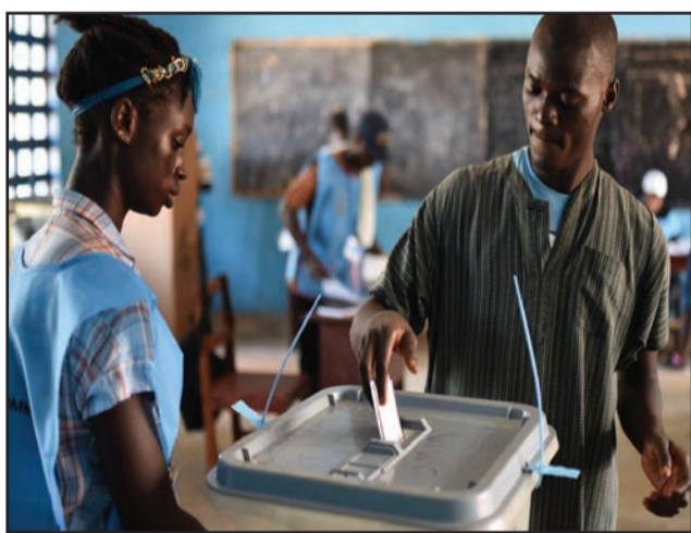
Une séquence du vote

La Haute cour du pays a donné des instructions à la NEC pour assurer la transparence et l'intégrité des résultats, notamment la communication des procès-verbaux aux représentants des deux partis et leur affichage dans chaque bureau de vote. Cette décision fait suite à une autre qu'elle a rendue samedi dernier et à travers laquelle, elle ordonnait