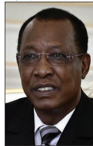
Idriss Déby Itno

En lieu et place d'un Sénat, un «Haut conseil des collectivités territoriales décentralisées» sera créé. Il sera composé de membres nommés et élus. Le pays sera désormais découpé en 17 «provinces», contre 23 «régions» auparavant. Dans un souci d'économies, la Cour des comptes, le Conseil constitutionnel et la Haute cour de justice deviennent des chambres de la Cour suprême. Lors de son discours d'ouverture, le 19 mars, Idriss Déby avait annoncé la création d'une IV e République. «Le socle de la nouvelle République a été posé», s'est-il réjoui. Sa mise en place définitive suppose une nouvelle Constitution qui sera soumise à référendum. Le statut de l'opposition et la Commission nationale des droits de l'homme seront aussi inscrits dans la Constitution qui consacrerait le passage à la 4 e République. Mais pour Saleh Kebzabo, l'un des opposants farouches du régime au pouvoir, «Idriss Déby n'a aucune solution pour le Tchad». Contre vents et marées, l'homme fort du Tchad entend bien s'éterniser au pouvoir. Après le vote de la nouvelle Constitution, Idriss Déby aura la possibilité de se représenter en 2020 et en 2026.