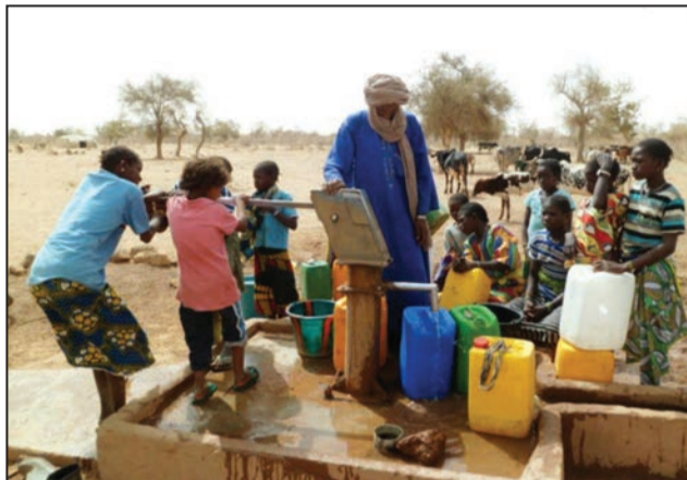
Garantir de l'eau potable aux populations pour les garder en vie

L'un des principaux objectifs du Forum était de sensibiliser et de mobiliser les décideurs sur