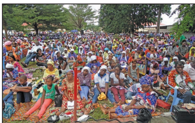
La chrétienté s'était mobilisée pour manifester la ferveur de la dévotion au Cardinal Emile Biayenda.

Prenant pour modèle l'humilité et la piété qui sont les vertus fondamentales du Cardinal,