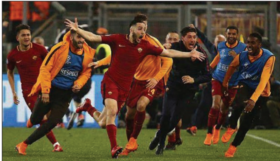
Immense exploit de la Roma qui renverse et élimine Barcelone

L'AS Roma d'Italie vient de créer la sensation dans le football européen. Elle a démolit et éliminé en quarts de finale le FC Barcelone, l'un des grands favoris de la Ligue des champions au terme d'une soirée incroyable, mardi 10 avril, à laquelle personne n'avait songé.