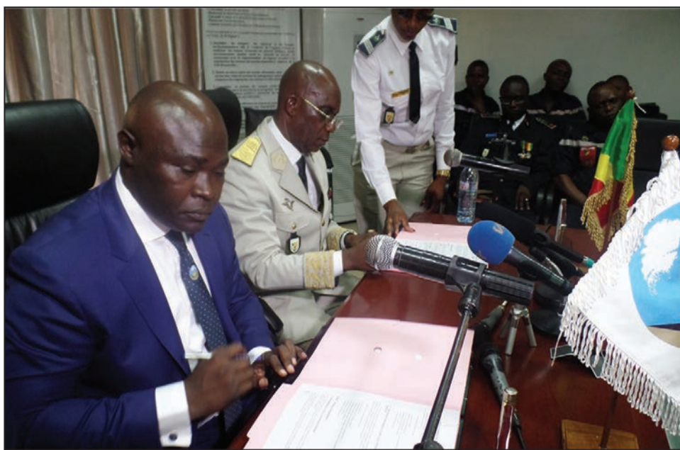
Les deux responsables signant le protocole d'assistance mutuelle

à coup sûr, d'orienter nos actions vers une assistance partagée et bénéfique pour la population congolaise. Ce protocole, non seulement définit tous les contours de cette coopération en matière d'intervention contre les sinistres, mais il constitue aussi un cadre légal de partage d'expérience entre les intervenants de nos structures et le gage d'une meilleure organisation des