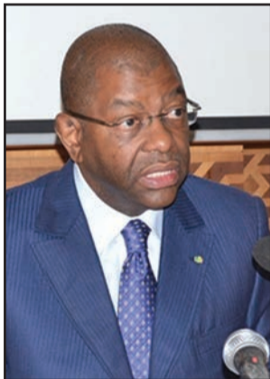
Alexandre Barro Chambrier

Les élections législatives au Gabon prévues pour fin avril 2018 suscitent déjà l'enthousiasme, tant au niveau des partis de la majorité présidentielle qu'à ceux de l'opposition. Jean Ping, principal opposant gabonais qui continue de revendiquer la victoire à l'élection présidentielle de 2016, ne veut pas aller à ces législatives. Si quelques partis qui lui sont proches disent «nié» à ces élections, plusieurs autres et pas des moindres sont quant à eux favorables à ce scrutin.