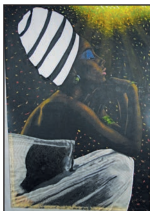
Un tableau de l'artiste