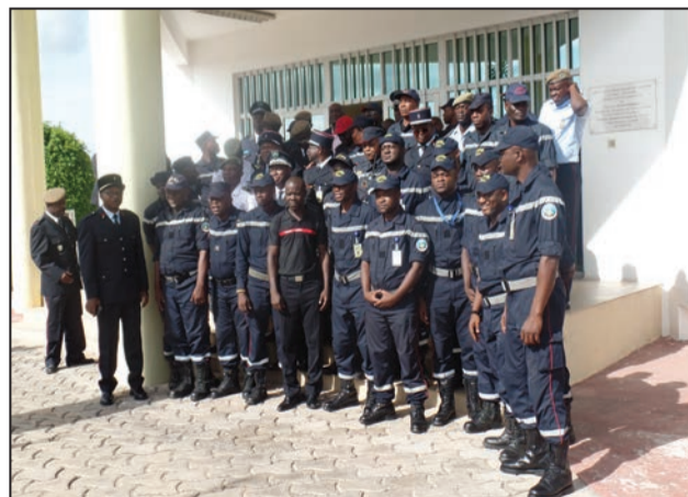
Photo de famille des sapeurs-pompiers