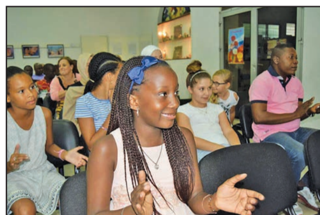
Des spectateurs admiratifs du spectacle s'offrant à leurs yeux

Les membres du Club de langue russe et le quatuor d'artistes confirmés (pianiste, drummer, saxophoniste, guitariste), sous la houlette de Freddy Mabanza, ont également apporté leur grain de sel dans la réussite de ce show. En interprétant, avec brio, quelques morceaux russes.