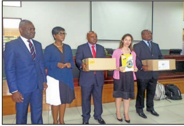
Les parties signataires posant avec un échantillon de manuels

6. 500 cahiers d'activités sont produits pour 6.500 élèves des collèges du Congo, répartis ainsi: Brazzaville (3.300 livres); Pointe-Noire (2.200 livres); Bouenza (5.00 livres); Sangha