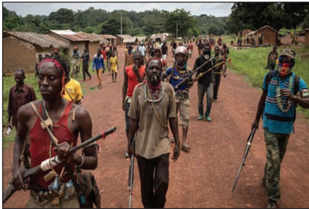
Les seigneurs de guerre du PK5

Après les combats de la nuit de samedi 7 à dimanche 8 avril, les affrontements se sont intensifiés à Bangui la capitale centrafricaine. Des échanges de tirs se sont poursuivis mardi 10 avril au quartier PK5 entre groupes d'autodéfense et forces onusiennes de la Mission des Nations unies pour la stabilisation en Centrafrique (MINUSCA). Au moins vingt-quatre personnes ont été tuées dans ces affrontements, et des dizaines d'autres blessées. Dans les provinces, les mêmes tensions sont à nouveau déplorées.