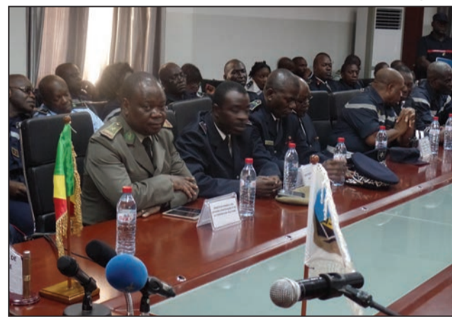
Vue de l'assistance

tiens d'assistance mutuelle portant sur trois domaines: la lutte contre l'incendie, sauvetage et assistance