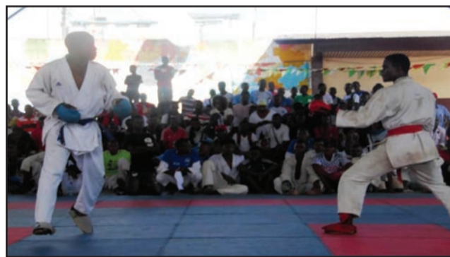
Une vue d'un combat