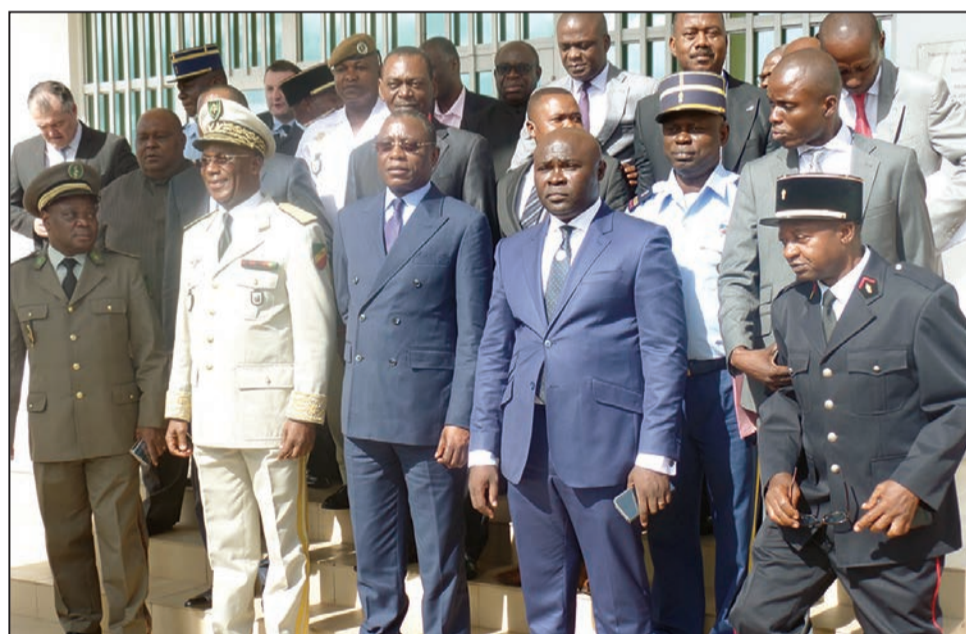
Les officiels à la fin de la cérémonie