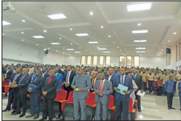
Les participants à la cérémonie de signature

projet Edu-Conservation fait de l'éducation des jeunes un levier majeur pour rééquilibrer les impacts de la satisfaction des besoins humains et la nécessaire conservation de l'environnement naturel», a indiqué Claire Duval. Les départements de Brazzaville, Pointe-Noire, Bouenza et Sangha sont retenus pour cette phase pilote du projet.