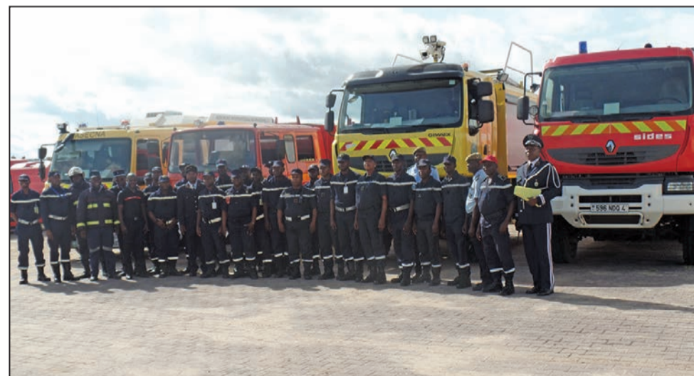
Les sapeurs-pompiers devant leurs camions d'intervention

tenaires peut avoir besoin de l'autre. Ce protocole est un engagement qui ouvre une nouvelle ère de coopération entre l'ASECNA et la Direction générale de la sécurité civile du Congo, au profit des populations. L'accord définit les condi-