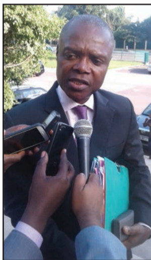
Serge Blaise Zoniaba.

en matière de maintenance et d'entretien des équipements», a expliqué Serge Blaise Zoniaba, ministre de l'Energie et de hydraulique. Face à cette contrainte, le Gouvernement a opté pour une structure plus opérationnelle, «vers la création d'une société anonyme de droit OHADA, pour un mode de gestion privé avec une dimension commerciale plus affirmée», a fait savoir le ministre qui pense que la SNE ne parvient pas à délivrer, au plan de la qualité et de la quantité, le service public pour lequel elle a été instituée. Pour preuve, près de la moitié de la consommation de la SNE n'est pas facturée. «La tenue des fichiers clients étant approximative, les consommations de l'Etat et de ses démembrements n'étant pas systématiquement évaluées. La facturation au forfait dominante ainsi que l'application extensive de la gratuité à des personnalités et aux agents de la société obèrent lourdement les finances de la société. En 2016, la SNE a réalisé un déficit d'environ 45 milliards de francs CFA», a-t-il constaté.