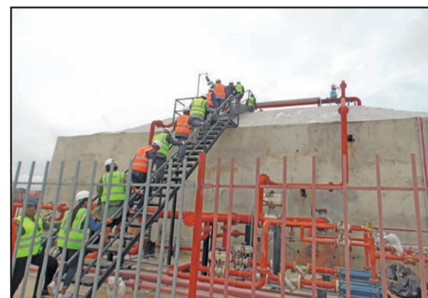
Le sarcophage abritant les cuves de gaz butane

de gaz. Nous allons bientôt inaugurer cette unité qui va produire environ 4.000 bouteilles par