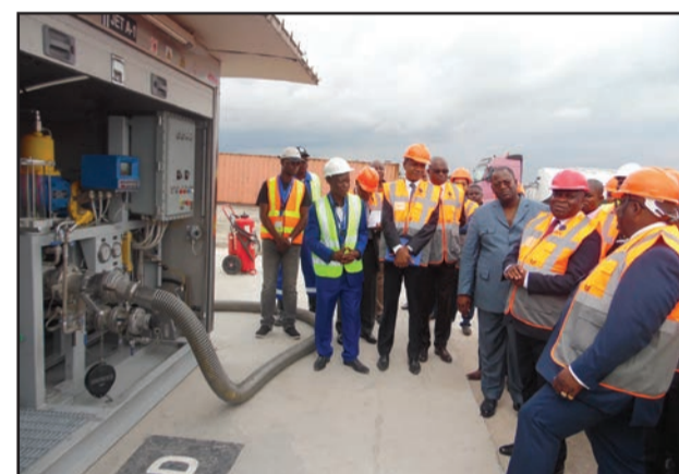
Devant le poste de chargement des camions citernes

jour. Nous avons une stratégie commerciale qui sera dévoilée d'ici peu, mais déjà, je peux dire que les stations-service