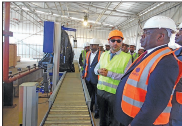
Chaîne d'enfutage des bouteilles de gaz

résolution de ce problème, en mettant en place une unité de stockage et d'enfutage et de distribution du gaz butane. Non pas pour concurrence avec la société GPL SA qui œuvre déjà dans ce secteur d'activités, mais plutôt pour combler le déficit,