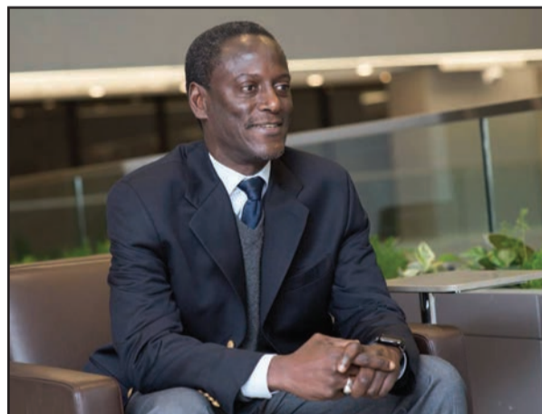
Abdoul Aziz Wane

L'adoption du projet de programme conclu avec le Gouvernement assujettie à la bonne gouvernance