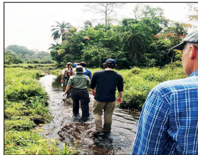
L'Ambassadeur Haskell et sa famille près d'Odzala

et le Gouvernement congolais pour protéger la faune dans de vastes régions du nord du Congo. Par exemple, les populations de grands singes et d'éléphants sont restées stables dans le paysage de Ndoki-Likouala, où des études récentes sur la faune montrent des populations stables de grands singes (estimés à 56 000 individus) et d'éléphants (estimés à 10 550 individus). C'est en grande partie grâce au Gouvernement congolais et à ses partenaires; et à un cadre de gestion innovant qui place les partenaires du secteur privé et les communautés locales au cœur des efforts de conservation. Le développement de l'écotourisme est, depuis longtemps, une priorité dans les aires protégées telles que le Parc National de Nouabale-Ndoki, où les chercheurs ont suivi, pendant des années, trois groupes de gorilles dans la forêt, de sorte qu'il y a maintenant 17 gorilles habitués à la présence d'observateurs humains. Le soutien du Gouvernement américain a aidé à construire des maisons d'hôtes, et des tentes touristiques ont été construites; le secteur privé prévoit déjà d'investir dans des infrastructures touristiques supplémentaires au cours