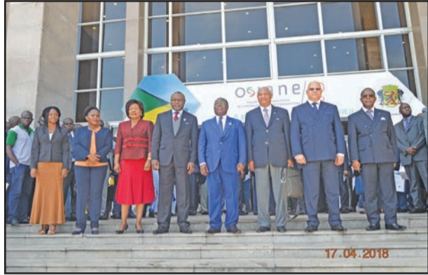
Les officiels posant pour la postérité

L'initiative de l'association Pratic, Brazzaville a abrité du 17 au 19 avril 2018 la 2 e édition du Salon international des technologies de l'information et de l'innovation (Osiane), sur le thème: «Le développement économique et le défi de l'industrie du futur». Cette rencontre a été ouverte par le Premier ministre, Clément Mouamba, en présence d'un effectif important des membres du Gouvernement et des chefs d'entreprises de la place exerçant dans le champ numérique.