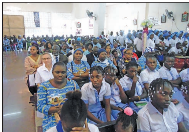
Le Peuple de Dieu participant à la messe

Les chrétiens sont venus nombreux à cette messe, au point où des chapiteaux ont été installés dans la cour paroissiale sous lesquels ceux qui n'avaient pas eu de place dans l'église ont participé à la messe en la suivant sur des écrans.