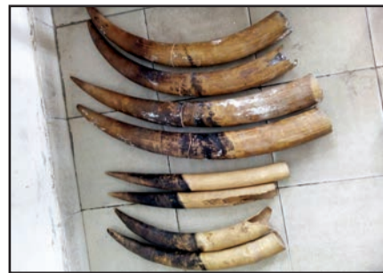
Le trafic de défenses d'éléphants est sévèrement puni par la loi congolaise

Ces présumés trafiquants de pointes d'ivoire ont été arrêtés conformément à la loi du 28 novembre 2008 sur la faune et les aires protégées au Congo, grâce aux efforts conjoints des agents des différentes directions départementales des Eaux-et-forêts de la Cuvette et de la Lé-