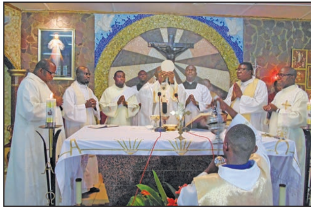
Mgr Anatole Milandou présidant l'eucharistie

Dans la joie des enfants de Dieu, la paroisse Saint-Pie X de l'OMS située dans la partie sud de l'archidiocèse de Brazzaville, dans le 8 e arrondissement de la ville-capitale, a reçu Mgr Anatole Milandou, archevêque de Brazzaville, dimanche 15 avril 2018. En ce troisième dimanche de Pâques, il est venu prier et soutenir dans la foi cette communauté paroissiale qui compte des anglophones, en raison de sa proximité avec le siège du bureau régional de l'Organisation mondiale de la santé (OMS). Célébrée par l'archevêque, la messe a été concélébrée par l'abbé Bertholin Bahoumina, administrateur paroissial de Saint-Pie X de l'OMS, et cinq prêtres.