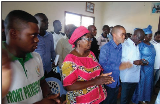
Les militants et élus du Front patriotique

d'un idéal, la discipline. Nous voulons marcher avec la qualité et non la quantité. Voilà pourquoi, lorsqu'il y a des camarades qui claquent la porte, ça ne nous fait ni chaud ni froid. C'est la quantité qui part et la qualité reste. Ce qui est bien, c'est que nous n'avons jamais fait de veillée lorsque quelqu'un démissionnait du parti. Au contraire, ça nous arrange»,