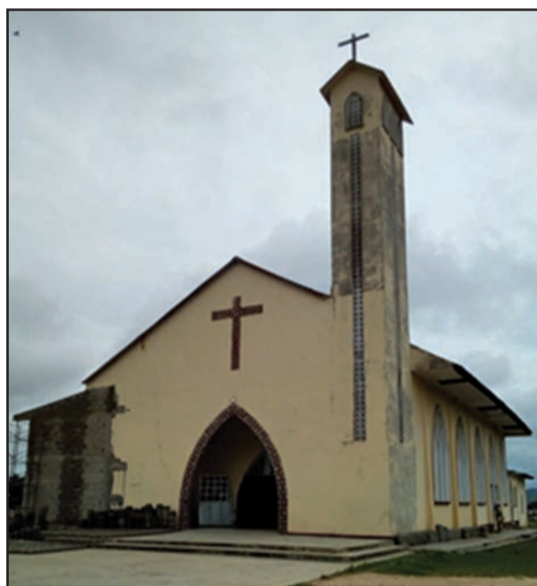
La cathédrale Sainte-Monique en chantier (P.9)

Cathédrale Sainte-Monique (Diocèse de Kinkala)