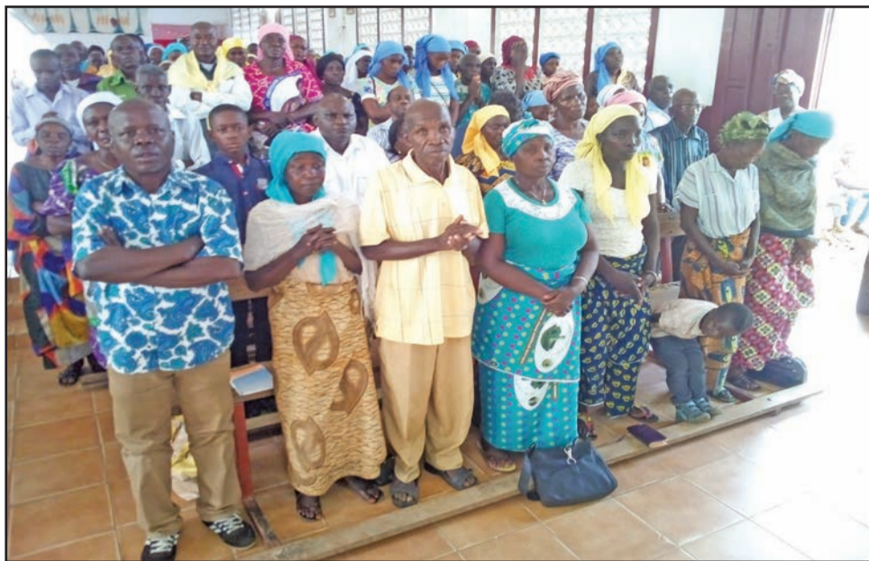
Le Peuple de Dieu participant à la messe

Dans son homélie prononcée en lari (langue liturgique du diocèse), le célébrant faisant sienne la recommandation de l'Eglise de prier pour les vocations, a dressé deux tableaux des bergers: le faux berger et le bon berger. «Sur le registre des faux bergers sont logés tous ceux