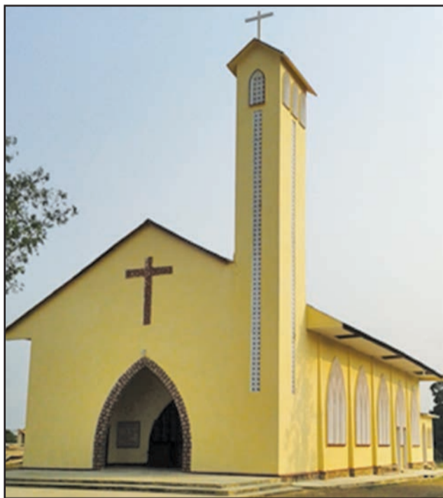
La cathédrale Sainte-Monique de Kinkala