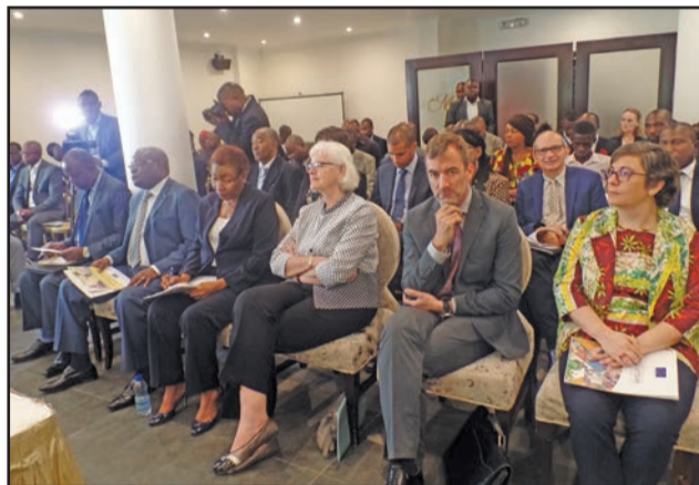
L'auditoire pendant la présentation des projets

Le projet « Amélioration des revenus agricoles à travers