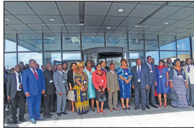
Photo de famille à l'ouverture du Forum