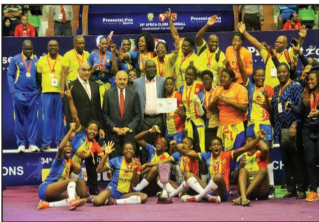
Petro Atletico d'Angola, vainqueur du tournoi féminin

La seule équipe qui a approché le podium est Abo-Sport. Elle est parvenue en demi-finales non sans avoir perdu deux matches en phase de groupes face respectivement à FAP du Cameroun (23-25) et Pe-