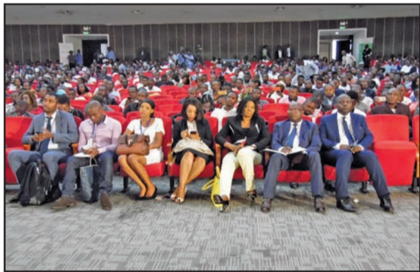
Une vue des participants à l'ouverture du salon

Osiane, une plateforme de promotion, de rencontre et un accélérateur des changements engendrant l'enrichissement des entreprises, ainsi que l'amélioration des politiques publiques en intégrant la culture numérique offre aux acteurs en général et ceux du numérique en particulier, un accès direct aux décideurs politiques et chefs d'entreprises afin de présenter les solutions et outils numériques contribuant à améliorer les performances des entreprises publiques ou privées. Le salon ambitionne d'être un outil pour accompagner, conseiller et orienter les administrations publiques désirent se moderniser en améliorant leur système d'information.