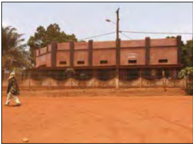
Sinistre devant la Préfecture de Bambari

Localité située au centre de la République centrafricaine, Bambari a connu une journée de violences sanglantes mardi 15 mai dernier après l'entrée dans cette ville de nombreux éléments armés. Bilan: pillage de trois Organisations non gouvernementales et au moins six personnes ont perdu la vie. Ces nouvelles tensions font craindre pour la sécurité des habitants, alors que les groupes armés ont quitté la localité il y a 15 mois.