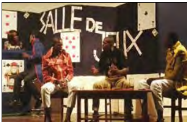
Les comédiens sur scène