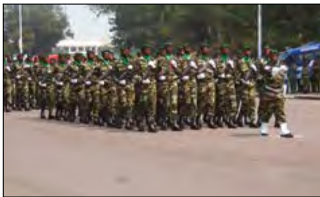
«Tout militaire est justiciable devant les juridictions à condition que sa hiérarchie soit mise au courant».