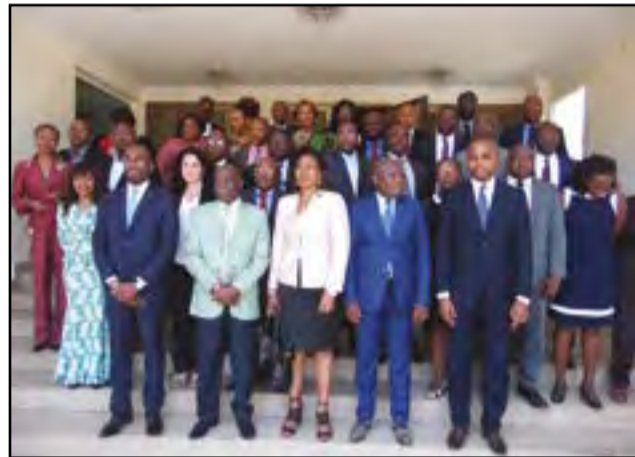
Les experts de la CEEAC/CEMAC

organisationnelles de la CEEAC et de la CEMAC, les deux organismes économiques régionaux en charge de conduire le processus d'intégration des marchés et de la mise en œuvre de l'Accord de facilitation des échanges édicté par l'OMC.