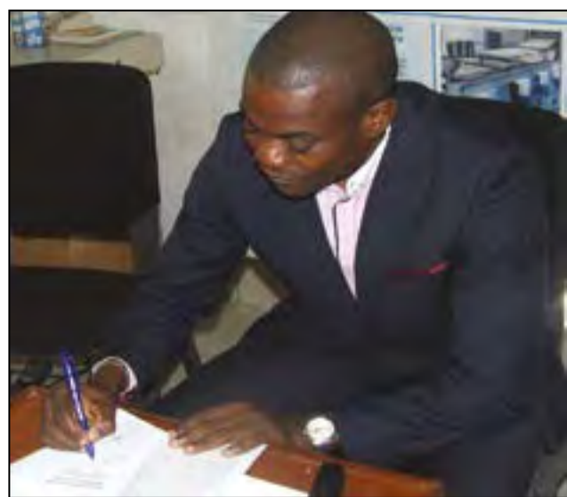
L'auteur dédicant son livre