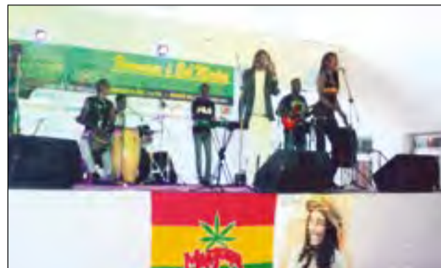
Le groupe «I Jah Child's» sur scène