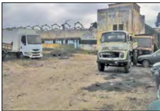
L'usine SOTEXCO en l'état actuel

tion. Mais le déficit fut très lourd, officiellement 305.000.000 de Francs. Pour 1971, alors qu'il était prévu un déficit de 112.000.000 de Francs, ce chiffre était déjà atteint au bout du premier semestre malgré les palliatifs employés. Devant les difficultés de vente, on avait décidé, pour écouler les stocks, de créer des tenues de travail obligatoires pour tous les participants au défilé du 1 er mai 1971. Ceci avait permis de doubler et même tripler les ventes en mars et avril 1971. A tort ou à raison, les produits de SOTEXCO étaient boudés par la clientèle qui reprochait à ses tissus d'être de moins