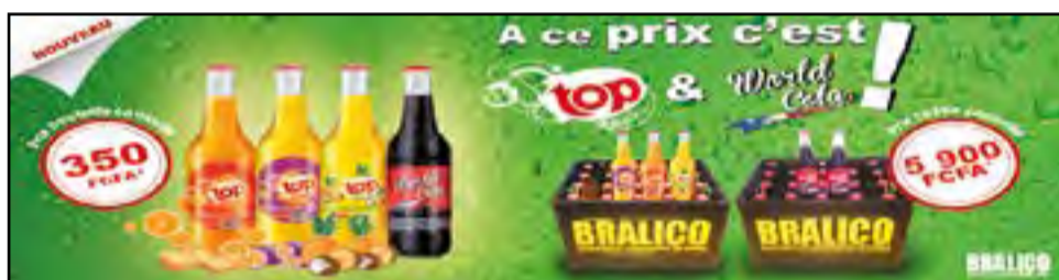
Les boissons gazeuses de BRALICO

TOP les parfums préférés ou recherchés, et dans notre World Cola le bon goût de