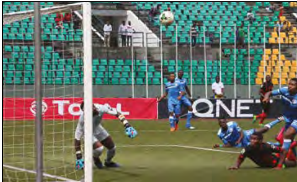
D'une tête plongeante Racine Louamba a débouqué le compteur-but du CARA

Alors qu'il traverse une mauvaise passe depuis plusieurs semaines, et déjà battu lors de la première journée de la phase de poules de la Coupe de la Confédération, le CARA de Brazzaville a créé la sensation mercredi 16 mai au Stade Massamba-Débat, en s'offrant une colossale et somptueuse victoire aux dépens des Nigériens d'Enyimba: 3-0. Trois buts à zéro! Les attaquants du CARA ont triplement fait parler la poudre, telles des gousses d'arbre de fer en septembre. Dans une défense d'Enyimba désemparée. Qui aurait osé pronostiquer un score d'une telle ampleur en ces temps de vaches maigres pour les Aiglons? Assurément, personne! C'est le vague à l'âme que quelques centaines de spectateurs ont investi les gradins du temple du football congolais. Ogre et bête noire des équipes congolaises, FC Enyimba d'Aba inspirait la crainte. Diables-Noirs et Saint-Michel de Ouenzé ne gardent-ils pas de cet adversaire un mauvais souvenir quand ils avaient décousu avec lui respectivement en 2008 et 2011? Les oiseaux de mauvais augure ont chanté également que tout ce que touche le CARA était frappé de stérilité. Il fallait bien être là pour le vivre et le voir.