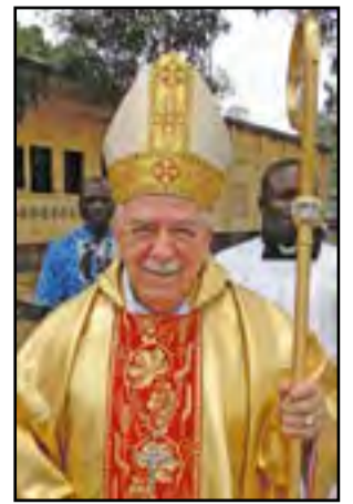
Mgr Miguel Olaverri

Nous poursuivons la présentation de l'interview de Mgr Miguel Olaverri, Evêque de Pointe-Noire. Dans ce numéro, l'Evêque nous parle du contexte œcuménique dans son diocèse, par ailleurs connu pour la présence d'Eglises chrétiennes et de mouvements synchrétiques.