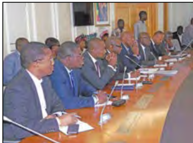
Les experts de la BAD

projet. D'où l'importance de réformer un certain nombre de secteurs dans le domaine des infrastructures pour les rendre financièrement viables afin de