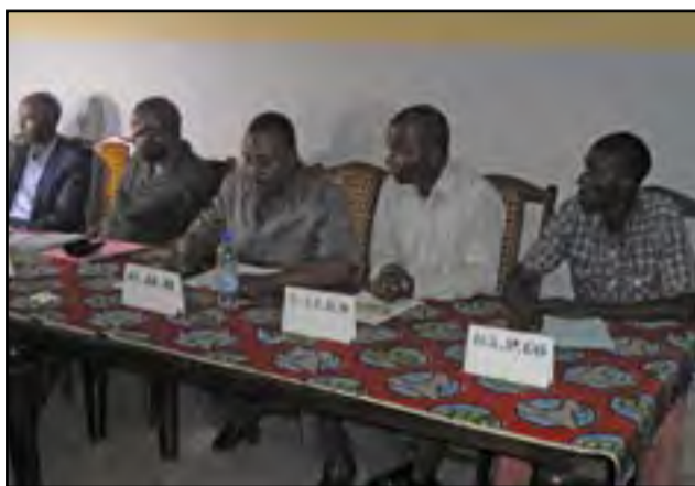
Quelques leaders des partis membres de la coordination de l'ARD

Et de s'attaquer au président qui, selon eux, n'entreprend rien pour contraindre les dignitaires du pouvoir qui ont planqué l'argent public dans des comptes privés à l'étranger, à rapatrier au Congo, l'argent public détourné. «Pourtant tous ces responsables indéliables sont bien connus de lui. Ils sont 60 qui, selon les Panama Papers ont des comptes privés à Panama. En Chine, 4 dignitaires du pouvoir congolais totalisent à eux seuls, près de 6 mille milliards de F cfa dans leurs comptes privés. Des sources dignes de foi signalent l'existence d'autres comptes privés où l'argent public congolais a été logé, au Brésil, à Singapour, à l'Ile-Maurice, au Koweït, aux Emirats Arabes Unis, en Espagne, en Côte-d'Ivoire, en Guinée-Conakry, au Niger, en RDC, en Angola, au Maroc... ces fonds atteignent un montant de 9 milliards 147 millions de dollars, soit, 5 488 milliards 200 millions de F.cfa. etc». Afin de sortir le pays de la crise «gravissime» qu'il traverse, l'ARD pense que «le PCT, la mouvance présidentielle et le Gouvernement, principaux responsables du chaos actuel, doivent faire leur autocritique, demander pardon au peuple Congolais, reconnaître publiquement que