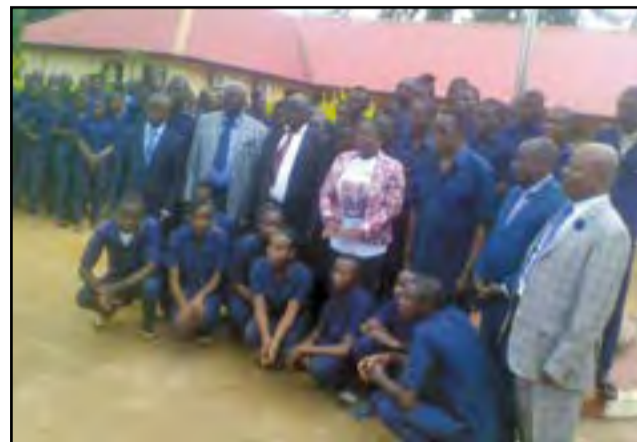
La Ministre et les élèves après la levée de couleurs

La levée des couleurs dans les établissements scolaires. Ainsi ses activités se sont concentrées autour des