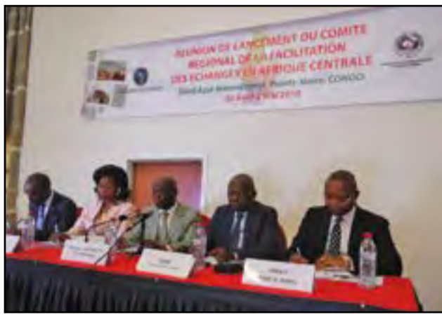
Le présidium des travaux CEEAC/CEMAC

C'est donc pour lever ces contraintes de capacités que la CEEAC et la CEMAC ont pris chacune un certain nombre