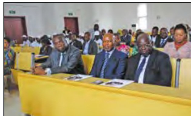
Quelques responsables universitaires au premier plan