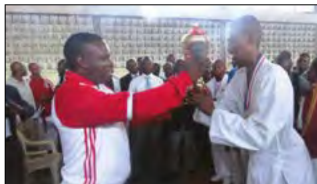
Le capitaine de l'équipe championne recevant le trophée

C'est sur le sacre de Congo mat que s'est achevé le 29 avril dernier, à l'Institut technique Thomas Sankara de Pointe-Noire, les championnats départementaux de karaté, style shotokan. Ses budokas étaient les mieux outillés techniquement et tactiquement que ceux des autres clubs. Plus de 129 budokas, toutes catégories confondues, ont rivalisé d'ardeur pendant deux jours, tant en kumité (combat) individuel qu'en équipe. Les amoureux des arts martiaux, ainsi que les non pratiquants venus de tous les coins de la ville, ont eu droit à plus de quatre-vingt-cinq combats d'un niveau technique acceptable. Au terme de la compétition, la commission technique départementale dirigée par maître Antoine Tchivanga Mbeté, a unanimement désigné Oba Ciceck (Atc), meilleur compétiteur du tournoi. Prélude à ces championnats, et pour ne pas être en déphasage avec les innovations intervenues à la WKF (Fédération mondiale de