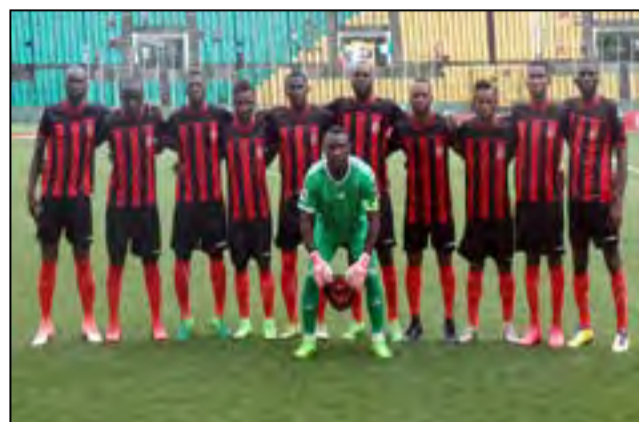
Les Aiglons face au FC Enyimba (Nigeria)