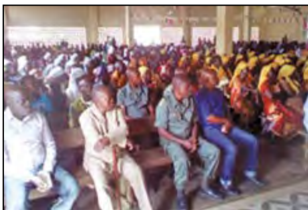
Les participants à la messe

doit tourner la page pour se mobiliser pour un nouveau combat: celui de la reconstruction dont la victoire n'est possible qu'en faisant usage de l'arme de l'amour,