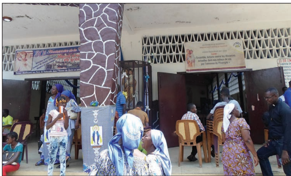
La devanture de l'église de Saint-Joseph de Tout pour le peuple