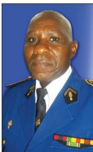
Colonel Bède Florentin Mbika

Son passage à l'Ecole de la Gendarmerie nationale l'a amené à occuper les fonctions de chef de section documentation, instructeur en police judiciaire; officier des traditions, chargé de la sécurité du Centre d'instruction, commandant la première compagnie d'instruction;