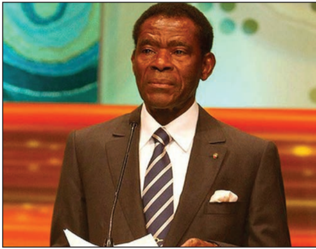
Teodoro Obiang Nguema Mbasogo

Le président équato-guinéen Teodoro Obiang Nguema Mbasogo, a invité lundi 11 juin 2018 l'opposition à une table ronde en juillet prochain. L'annonce a été suivie d'un décret publié dans la nuit du 13 au 14 juin, dans lequel il précise les conditions de cette main tendue à l'opposition en vue du dialogue. Mais l'opposition en exil pose ses conditions pour participer à ce rendez-vous qui devrait décrire le climat politique dans le pays, empoisonné par le putsch manqué fin 2017 contre Obiang Nguema. Ce putsch a occasionné l'emprisonnement de plusieurs opposants.