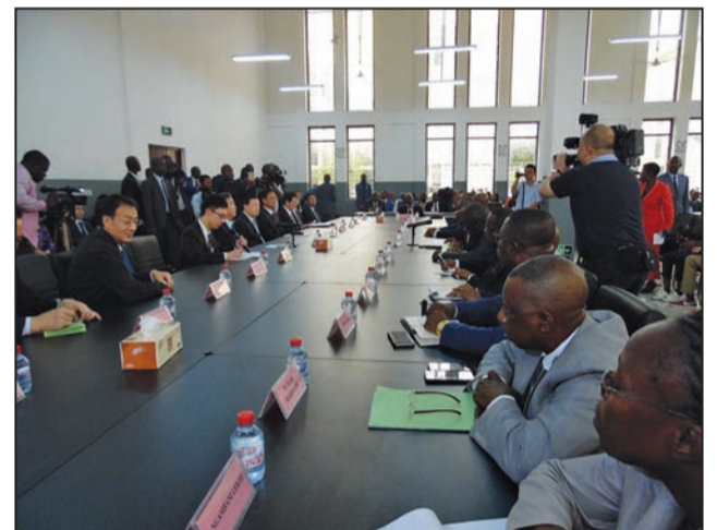
Les deux parties pendant l'échange

En visite de travail au Congo du 11 au 13 juin 2018, le président du Comité national de la conférence consultative politique du peuple chinois, M.Wang Yang, a eu des échanges avec plusieurs autorités congolaises, parmi lesquelles le ministre de l'Enseignement primaire, secondaire et de l'alphabétisation, Anatole Collinet Makosso le 12 juin. En présence du ministre de l'Aménagement du territoire, Jean Jacques Bouya, cette séance de travail s'est déroulée au complexe scolaire Gampo-Olilou Révolution (Ouenzé), une œuvre architecturale fruit de la coopération sino-congolaise, inaugurée en octobre dernier par le président Denis Sassou Nguesso. «Si le Gouvernement chinois est venu en aide au Congo, c'est parce que lorsque nous, les Chinois, en ont besoin, les Congolais viennent nous aider. Lorsque nous étions frappés par un tremblement de terre, le président Sassou Nguesso avait pris la décision de financer la construction d'une école sino-congolaise», a dit M.Wang yang. Une preuve de coopération gagnant-gagnant entre les deux Etats.