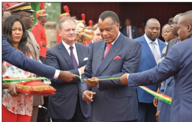
Le "Président de la République coupant le ruban symbolique

Réalisé par la société Razel-Bec sous le contrôle de la société Egis International, le module case De Gaulle - rond-point Fulbert Youlou de la route de la Corniche de Brazzaville a été inauguré le 15 juin dernier par le président Denis Sassou Nguesso. Les travaux de cet axe routier de 4,6 km, démarrés en mars 2015, ont coûté environ 45 milliards de Fcfa. Ils ont été financés par l'Agence Française de Développement (AFD) dans le cadre de la mise en œuvre du contrat de désendettement et de développement signé entre la France et le Congo. Plusieurs autorités politico-administratives et des chefs de missions diplomatiques accrédités au Congo ont pris part à cette cérémonie agrémentée par des danses traditionnelles.