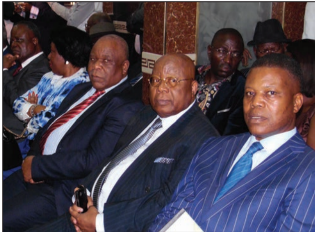
... de l'opposition congolaise