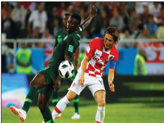
La Croatie (maillot à damier) a renversé le Nigeria

du monde en titre. Tout s'est passé comme si le sol avait basculé sous les pieds de l'Allemagne. On l'assimile à un défi. Les roucoulements en sont simplement scandalisés. Dans la foulée mexicaine, un pays inattendu lui aus-