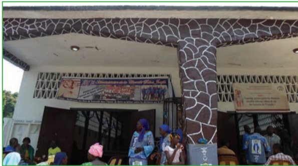
Une vue du parvis de l'église (P.9)

Un Dimanche en paroisse Saint-Joseph de Tout pour le peuple