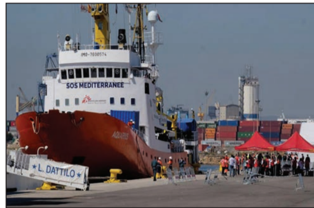
Accostage de l'Aquarius à Valence en Espagne

Malgré de graves risques encourus dans des itinéraires empruntés et le chiffre affreux de cadavres des migrants repêchés dans ce lugubre mouvoir qu'est la Méditerranée, les Africains sont de plus en plus nombreux à quitter leurs pays pour l'Occident où ils estiment trouver le paradis. Au péril de leur vie, 629 migrants, en majorité ressortissants de