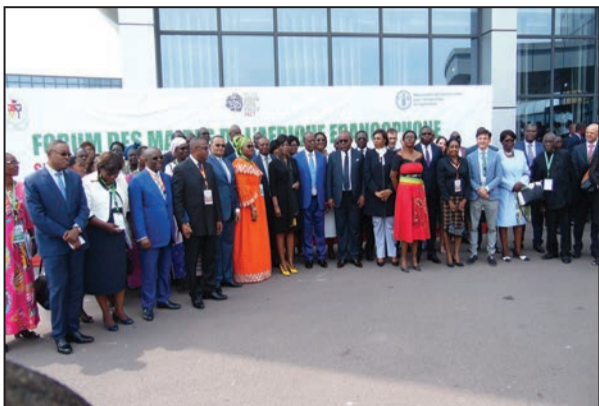
Les participants posant avec le ministre d'Etat

Passer en revue l'état actuel de l'agriculture, examiner les évolutions raisonnablement prévisibles, puis proposer des solutions possibles aux préoccupations des acteurs de terrain. Tel est l'essentiel de l'agenda proposé par le Forum des maires de l'Afrique Francophone, signataires du Pacte de Milan sur la politique alimentaire urbaine. Le forum s'est tenu du 12 au 14 juin 2018 à Kintélé. Organisé par la mairie de Brazzaville, avec l'appui technique de