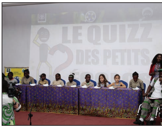
Dix écoles de Pointe-Noire ont participé à un quizz sur le thème de l'environnement