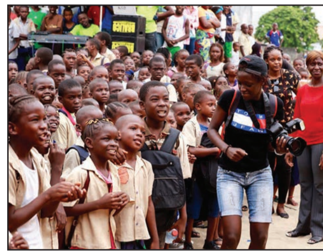
La caravane itinérante a eu lieu du 23 au 30 mai 2018 à Pointe-Noire

A signaler que la Fondation AVSI est une ONG internationale d'origine italienne présente dans 30 pays, dont le Congo depuis 2011. Elle mène des projets de coopération au développement durable dans le secteur de l'éducation, de la formation professionnelle, de l'agriculture et de la santé. Au Congo, la Fondation AVSI travaille en faveur des enfants,