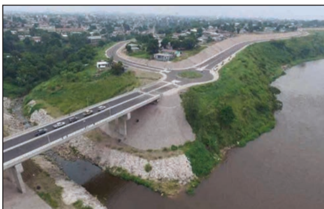
Vue partielle du tronçon inauguré

Construit pour améliorer la desserte des deux premiers arrondissements de Brazzaville, dans le prolongement du premier tronçon Mami Wata-Case De Gaulle, entre le giratoire De Gaulle à Bacongo et celui de Fulbert Youlou à Makélékélé, le deuxième tronçon de la corniche sud de Brazzaville long de 4,5 km est constitué d'une double voie de 7 m chacune, séparées par un terre-plein central végétalisé d'un mètre. Il comporte cinq giratoires: Renard, Kimbangu, Kitengué, Makélékélé, Youlou et permet le franchissement de la ravine de Makélékélé grâce à un viaduc de 116 m de long et 20 m de large. Les giratoires favorisant l'interconnexion avec le réseau urbain des quartiers Bacongo et Makélékélé d'autant que la corniche constitue une nouvelle liaison inter-quartier alternative à l'avenue de l'OUA.