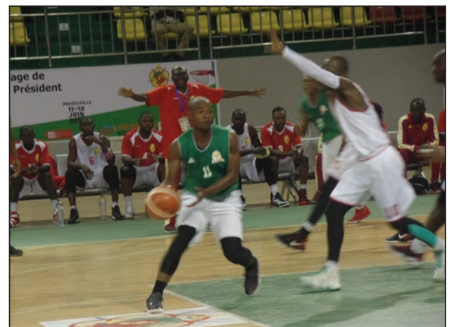
L'Ivoirien Dago (11) aux prises avec le Congolais V. Assoua

Progressivement l'équipe camerounaise a refait son retard avec beaucoup de courage. Elle réussissait à coiffer le Sénégal de 2 points à la mi-temps: 31-28. Plus expérimentés, les Sénégalais reprenaient l'avantage au troisième quart temps: 46-45. La rencontre sera ensuite caractérisée par une vraie bataille des nerfs et