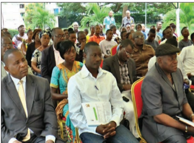
Le public lors de la conférence de presse

Kongo «est devenu un objet épistémologique étudié par les historiens, anthropologues, ethnolo-