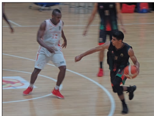
Une phase disputée entre le Maroc et le Cameroun

Quarts de finale: Sénégal bat Cameroun (69-55), Angola bat Algérie (79-70), Maroc bat Kenya