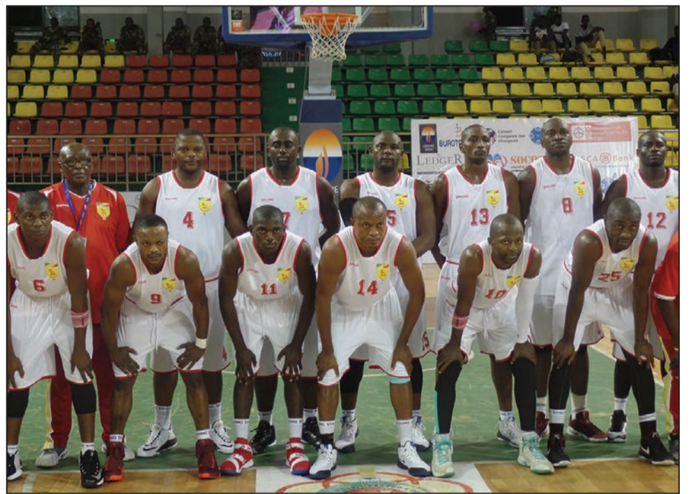
L'équipe nationale militaire du Congo