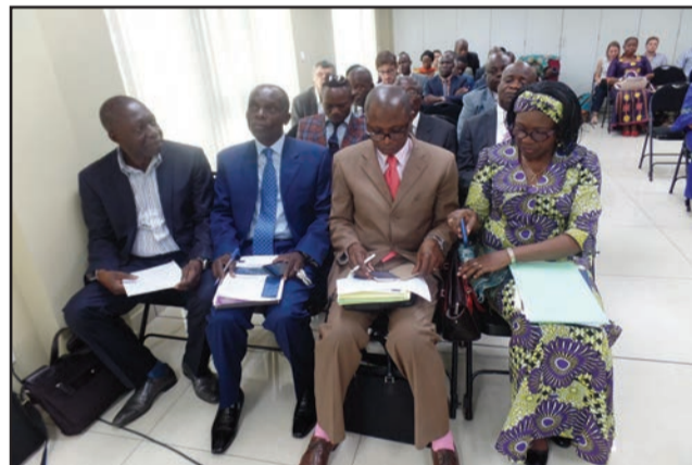
Les responsables du ministère du Plan et les participants

C'est au cours de l'atelier de restitution regroupant plusieurs participants, dont les maires de ces trois villes et les représentants de certains ministères techniques, des ONG, ainsi que de divers experts d'organismes internationaux qu'ont été discutées les actions à mener dans ces villes. L'urbanisation des villes et la construction de nouvelles infrastructures ont occasionné une augmentation des populations et de création des nouveaux besoins. A ces titres, les villes congolaises sont désormais confrontées aux problèmes de gestion des