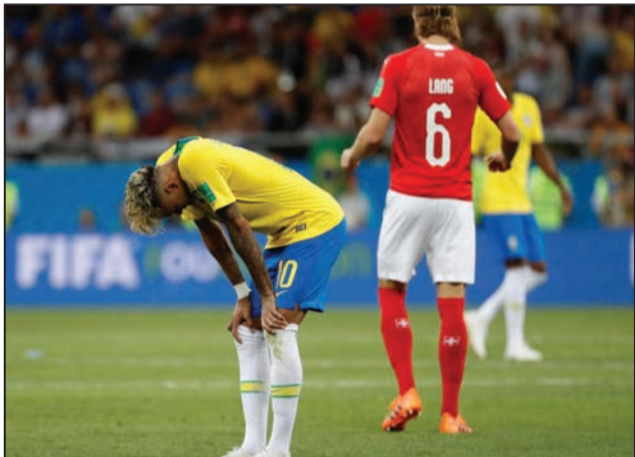
Une déception: Neymar et le Brésil

du monde en titre. Tout s'est passé comme si le sol avait basculé sous les pieds de l'Allemagne. On l'assimile à un défi. Les roucoulements en sont simplement scandalisés. Dans la foulée mexicaine, un pays inattendu lui aus-