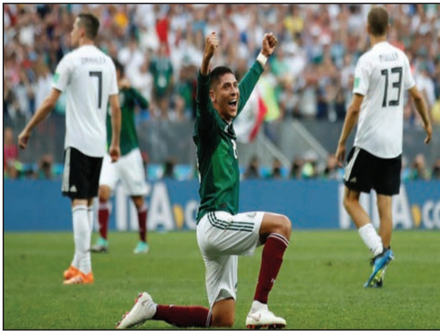
Le Mexique a célébré son incroyable victoire

On n'oubliera pas de sitôt l'entrée explosive du Mexique, à Moscou, dans le groupe F. Déjouant les pronostics les plus raisonnables, il a foudroyé impitoyablement le champion