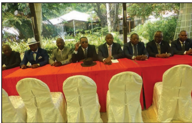
Les représentants et leaders des partis membres de la COPAR

Dans un style ampoulé, elle affirme qu'elle ne veut pas cautionner toute approche «de nivellement et de déni de ses luttes pour l'avènement d'une démocratie consensuelle assise sur une République fraternelle et solidaire». Au nombre des auto-mérites de ses luttes, elle cite «l'octroi d'un statut du chef de file de l'opposition. Or, il en est fait aujourd'hui une interprétation préférentielle et fantaisiste aux fins politiciennes», estiment les dirigeants de la COPAR qui dénoncent une «attitude d'un âge rétrograde, d'une frange de l'opposition». Les partis de la COPAR se sont donc désengagés des conclusions arrêtées autour du chef de file de l'opposition lors de la rencontre du mercredi 13 juin dernier. A cette réunion, le PRL, le parti d'Antoine Thomas