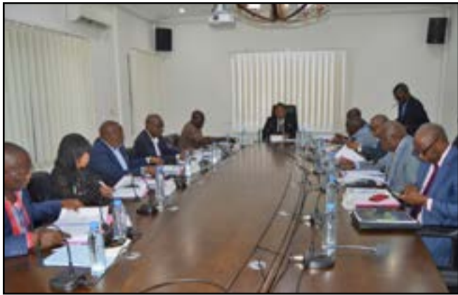
Les membres du Comité exécutif en conclave

Les membres du Comité exécutif ont, au bout de trois jours de conclave, adopté avec amendements le règlement financier et le statut standard des Ligues. De même, ils ont approuvé le