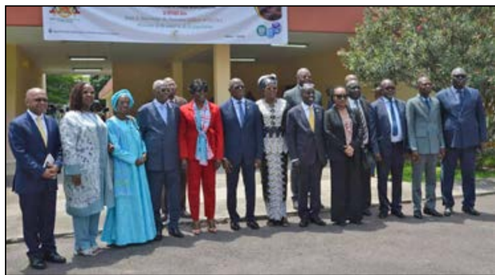
Pour la postérité

Pour lui, la distribution des kits opératoires est l'une des stratégies que