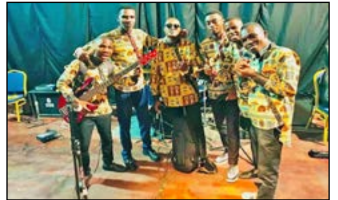
Une vue des artistes-musiciens sur scène