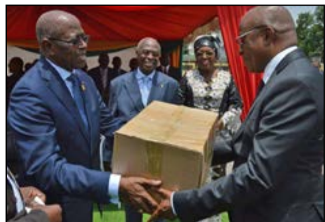
Le ministre Gilbert Mokoki remettant un échantillon de kit au directeur général de l'hôpital Mère-enfant Blanche Gomes

cace, a-t-il poursuivi, « les kits ont été répartis dans trois catégories: Kit n°1 pour les opérations avec anesthésie locorégionale; le kit n°2 pour les opérations avec anesthésie générale et le kit n°3 qui contient les produits en vrac complémentaires des différents kits et les produits de réanimation ». Pour lui, il est dans l'intérêt des pouvoirs publics d'élaborer les normes et les directives permettant aux formations sanitaires de fournir des soins de quali-