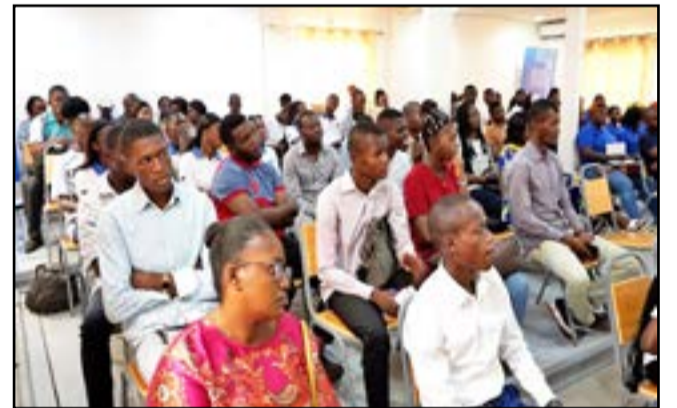
L'ensemble des étudiants

Dans le but d'accompagner les jeunes de la ville océane dans la vie professionnelle, l'Agence congolaise pour l'emploi (ACPE), au cours d'un moment de discussions et d'échanges, a indiqué qu'une structure a été mise au point pour les étudiants et chercheurs d'emploi de Pointe-Noire. Il s'agit d'un Club d'emploi. Sa mission: informer sur les emplois et sur les démarches à suivre afin d'en décrocher. Cette rencontre a eu lieu le vendredi 17 février dernier.