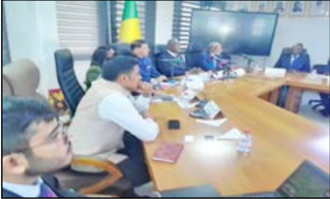
Les membres du Gouvernement avec la délégation de l'EximBank Inde