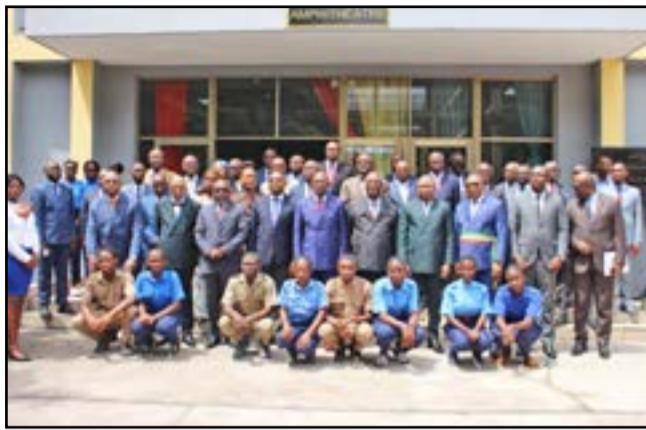
Les officiels et une poignée des lycéens de Brazzaville

«Dans un tel contexte, il est difficile de ne pas reconnaître la responsabilité des pouvoirs publics dans ce à quoi nous assistons aujourd'hui. En effet, le désastre que vivent nos enfants à l'école s'explique en partie par la mauvaise qualité du service public offert et la faible qualité des ressources tant humaines que matérielles», a déploré le ministre Jean Rosaire Ibara. La campagne qui a démarré à Brazzaville, à travers des descentes dans les lycées se poursuivra à Pointe-Noire, Oyo, Owando dans la Cuvette et à Ouessou dans la Sangha. Le choix des lycées s'explique par le fait que ces lycéens, sont en relation directe avec les autres niveaux d'enseignement et avec le marché du travail, ont confié les organisateurs de la campagne. Les autorités congolaises veulent épouser la vision du Président Nelson Mandela qui disait: «L'éducation est l'arme la plus puissante que vous puissiez utiliser pour changer le monde» Sur un ton ferme, le ministre