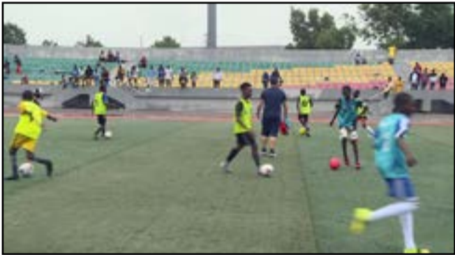
Une séance de détection des futurs pensionnaires

Les dénichéurs de jeunes footballeurs de l'Académie Alima cherchent le talent là où il se trouve. Un millier de jeunes ont été regroupés et sont en train d'être testés. Suivant les critères de recrutement définis, ils ne retiendront que les meilleurs éléments. «Il y a un très grand engouement. Il y a un potentiel énorme de talents. Nous sommes à la recherche de 40 pépites qui vont intégrer l'Académie. On a l'embar-