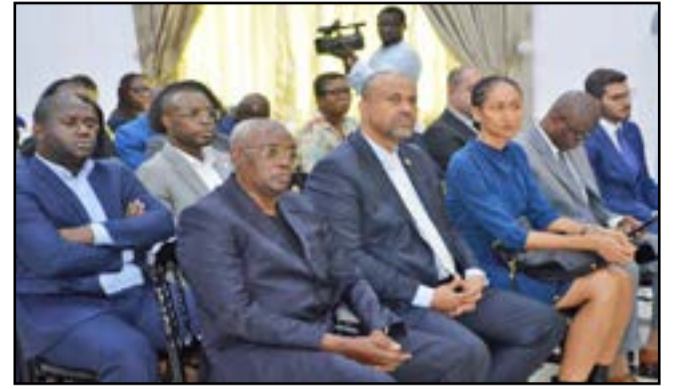
Au premier rang, les présidents de l'UNOC et de l'UNICONGO et Les chefs d'entreprises

«J'ai la ferme conviction que le bureau de liaison ACPE Paris