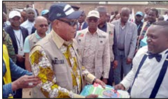
Le ministre Guy Georges Mbaka remettant le kit à un bénéficiaire à Bétou

qui seraient un peu déçues du partage », a-t-elle averti. La ministre, qui s'est exprimée en Lingala, a lancé un message d'unité autour du sinistre. « Nous sommes venus ici pour vous apporter l'assistance du Gouvernement. Les inondations ne concernent pas seulement Bétou ou le département de la Likouala, mais plutôt l'ensemble de l'étendue nationale », a-t-elle indiqué.