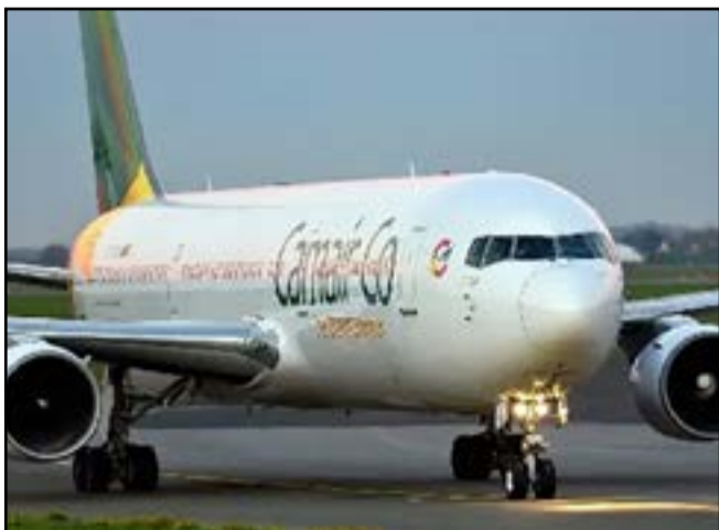
Les tarifs des vols bientôt en hausse dans la zone CEMAC

La création de la redevance de sécurité aérienne régionale a été approuvée par le Conseil des ministres de l'Union économique de l'Afrique centrale (UEAC) tenu le 22 février dernier à Bangui, en Centrafrique. C'est dès la saison prochaine, en juin 2024 que la mesure devrait entrer en vigueur dans les six Etats membres: Cameroun, Centrafrique, Congo, Gabon, Guinée équatoriale, Tchad.