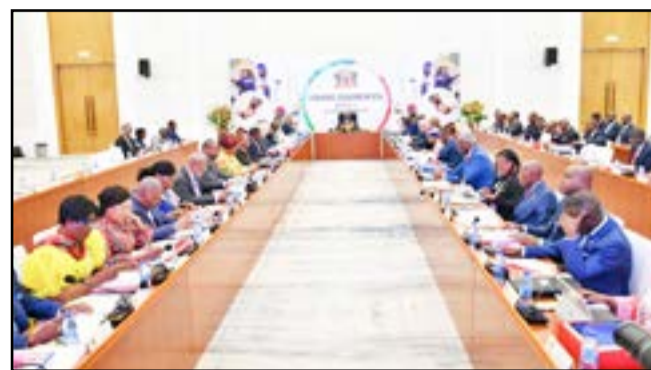
Les membres du Gouvernement

Le séminaire avait pour objectif d'arrêter les projets à engager, les mesures concrètes à prendre dès cette année ainsi que d'en préciser le financement et le chronogramme d'exécution. Les groupes de travail constitués portaient sur l'employabilité; l'entrepreneuriat; l'éducation et l'accompagnement des jeunes; l'accélération de la mise en œuvre des projets du programme d'investissement public; l'assainissement et résilience des villes et la mise en œuvre des actions d'urgence humanitaire. Concernant le sous-programme jeunes, les participants ont passé en revue les mesures susceptibles de créer 10.000 emplois publics, civils et militaires, et 90.000 emplois dans le secteur privé, ceci au moyen d'une politique axée notamment sur la «Congolisation» des emplois, en particulier dans les secteurs du commerce, de l'agriculture, de l'économie numérique, des zones économiques spéciales et la valorisation des emplois dissimulés, à l'instar des artisans, des techniciens de surface et des marchands servant de relais aux opérateurs de télécommunication ont été analysés. S'agissant de la mobilisation des revenus nécessaires au financement du PND, les échanges ont porté entre autres, sur la structure des recettes et l'analyse des soldes, les mesures de maximisation des recettes fiscal-douanières et des ressources naturelles. L'amélioration des seules recettes fiscal-douanières n'étant pas suffisante pour dégager des marges budgétaires