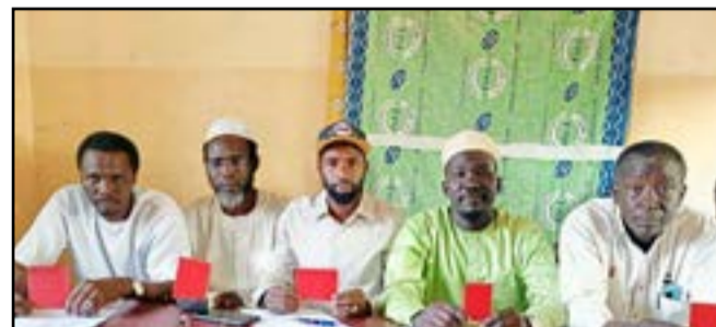
L'augmentation des prix du carburant passe mal au Tchad

Les principales plateformes syndicales veulent maintenir la pression sur les autorités suite à la hausse des prix du carburant décidée à la mi-février. Réunies à la Bourse du travail de Ndjamena le 26 février 2024, elles ont reconduit un mouvement de grève. «Le gouvernement nous a totalement ignorés», déplorent-elles.