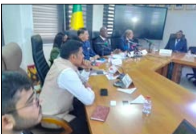
Les deux parties pendant la séance d'évaluation des projets (P.8)