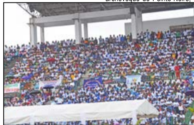
Une vue des participants à la messe sur les gradins du Complexe sportif