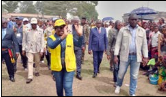
Pendant le bain de foule

quartiers et de villages: « Nous ne voulons pas qu'il y ait des remous et des bruits que nous entendrions des populations