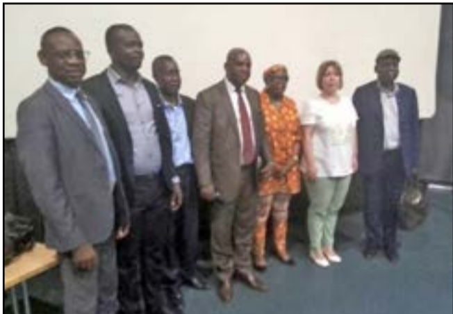
Les chercheurs, le modérateur et l'ambassadeure de France au Congo

L'ambassade de France au Congo a organisé, samedi 24 février 2024, à l'Institut français du Congo, à Brazzaville, une conférence-débat sur la guerre russo-ukrainienne, qui est entrée dans sa troisième année. La date du 24 février est celle du déclenchement de cette guerre, il y a deux ans déjà. Ce déchirement du monde ne peut pas seulement concerner le Congo en spectateur.