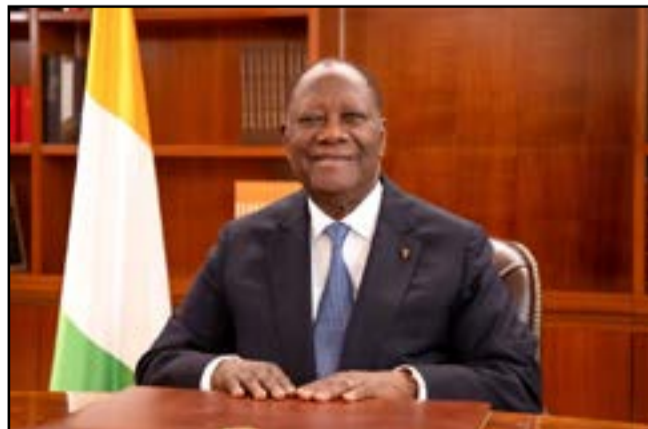
Le Président Alassane Ouattara pose un acte de grandeur