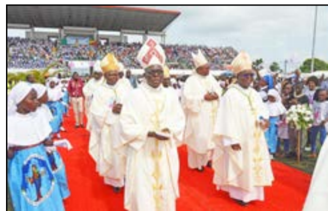
Les évêques concélébrants en procession d'entrée à la messe

De nombreuses délégations venues du Cabinda, d'Angola, de République Démocratique du Congo, (RDC), du Gabon, de France, d'Italie, de la Province ecclésiastique du Sud-Ouest (PESO) et de différents diocèses du pays dont celles venues de Brazzaville ont pris part à cette messe mémorable aux côtés des membres de la fervente Communauté diocésaine chrétienne. La pelouse et les gradins de ce