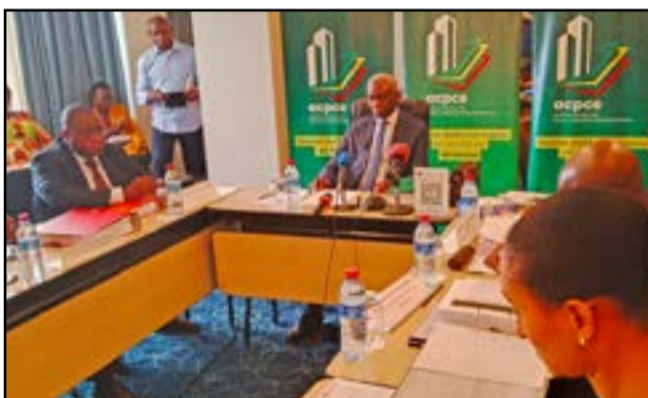
Le président Conseil d'administration et les membres du Comité de direction

Tout en reconnaissant quelques obstacles dans l'atteinte de cet objectif, il a néanmoins fait savoir que c'est ça le principe et le délai qui sont observables aujourd'hui. «Les difficultés n'ont pas manqué et ne manquent pas. Le Comité de direction les a recensées et a préconisé un certain nombre de mesures pour que l'objectif de 72 heures pour la création d'une entreprise soit atteint sur l'ensemble du territoire