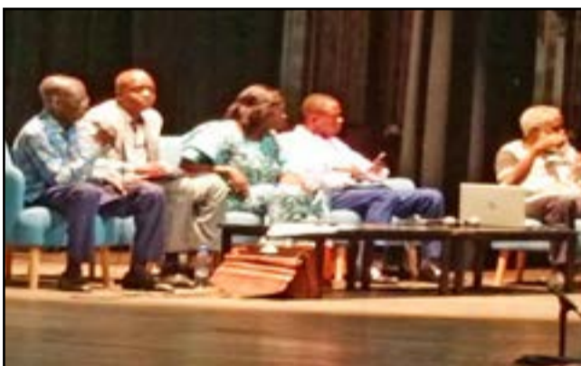
Une vue des conférenciers

La première impression qui se dégage est que les langues maternelles sont en voie de disparition dans les cités urbaines. Ce constat est visible lors des rencontres familiales et autres circonstances regroupant les ressortissants d'un même terroir. On assiste, malheureusement, à un rejet systématique des langues maternelles par certains, qui les qualifient de langues de peu d'importance. Conséquence: 40% des habitants de la planète n'ont pas accès à un enseignement dans une langue qu'ils parlent ou qu'ils comprennent. Néanmoins, on constate des progrès dans le