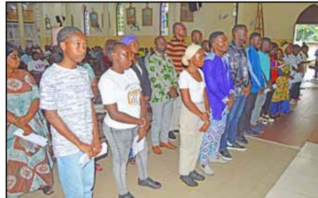
Les catéchumènes accompagnés de leurs parrains et marraines pendant l'exécution du rite de l'appel décisif

Intervenant en dernier lieu, Mgr l'archevêque a lui-même confirmé qu'il n'a pas de compte Facebook et a recommandé aux chrétiens de faire attention à tout ce qui peut être débité dans ces comptes pouvant le concerner. Cela n'est que l'œuvre des arnaqueurs qui peuvent tout se