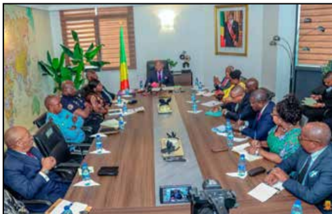
Pendant la réunion

jacentes», a-t-il informé. L'objectif de la réunion était de voir comment faire pour qu'il n'y ait plus de retour au niveau du domaine public et