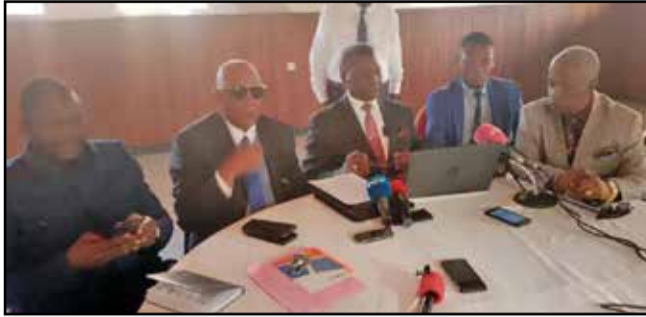
Quelques leaders de l'opposition

méthode, ils ont, une fois de plus, rappelé au ministre que la classe politique est composée par des partis politiques constitués conformément à la loi n°20-2017 du 12 mai 2017 portant loi organique relative aux conditions de création, d'existence et modalités de financement des partis politiques. «Que les groupements politiques n'existent que par la volonté des partis politiques conformément à l'article n°2 de la loi précitée qui dispose que les partis politiques peuvent se constituer en unions ou groupements politiques, en alliances ou en fusion de partis», expliquent ces partis politiques. Par conséquent, ils estiment