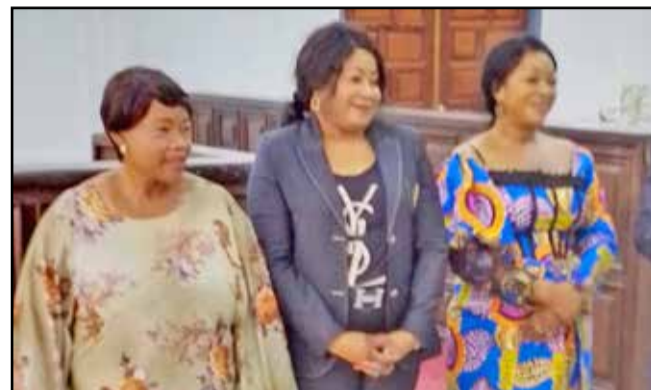
Les trois conseillères élues

Il s'est tenu lundi 4 mars 2024 à la mairie centrale une assemblée générale de désignation des femmes conseillères aux fins de pourvoir les trois sièges vacants au Conseil consultatif de la femme.