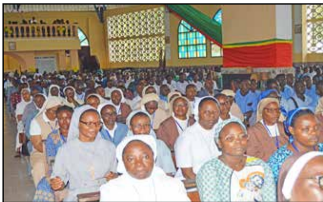
Les personnes consacrées participant à la messe.

La fin de la messe s'est faite distinguer par des allocutions