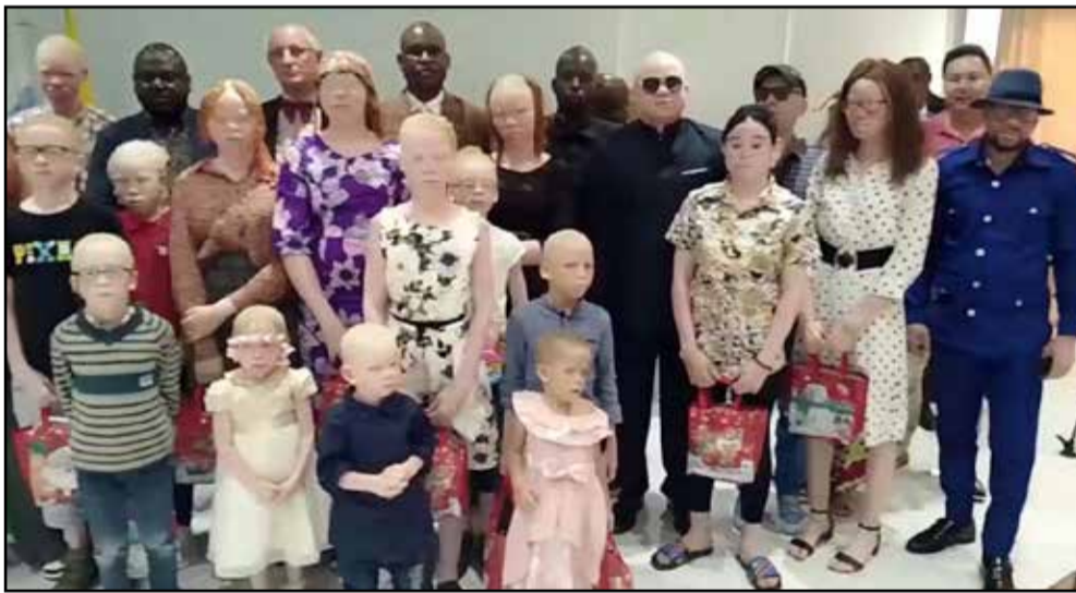
Les albinos posant avec les autorités après la réception des kits

Pour le donateur, le geste procède des relations mutuellement bénéfiques existant depuis l'implantation en 2021 du consulat de Saint-Marin à Pointe-Noire. Lesquelles relations se sont consolidées lors de l'accréditation en février dernier du tout premier ambassadeur de la République du Congo en République de Saint-Marin. «Depuis que le consulat honoraire a été ouvert en 2021 au niveau de Pointe-Noire, il y a de cela quatre ans, nous nous sommes engagés, en tant que consulat, à soutenir les actions humanitaires de l'Association Jhony-Chancel pour les albinos. Avec eux, nous allons continuer à contribuer à la réalisation de plusieurs missions médicales et je voudrais vous informer que le 9 février, pour la première fois, grâce à l'œil bienveillant de Son Excellen-