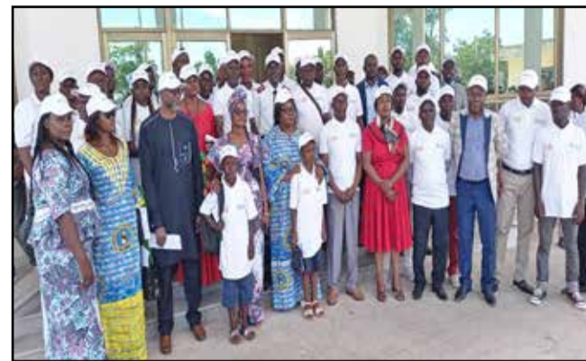
Les organisateurs et les participants à la cérémonie de clôture

sations des femmes qui sont en première ligne de ce combat, etc. L'ambassadeur de l'Union européenne a précisé qu'il faut aussi contribuer à stimuler les investissements dans les politiques et les programmes qui répondent aux besoins des femmes et des filles. C'est aussi le sens de la thématique retenue cette année par les Nations