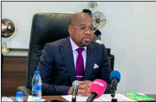
Le ministre Juste Désiré Mondelé

Le ministre délégué chargé de la décentralisation et du développement local, Juste Désiré Mondelé, a réuni le mercredi 13 mars dernier à son cabinet, le président du Conseil départemental et municipal, député maire de la ville de Brazzaville, la secrétaire générale de la commune de Brazzaville, le commandant territorial des forces de police de Brazzaville, le commandant de la Région de la gendarmerie de Brazzaville et les administrateurs-maires d'arrondissements.