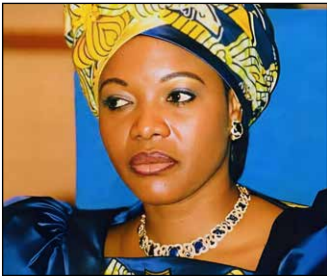
Mme Edith Lucie Bongo Ondimba reste vivante dans les cœurs

L'an 15 de la disparition de Mme Edith Lucie Bongo Ondimba (14 mars 2009 - 14 mars 2024) a drainé des foules et des personnages célèbres à Oyo, dans le département de la Cuvette. Venus de divers horizons, ils sont allés rendre hommage à la défunte Première Dame du Gabon décédée à Rabat au Maroc, qui repose au cimetière familial de Kona-Kona, à Edou. Comme chaque année, les festivités débutées le 10 mars par une messe solennelle se sont achevées par le dépôt d'une gerbe de fleurs par le président Denis Sassou-Nguesso le 14 mars 2024, sur la tombe de sa regrettée fille.