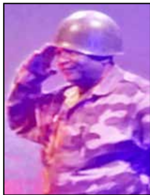
La légende Zao

A cet effet, il a rappelé qu'il est lauréat du Prix Découvertes RFI 1982, et a répondu présent à cette soirée pour encourager ses jeunes frères qui sont pleins de talent et qu'il faut encadrer pour aller de l'avant. Wayé, l'une des étoiles montantes de la musique congolaise, a salué la présence de