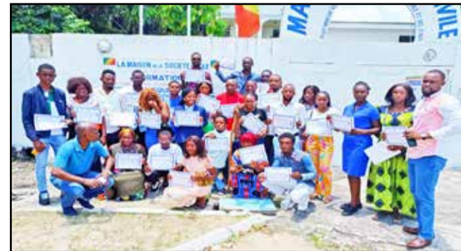
Les participants à la formation et les responsables de la J.O.C

Les efforts et la détermination de 60 membres de la Jeunesse ouvrière chrétienne du Congo (J.O.C-CG) qui ont consacré leur temps et leur énergie pour apprendre l'informatique et l'infographie ont été récompensés. Ils ont reçu leurs certificats de fin de formation, lors d'une cérémonie qui s'est déroulée, le 7 mars 2024 à la Maison de la Société civile à Brazzaville.