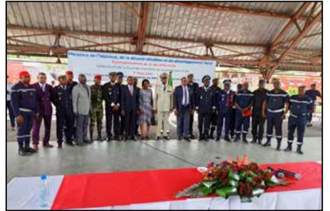
Les participants à l'issue de la cérémonie

C'est sur ce thème que l'humanité entière a commémoré le 1 er mars, la Journée mondiale de la protection civile. Avec comme objectif principal, de contribuer au développement par les Etats de systèmes propres à assurer la protection et l'assistance aux populations, ainsi qu'à sauvegarder les biens et l'environnement face aux catastrophes naturelles et dues à l'homme.