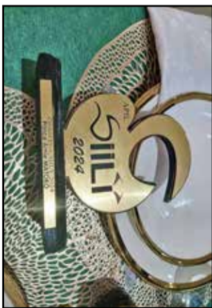
Le trophée obtenu

la vie littéraire, culturelle et artistique en Afrique et dans le monde. Au rang de ces différentes récompenses, le Grand Prix SIILY occupe la première place. C'est dans ce contexte que l'écrivain Prince