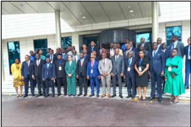
Les responsables et les cadres des Trésors publics des pays de la CEMAC

Le Cadre permanent de concertation (CPC) des Trésors publics de la Communauté économique et monétaire de l'Afrique centrale (CEMAC) a tenu sa neuvième session, du 4 au 8 mars dernier, à Brazzaville, sous le thème «Techniques d'émission et amélioration du taux de participation des spécialistes en valeurs du trésor (SVT) sur le marché des valeurs du trésor de la CEMAC». Les pays de la CEMAC souhaitent devenir des pays émergents. L'objectif visé est de renforcer le rôle pivot du marché des valeurs du trésor de la CEMAC dans la mobilisation et l'allocation des ressources.