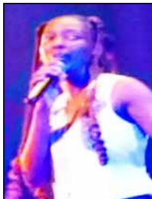
La rappeuse Jessy B

la légende Zao qui est l'une de ces idoles et qui l'a beaucoup inspiré dans sa carrière. Il a, cependant, exhorté les