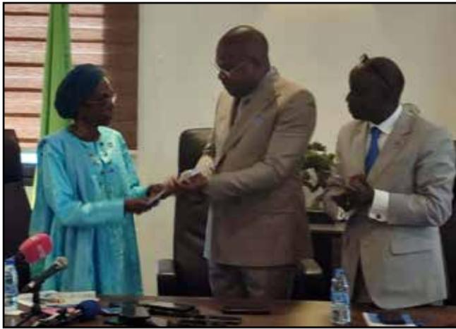
La remise officielle du programme accéléré du développement communautaire

la pauvreté à l'intérieur du pays; d'en avoir fait un document très structuré et de pouvoir vous le remettre aujourd'hui, afin d'envisager sa mise en œuvre», a-t-elle dit. Et d'ajouter: «Avec ce programme, nous ambitionnons de tirer de la pauvreté près de 2 millions des Congolais. Voyons cela comme un accélérateur de développement, de la réalisation des objectifs de développement parce que le développement se joue et se réalise à la base, dans les districts et dans les quartiers à proximité de la population». Le programme de développement communautaire est une approche que le PNUD, dans son mandat de lutte contre la pauvreté