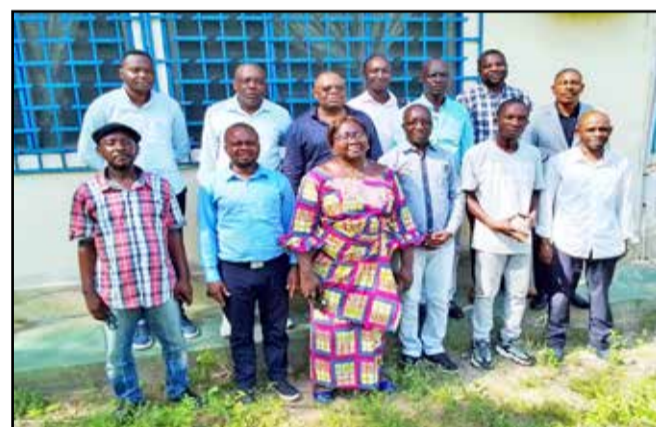
Les organisateurs et les participants à la clôture de l'atelier