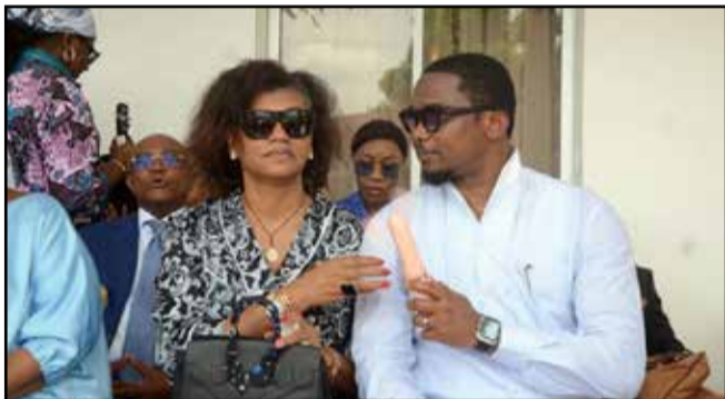
Samuel Eto'o et son épouse ont rendu hommage à l'illustre disparue.

Plusieurs activités ont marqué le 15 ème anniversaire du rappel à Dieu d'Edith Lucie Bongo Ondimba à Oyo. Entre autres: la messe en sa mémoire le 10 mars, un colloque international sur l'œuvre de l'illustre disparue le 13 mars, le traditionnel dépôt d'une gerbe de fleurs le 14 mars sur sa tombe par le président Denis Sassou-Nguesso. C'était en présence des autorités ecclésiastiques, des autorités politico-administratives, dont les présidents du Sénat et de l'Assemblée nationale, le Premier ministre chef du gouvernement et des membres de son équipe ainsi que des proches des familles Nguesso et Bongo qui ont tenu à rendre hommage à la défunte Première Dame du Gabon.