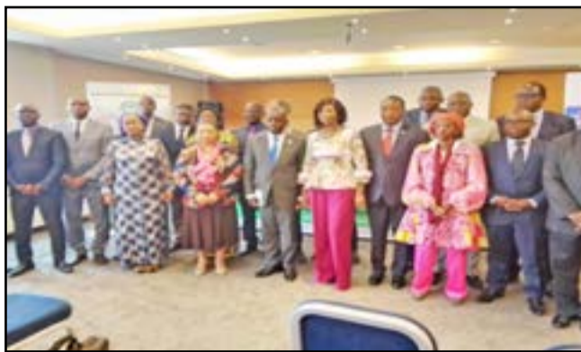
La ministre Soudan Nonault, au milieu, posant avec les partenaires au développement

L'initiative de l'évaluation des nouveaux sites ou la réévaluation des anciens sites KBA, a dit la ministre Soudan Nonault, contribue à atteindre l'objectif 3 du cadre mondial de la biodiversité qui consiste à faire en sorte que, d'ici à 2030 des zones terrestres et des eaux intérieures,