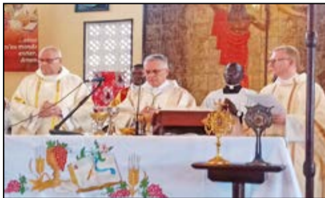
Le président de la célébration (au milieu)