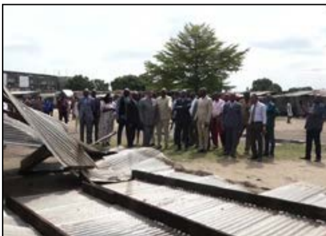
La délégation ministérielle devant la toiture du Lycée 30 mars emportée par la pluie

C'était lundi 18 mars en compagnie des deux administrateurs-maires des arrondissements concernés et du personnel de ces établissements. Depuis un certain temps, la tombée de la pluie est devenue synonyme de dégâts matériels dans la plupart des départements du Congo. Les structures publiques ne sont pas épargnées. Parmi