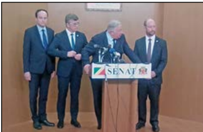
Gérard Larcher (au milieu) en compagnie de trois sénateurs