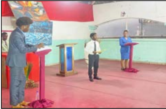
Les acteurs sur scène

théâtre et à le «comprendre». Selon lui, c'est un moyen de communication qu'il faut absolument développer. Le 27 mars est la Journée mondiale du théâtre. La journée a été instituée par l'Institut international du théâtre en 1961 pour mettre en avant l'importance du théâtre dans