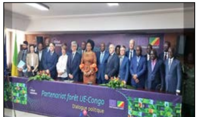
Les deux parties à l'ouverture de la table ronde

de transformation de bois. Dans la préparation d'une prochaine conférence internationale du 2 au 5 juillet, sur l'initiative de la décennie africaine et mondiale de l'afforestation et du reboisement, ce point a pris une résonance particulière. La ministre a souligné les efforts entrepris à cet égard afin de renforcer la coordination interministérielle sur l'utilisation des terres. En ce qui concerne les défis liés à des superpositions de permis d'utilisation des terres au niveau des concessions forestières et des aires protégées, l'importance de l'appui institutionnel qui est fourni dans le cadre de l'initiative pour les forêts d'Afrique centrale (CAFI) a été souligné. Cette initiative vise à accompagner les autorités congolaises dans le but d'éviter ce type de superpositions. Quant aux questions relatives à la gestion durable de la biodiversité et au développement communautaire, il s'agit de créer sur des approches qui promeuvent et respectent pleinement les