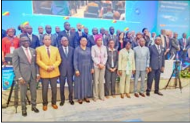
Les ministres, l'équipe de la banque mondiale et les invités à l'ouverture

Le Groupe de la Banque mondiale et le Gouvernement congolais ont procédé, du 19 au 20 mars 2024 à Brazzaville, à la revue de la performance du portefeuille pays édition 2024. La cérémonie a été coprésidée par Mme Ingrid Olga Ghislaine Ebouka-Babackas, ministre du Plan, de la statistique et de l'intégration régionale, Gouverneure nationale de la Banque mondiale et Mme Louise Pierrette Mvono, représentante résidente de la Banque mondiale au Congo. L'objectif visé est d'évaluer chaque année les résultats obtenus par des projets sous financement de la Banque mondiale.