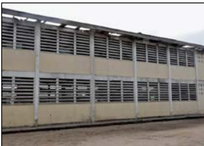
Le bâtiment du Lycée 30 mars ayant perdu sa toiture.