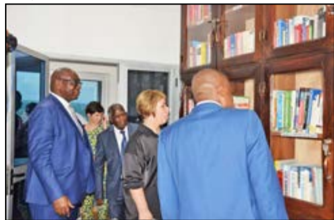
Pendant la visite

l'excellence. Cette école, qui existe avant même que beaucoup d'entre nous ne soient nés, promeut le professionnalisme, la qualité et l'ouverture qui sont les valeurs qui unissent notre communauté. Excellence Mme l'ambassadrice, nous sommes fiers de