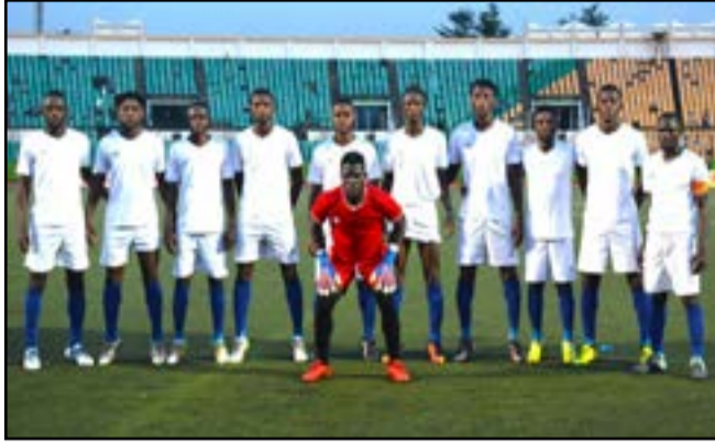
L'AS BNG a freiné l'AC Léopards à Dolisie

Le championnat national de Ligue 1 se poursuit. On en disputait, le week-end dernier, la dix-septième journée. Une journée qui n'a apporté aucun bouleversement en tête du classement. On a toutefois enregistré un demi-coup d'éclat. Il s'agit du match nul (2-2) que l'AS BNG, dixième du classement provisoire, est allé imposer à l'AC Léopards au Stade Paul Moukila "Sayal" à Dolisie. Les Brazzavillois étaient même à deux doigts de l'emporter, mais en face il y avait un buteur patenté, Bersyl Obassi qui a égalisé en fin de partie, s'offrant du coup un énième doublé au cours de cette saison. Toutefois, bien que freinés dans leur stade fétiche, les Fauves du Niari gardent leur place de leader. Parce que l'AS Othoh n'a pas non plus fait mieux qu'un match nul (0-0) face aux Diables-Noirs, samedi 30 mars en nocturne au Stade Président Alphonse Massamba-Débat. Il n'y a pas eu le moindre ballon dans les filets au cours de la confrontation entre le champion en titre et le vice-champion de la saison dernière. Les joueurs ont réussi à se neutraliser au cours de cette partie dont le