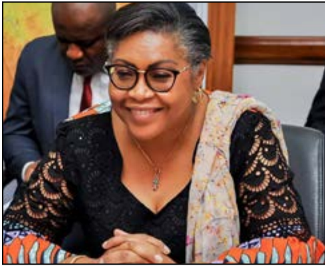
Judith Tuluka est la nouvelle cheffe de l'exécutif en RD Congo

Agée de 56 ans, la nouvelle Cheffe du gouvernement est titulaire d'une maîtrise en économie appliquée de l'Université libre de Bruxelles, ainsi que d'un diplôme d'études complémentaires en travail dans les pays en voie de développement. Elle a bâti son parcours professionnel sur une base solide de connaissances et d'expertise. La nouvelle patronne de l'exécutif en RD Congo a accumulé une expérience précieuse dans divers