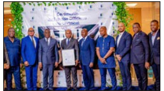
Les responsables fiers du certificat

HURST, cabinet d'avocat de réputation internationale sur les problématiques de sanction de gouvernance, d'éthique et de conformité ».