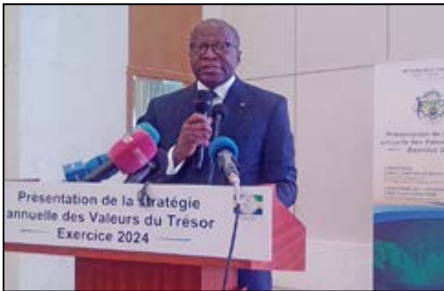
Le ministre Charles M'ba

en 2021, l'activité économique mondiale a été marquée en 2022 par le conflit russo-ukrainien et ses conséquences sur le commerce international, entraînant un ralentissement de la croissance globale. En 2024, les priorités du Gouvernement de transition seront axées sur l'amélioration des conditions de vie des populations et de développement économique dans un contexte de consolidation budgétaire. Ainsi, sur le volet des finances publiques, il s'agira de poursuivre les efforts de maîtrise des dépenses publiques de subventions aux opérateurs et entreprises publiques, la réduction de la charge d'intérêts et du niveau de remboursement du principal pour endiguer le risque «d'effet boule de neige» et rassurer les marchés sur la capacité du Gabon à honorer ses engagements pour refinancer la dette à des taux soutenables. Conformément à la stratégie d'endettement et au projet de loi de finances 2024, l'Etat gabonais a prévu