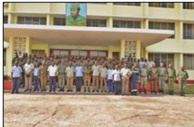
Les officiers participants au séminaire