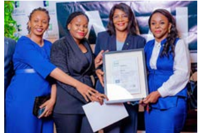
Le personnel féminin satisfait du certificat

tions économiques, de corruption, de blanchiment des capitaux et de financement du terrorisme, pour mener à bien sa préparation à la certification AML 30000. «Par cette certification, BGFIBank Congo démontre son attachement aux impératifs