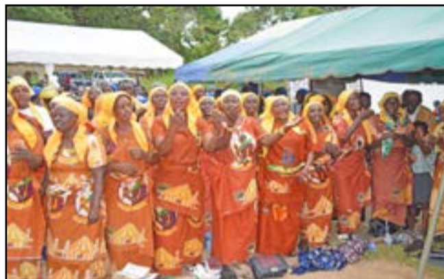
Une vue des membres de la Schola populaire paroissiale animant la messe