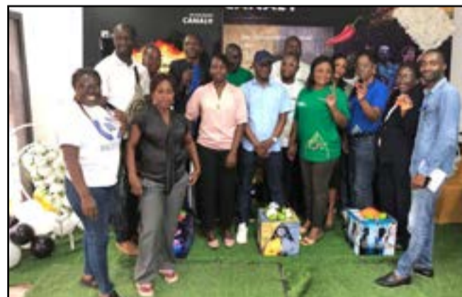
Photo de famille avec les journalistes

tre d'améliorer la vie virtuelle de ses abonnés et de permettre à tous de profiter de ces programmes. Il a mis une offre sur le réabonnement qui permet à tout abonné qui se réabonne à sa formule actuelle de pouvoir bénéficier de 15 jours sur “Tout canal”. Mais cela à la période de 26 mars