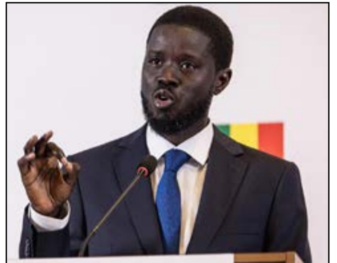
Bassirou Diomaye Faye a prêté serment

Cinquième président de l'histoire du Sénégal, Bassirou Diomaye Faye a prêté serment mardi 2 avril 2024 à Diamniadio, près de Dakar. Il succède à Macky Sall, chef de l'Etat de 2012 à 2024. Alors qu'il y a quelques jours, il était encore un candidat de l'opposition en prison et candidat de substitution d'Ousmane Sonko, leader des Patriotes africains du Sénégal pour le travail, l'éthique et la fraternité (PASTEF).