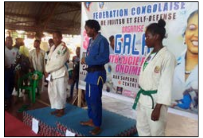
Le podium féminin