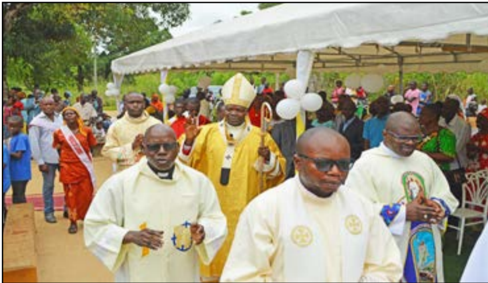
L'archevêque conduisant la procession

l'occasion de cette messe qui a réuni les membres de cette petite, fervente et dynamique communauté paroissiale renforcée à cette occasion par les chrétiens d'autres paroisses de l'archidiocèse dont les originaires du coin vivant à Brazzaville qui ont apporté une contribution remarquable à la fête. L'animation liturgique a été assurée par la schola populaire de la quasi-paroisse à l'honneur et la chorale du coin devenue en cette heureuse et particulière circonstance: «Chorale Saint Gérard». Au début, le curé a prononcé le mot de bienvenue à l'archevêque et à toute la délégation qui l'accompagnait