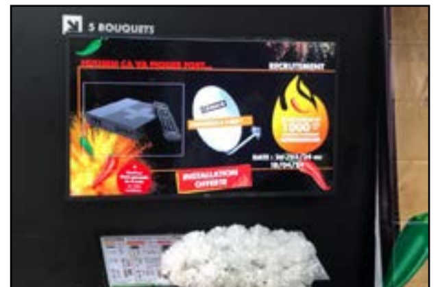
La promotion s'étend du 26 mars au 18 avril 2024.

Et pour les fans de séries, ils verront pimenter leurs journées avec une nouvelle création originale “EWUSU” sur Canal+ Première et “L'Amour invincible” sur NOVELAS TV. A noter que pour les enfants, NATHAN TV propose des émissions et des séries d'animation autour des sciences, de la découverte, de l'ouverture sur le monde et des loisirs