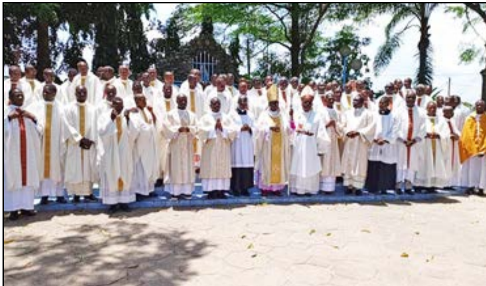
L'archevêque de Pointe-Noire avec les membres du clergé