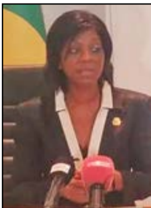
Arlette Soudan Nonault lisant la déclaration

«L'Agence nationale de l'environnement a également prévue la loi qui verra bientôt le jour avec pour objectif d'aider les territoires et les citoyens à mieux appréhender et maîtriser les efforts concrets du changement climatique, ainsi que les risques des catastrophes naturelles, chimiques et industrielles», a poursuivi la ministre de l'Environnement. Rappelons que la Journée africaine de l'environnement a été instituée par l'Union africaine. Elle a été adoptée il y a dix ans dans l'agenda 2060 afin de se reposer sur la capacité des