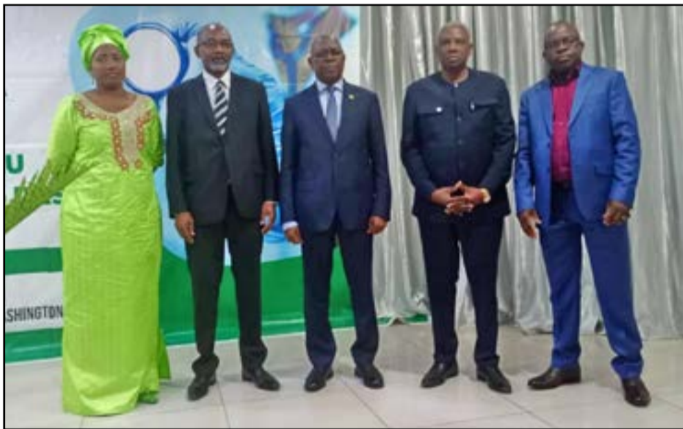
Le nouveau bureau a été installé