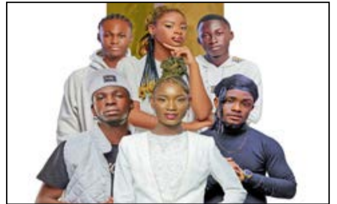
Le Collectif ATJ Music