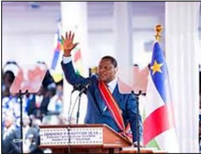
Le président Touadéra a prêté serment sur la bible

Déclaré vainqueur de l'élection présidentielle du 28 décembre 2025 avec 77,90% des suffrages, le chef de l'Etat centrafricain a succédé à lui-même. Lundi 30 mars 2026, il a prêté serment sur la bible, inaugurant l'entrée de son pays dans la VIIe République. Avant de prononcer un discours dans lequel il a présenté son programme pour les sept années à venir. Organisée au stade Barthélemy Boganda de Bangui devant près de 20 000 personnes, la cérémonie s'est déroulée en présence de nombreux dirigeants du continent.