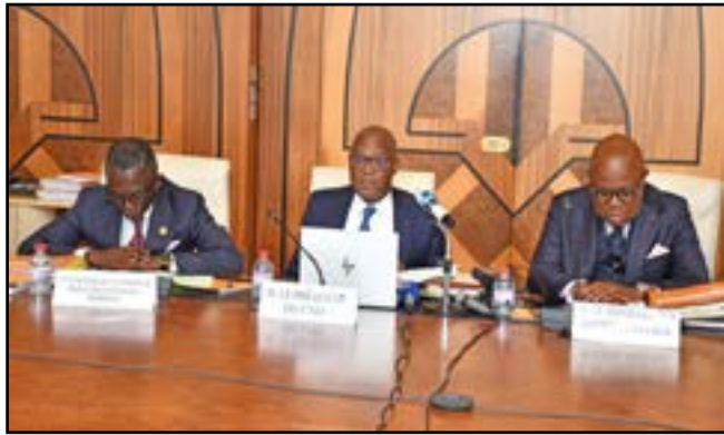
Le ministre Yoka entouré des ministres Ngatsé et Itoua pendant le CNEF

Placée sous la présidence de Christian Yoka, ministre des Finances, du budget et du portefeuille public, la première session ordinaire du Comité national économique et financier du Congo (CNEF) de l'année s'est tenue le 27 mars 2026, au siège national de la Banque des Etats de l'Afrique centrale (BEAC) à Brazzaville. La situation économique, monétaire et financière nationale, ainsi que les perspectives de l'année en cours, ont constitué les dossiers débattus pendant cette session.