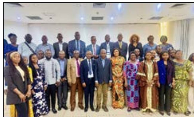
Photo d'ensemble des participants à l'atelier d'élaboration du PSN Paludisme 2026-2030

cours de la semaine du 30 mars au 3 avril, à travers la tenue d'un atelier technique restreint consacré à la consolidation du