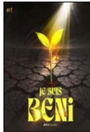
La pochette du single