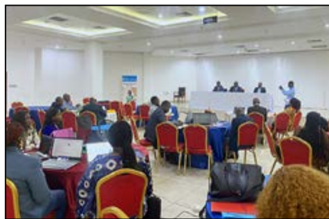
Vue d'ensemble sur l'atelier d'élaboration du Plan Stratégique National Paludisme 2026-2030

de Brazzaville, la Direction de l'hygiène et de la promotion de la santé, la Direction des pharmacies et des médicaments, le Comité de Coordination Nationale des projets financés par le Fonds mondial (CCN), les institutions de recherche impliquées dans la lutte contre le paludisme telles que le Fondation congolaise pour la recherche médicale (FCRM) et l'Institut de recherche en science de la santé (IRSSA), les structures hospitalières dont le CHU de Brazzaville et l'Hôpital central des armées Pierre Mobengo, la société civile, les consultants nationaux et internationaux ainsi que CRS et ses sous-récepteurs (Médecin d'Afrique, CARITAS Congo, Club Jeunesse Infrastructure et Développement). La finalisation de ce document stratégique s'est poursuivie au