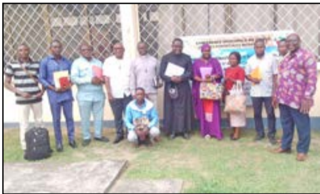
Les participants à la session

détresse à travers le monde, par l'octroi des subsides. Le Pape Léon XIV, pour la journée mondiale des missions 2026, qui marque le centenaire de