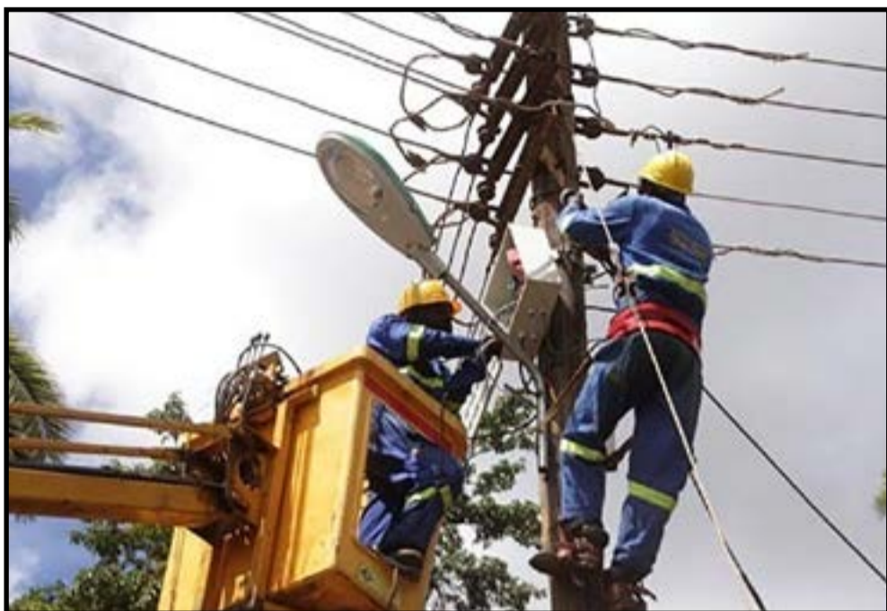
À Brazzaville, les coupures d'électricité récurrentes sont devenues source d'exaspération pour les habitants. (P.3)