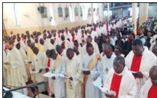
Le clergé renouvelant son engagement sacerdotal

chœur des deux grands séminaires et des amis du grégorien. Dans son homélie, l'archevêque de Brazzaville a déclaré que nous sommes rassemblés pour la bénédiction des huiles saintes qui serviront pour les différents sacrements. Le sacerdoce n'est pas un métier, mais une passion au Christ qui nous a choisis. «Vivez dans la simplicité et travaillé ensemble, prêtre et laïc pour former un seul corps. Le laïc n'est pas un simple exécutant, mais un collaborateur du prêtre. Priez pour vos prêtres et pour votre archevêque». Les trois catégories d'huiles: