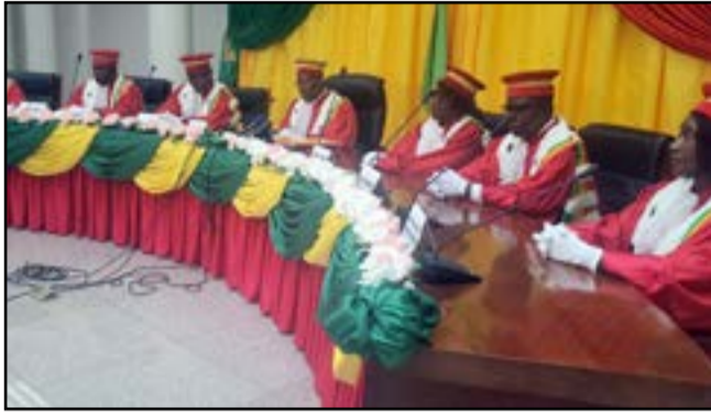
Les membres de la Cour constitutionnelle

La Cour constitutionnelle a publié samedi 28 mars 2026 les résultats définitifs de l'élection présidentielle, scrutin des 12 et 15 mars 2026. Devant la presse nationale, le président de la Cour constitutionnelle, Auguste Iloki, entouré des membres de cette institution, a lu la décision relative à la proclamation des résultats qui consacrent l'élection, dès le premier tour, du Président Denis Sassou-Nguesso, avec 94,90% des voix.