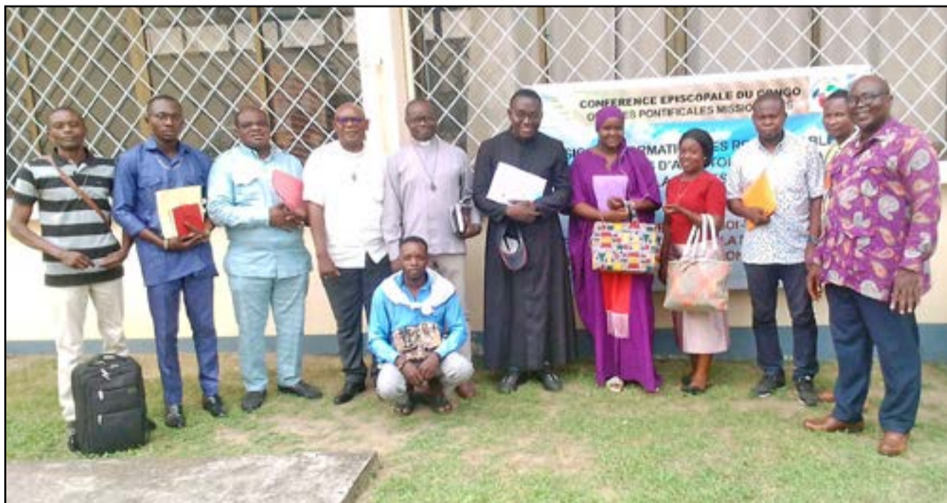
Les participants à la session (P.11)