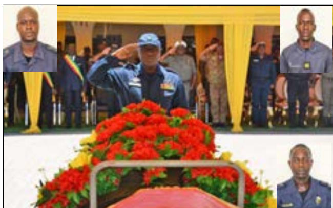
Le général Gervais Akouangué lors du recueillement (en médaillon les trois gendarmes morts)

Les trois gendarmes, morts en mission le 18 mars 2026 dans un accident de la circulation sur la route nationale 1, à la hauteur du village Ngandou Boudjoua dans le département du Pool, alors qu'ils assuraient la sécurisation d'un convoi de matières dangereuses, ont reçu un ultime hommage de la Force publique le 27 mars dernier à la Région de Gendarmerie de Brazzaville.