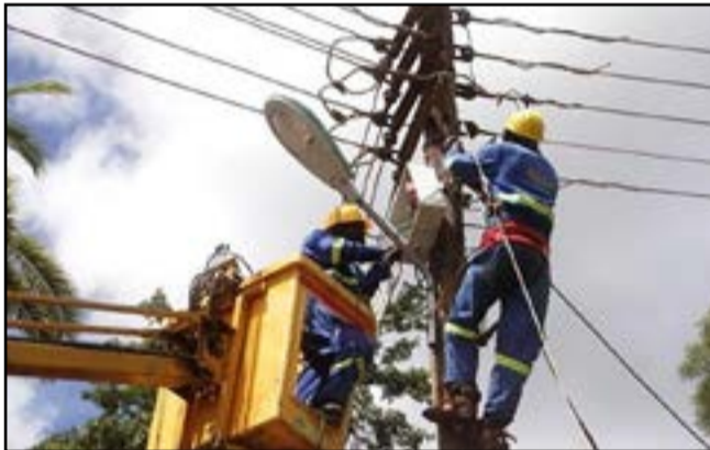
Les dépannages à répétition

À Brazzaville, les coupures d'électricité récurrentes sont devenues source d'exaspération pour les habitants. Des quartiers entiers sont plongés dans le noir, entraînant des conséquences lourdes: les provisions se gâtent, l'activité économique ralentit et la vie quotidienne se complique considérablement.