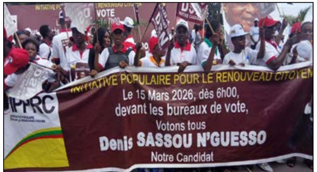
A Brazzaville, la mobilisation était totale

Cet engagement s'est poursuivi avec une intensité particulière lors de l'élection présidentielle de 2016. L'IPPRC a alors déployé une stratégie de proximité fondée sur la mobilisation de terrain, notamment à travers des opérations de porte-à-porte, des campagnes