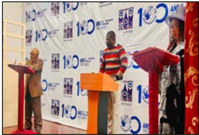
Des pièces qui auront dressé un portrait porteur d'espoir des sociétés africaines