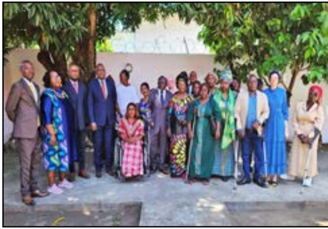
Les membres du Conseil consultatif et les séminaristes

A l'occasion de la célébration en différé de la Journée internationale de la femme, commémorée chaque 8 mars, le Conseil consultatif des personnes vivant avec handicap a organisé vendredi 27 mars 2026 à Brazzaville un séminaire qui a réuni acteurs institutionnels, experts en genre et femmes vivant avec handicap. Cette rencontre a constitué un cadre d'échanges et de sensibilisation autour des droits, de la protection sociale et de l'inclusion de cette catégorie souvent marginalisée.