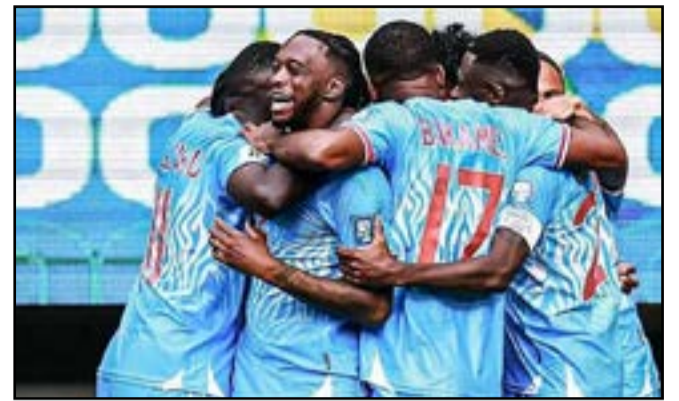
La joie des Léopards de la RDC

Le Cap-Vert s'apprête à disputer la première Coupe du monde de son histoire, une qualification historique pour cet archipel. De son côté, la RDC signe un retour marquant sur la scène mondiale. Les Léopards retrouvent la compétition pour la deuxième fois, plus de cinquante ans après leur unique participation en 1974. L'Afrique du Sud aussi, 16 ans après l'édition qu'elle avait organi-