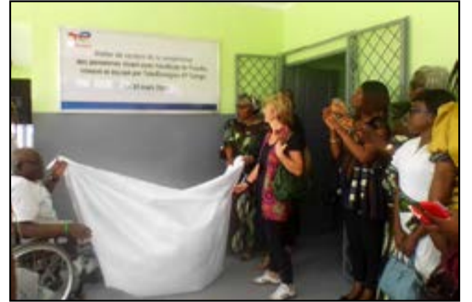
Les femmes de TEPC dévoilent la plaque avec le président départemental de l'UNHACO

Cerise sur le gâteau, à l'issue de la cérémonie, la délégation