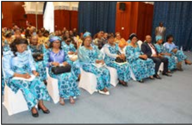
Les femmes du parlement

gements clairs, des priorités budgétaires concrètes, des mécanismes de suivi transparents et une gouvernance véritablement inclusive», a-t-elle expliqué, appelant à un changement de paradigme. Selon elle, les femmes ne sauraient plus être cantonnées au rôle de bénéficiaires passives, mais doivent devenir des actrices centrales de la décision publique. Au fil des interventions, un constat s'est imposé avec une franchise rare: celui d'un engagement politique encore timide des femmes congolaises. Entre autocensure, déficit de formation et pesanteurs socioculturelles,