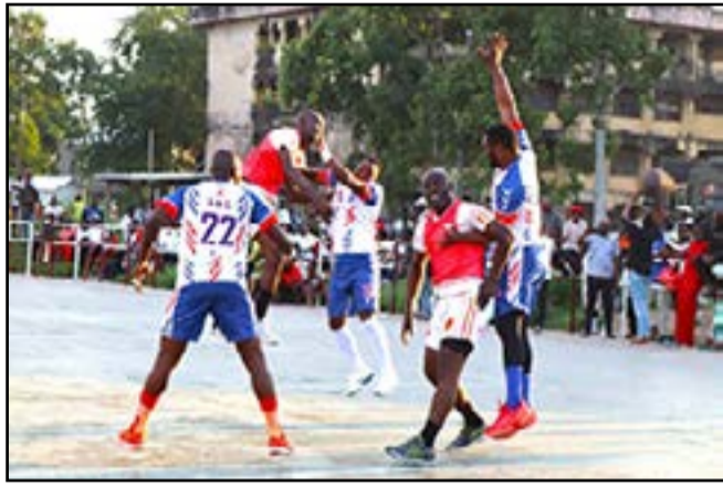
Séquence du match BCM - Inter Club

Sur le terrain, les équipes se sont livrées à de véritables batailles chez les hommes, tout comme chez les dames. Le niveau technique affiché a témoigné de l'existence