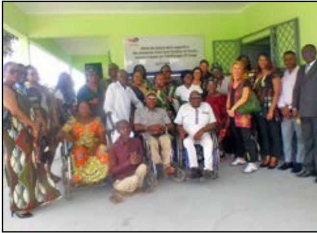
Les femmes de TEPC posant avec la délégation de la coopérative