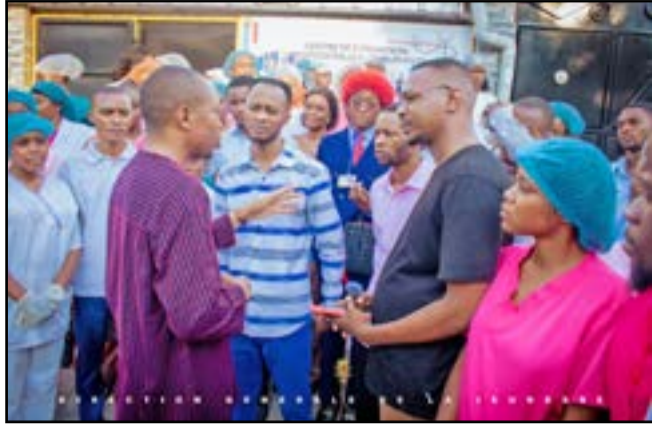
Le directeur général de la jeunesse à la rencontre des jeunes

Dans le cadre d'une initiative portée par le ministère en charge de la Jeunesse, le programme «La DGJ Chez Vous» rompt avec la logique administrative classique en allant directement à la rencontre des jeunes, dans les rues, les foyers et les espaces communautaires. Ce n'est plus aux jeunes de franchir les portes des administrations: l'administration vient désormais à eux.