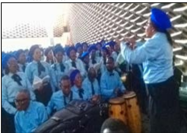
La chorale Tanga ni Tanga animant la messe