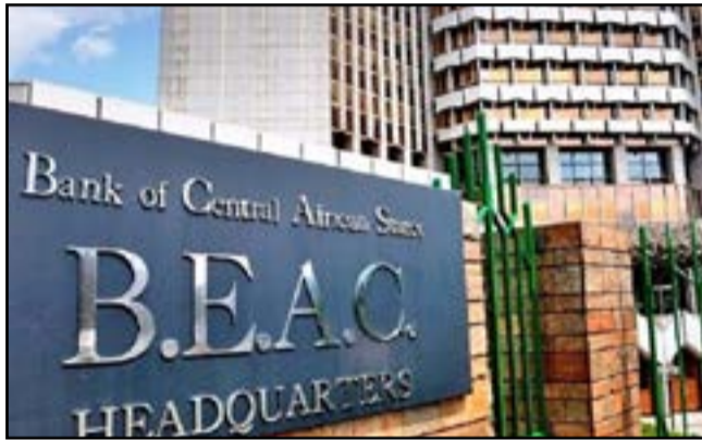
Le siège de la Banque centrale de la CEMAC

Au niveau international, le comité de politique monétaire a pris connaissance des perspectives de l'économie mondiale. Selon la mise à jour des prévisions du Fonds monétaire international (FMI) de janvier 2026, la croissance mondiale est prévue à 3,3 % en 2026, comme en 2025. Les membres ont reconnu toutefois que ces perspectives sont désormais soumises à de fortes incertitudes en lien avec le conflit au Moyen-Orient. La sous-région Afrique centrale pourrait connaître des pressions inflationnistes contenues sous la norme communautaire, avec un taux en moyenne annuelle qui se situera à 2,3 en 2026, après 2,1 % en 2025. La zone enregistre un repli du déficit budgétaire base des engagements, hors don, de 4,8 % en 2025 à 2,2 % du PIB un an