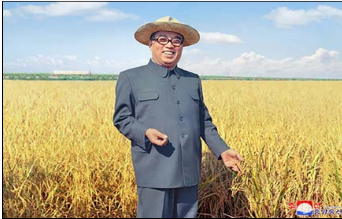
Son Excellence Monsieur Kim Il Sung , Président Eternel de la République Populaire Démocratique de Corée