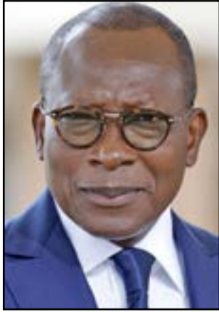
Patrice Talon ne s'accroche pas