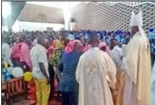
Mgr l'archevêque recevant les dons des mouvements d'apostolat