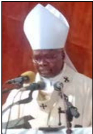
Mgr Bienvenu Manamika Bafouakouahou

Le dimanche 5 avril 2026, dimanche de Pâques, Mgr Bienvenu Manamika Bafouakouahou, archevêque métropolitain de Brazzaville, a célébré la fête de Pâques dans une église archicomble de Saint Pierre Claver de Bacongo au cours de la messe de 11 heures placée sous l'animation liturgique de la chorale Tanga ni Tanga.