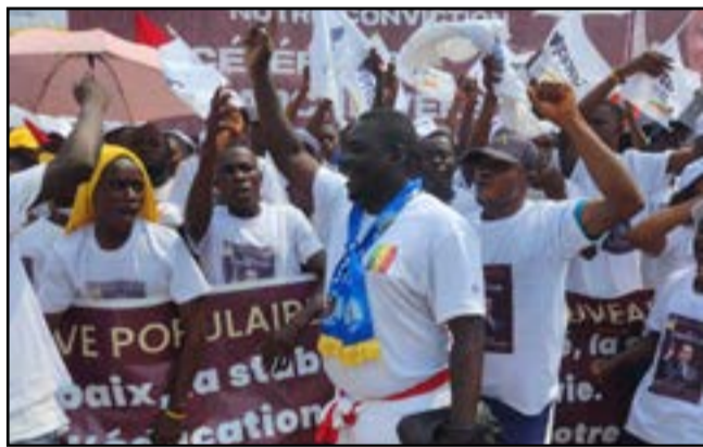
A Owando, la liesse était au rendez-vous

axes majeurs: la stabilité politique, la paix sociale et la poursuite du développement économique. Selon ses responsables, le président Denis Sassou-Nguesso incarnait l'expérience et la capacité à maintenir l'équilibre institutionnel dans un contexte régional parfois instable. L'association a également mis en avant les réalisations du pouvoir en place, notamment en matière d'infrastructures, de formation des jeunes et de renforcement du rôle de l'État dans l'économie. Elle a ainsi contribué à valoriser le bilan du candidat tout en projetant une vision d'avenir axée sur la continuité des politiques publiques.