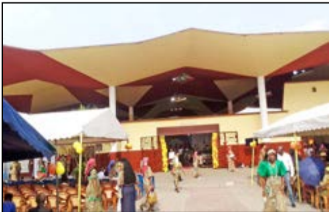
L'église Saint-Esprit de Mougali