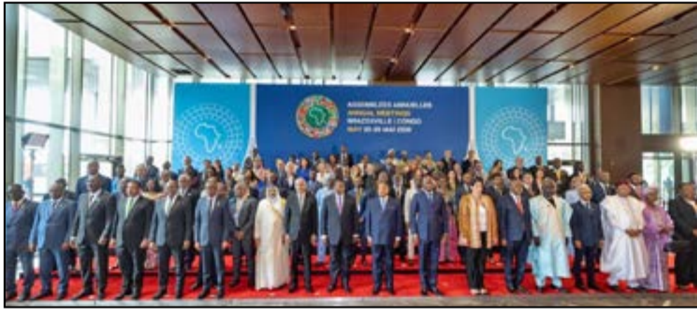
Les Chefs d'Etat, les responsables de la Commission de l'Union africaine et de la BAD

dacieuses et adaptées. La Banque doit demeurer fidèles à sa vocation première: être la Banque de l'Afrique, au service de l'Afrique, portée par la confiance de ses Etats membres et ouverte aux partenariats utiles au développement du continent». Le président Denis Sassou-Nguesso, Grand maître des ordres nationaux, a décerné à titre exceptionnel