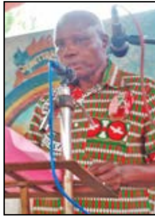
Le vice-président du conseil pastoral à Pierre.

paroisse compte une trentaine de mouvements d'apostolat et deux chorales (Langue de Feu et La Colombe). De la paroisse Saint-Esprit de Mougali sont nées les paroisses Jésus Ressuscité et de la Divine Miséricorde du Plateau des 15 ans;