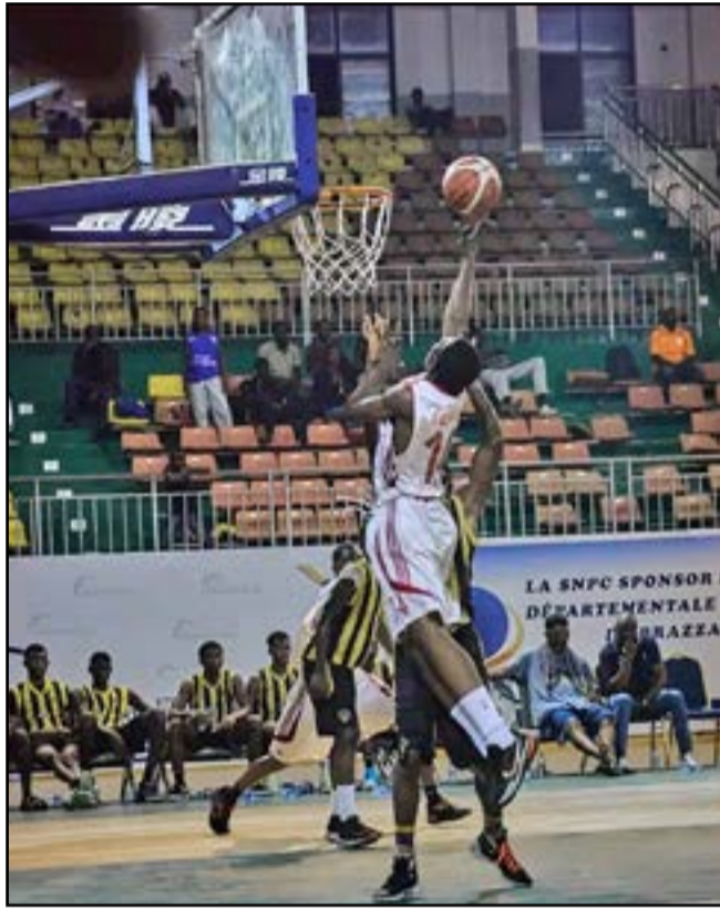
Le dernier match test des Diables-Rouges U-18

Le groupe, constitué exclusivement de basketteurs nationaux en provenance des clubs de Brazzaville et de Pointe-Noire, a l'occasion de montrer son savoir-faire sur la scène continentale.