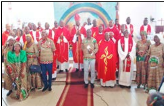
Les prêtres concélébrants et le conseil pastoral posant avec l'archevêque