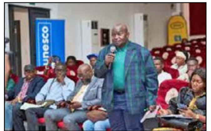
Une vue des professionnels de l'information pendant les échanges

les intervenants ont souligné qu'elle ne doit jamais remplacer la vérification des faits, l'esprit critique et l'éthique professionnelle. À travers cette initiative, MTN-Congo et l'UNESCO entendent