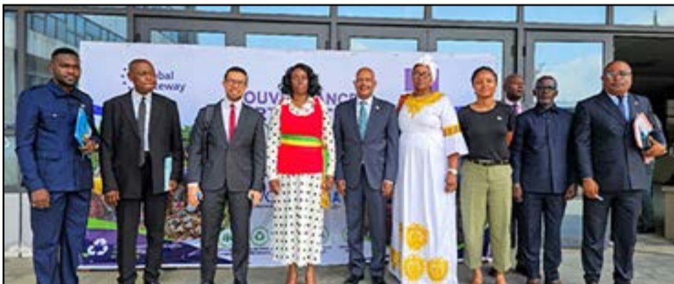
Photo de groupe des officiels présents à la cérémonie, sous le leadership de Madame la Présidente du Conseil municipal, Députée-Maire de Kintélé (au centre, en rouge), entourée à sa gauche du représentant de l'Ambassadeur de l'Union européenne, et à sa droite du Représentant de CRS, suivie de la Représentante de EAA en robe blanche.

logements. Cette descente de terrain a permis aux différentes parties prenantes de mesurer concrètement les enjeux environnementaux et sanitaires auxquels les populations sont confrontées au quotidien. Face à ces constats, le projet GDU2K mise sur une approche articulée autour de trois axes complémentaires : la participation citoyenne, le renforcement de la gouvernance locale et le développement de solutions liées à l'économie verte. L'ambition étant de dépasser la seule logique de nettoyage pour installer durablement de nouvelles pratiques communautaires autour de la gestion des déchets. Parmi les résultats attendus du projet figurent la mise en place de brigades citoyennes