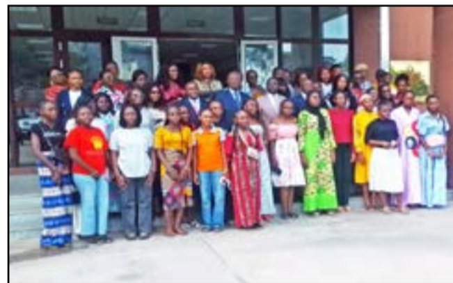
Les organisateurs et les participantes

La direction générale du contrôle des marchés publics, relevant du ministère de l'Economie, du plan, de la statistique et de la prospective, avec l'appui financier du Programme «Accélérer la gouvernance institutionnelle et les réformes pour un fonctionnement durable des services (PAGIR), a organisé, jeudi 21 mai 2026, dans la salle de conférence de la présidence de l'université Marien Nguabi, à Brazzaville, une campagne de sensibilisation des femmes aux marchés publics de l'université Marien Nguabi. Cette campagne a été lancée autour du thème: «Femmes et marchés publics: identifier les opportunités, bâtir les carrières et oser agir».