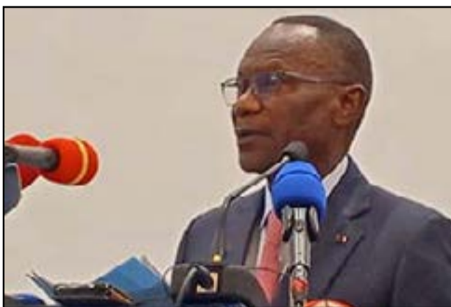
Le DG Bhalat décrivant sa structure devant ses hôtes

Mais en attendant l'adoption de ce plan d'action par l'Assemblée générale de l'OMI, l'heure est à l'évaluation de la mise en œuvre du processus de numérisation dans différentes infrastructures mondiales. Et le PAPN, jaloux de sa