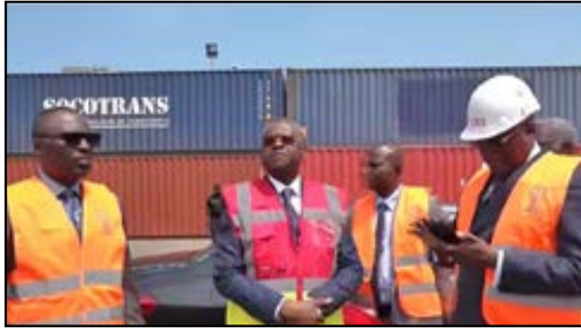
Le ministre visitant les installations du CFCO.