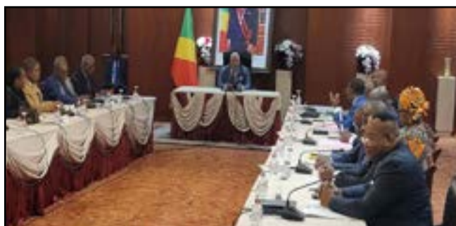
Les membres du comité de direction

la question relative à la médiation des auditions des membres du Gouvernement en commission.