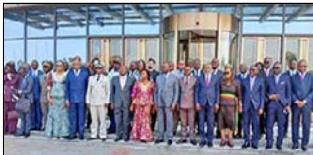
Photo de famille après les travaux d'évaluation

compétitivité, n'entend pas déroger au cahier des charges de l'OMI.