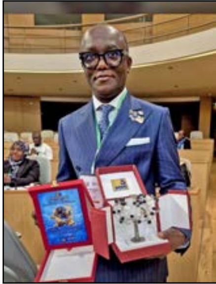
Brice Voltaire Etou Obami

Le président de l'Ordre national des experts-comptables du Congo (ONEC-C), Brice Voltaire Etou Obami, a lancé une vaste opération de lutte contre l'exercice illégal de la profession comptable ainsi que contre la production et l'utilisation de bilans fictifs en République du Congo. Cette annonce a été faite à travers un communiqué officiel rendu public le 20 mai 2026 à Brazzaville.