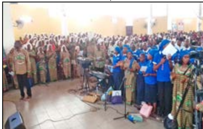
Les chorales et les amis du grégorien dans leurs oeuvres

Pour ne pas manquer une édition de La Semaine Africaine, mieux vaut s'abonner