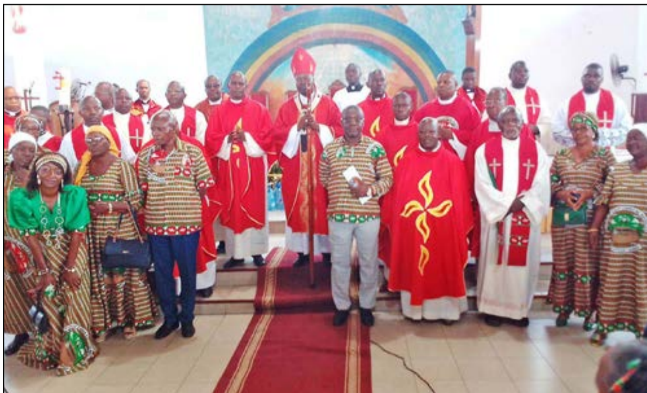
Les prêtres concélébrants et le Conseil pastoral posant avec l'archevêque (P.9)