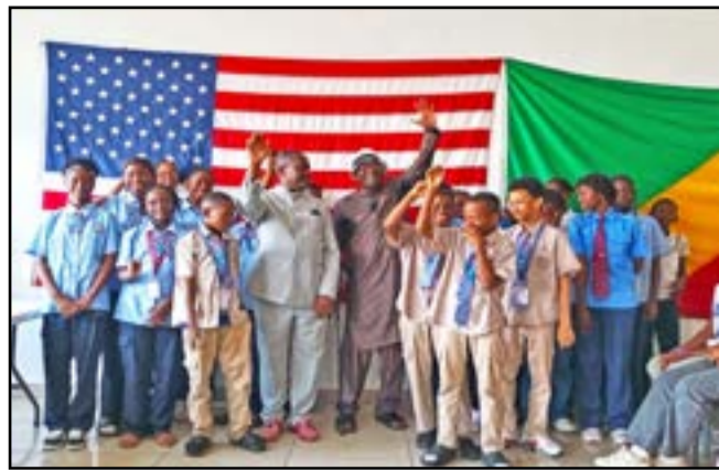
Photo de famille à l'issue des échanges