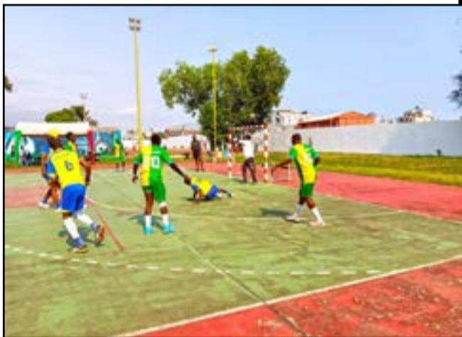
Une action des rencontres disputées à Pointe-Noire

golaise a triomphé sur le fil de ASOC (25-24). De son côté, BMC a fait mordre le