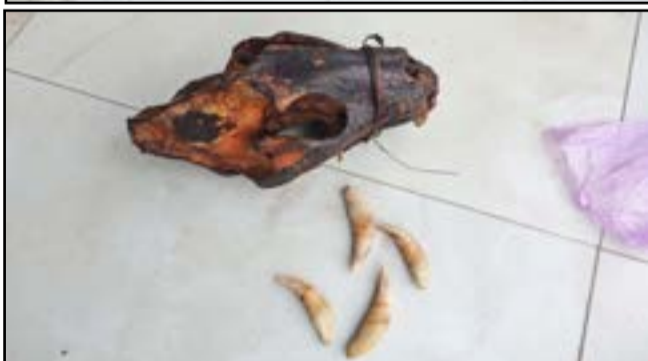
Les quatre présumés trafiquants et leur butin

Les trophées saisis ont été camouflés dans un gros sac de jute contenant des habits et autres effets, afin de tromper la vigilance des Forces de l'ordre qui, malheureusement, les ont interpellés. Ce coup de filet a été rendu possible grâce aux efforts conjoints des éléments de la Région de Gendarmerie et des agents de la Direction départementale de l'Economie forestière de la Cuvette-Ouest en poste à Ewo, avec l'appui technique du PALF (Projet d'Appui à l'Application de la Loi sur la Faune Sauvage).