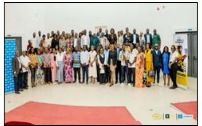
Les organisateurs et les participants à l'édition Média Day

A l'occasion de la deuxième édition du Media Day organisée le 22 mai 2026, à Brazzaville, MTN-Congo et l'UNESCO ont réuni journalistes, étudiants et professionnels des médias autour des enjeux de l'intelligence artificielle (IA) dans le journalisme. Entre innovations technologiques, lutte contre la désinformation et responsabilité éthique, les échanges ont mis en lumière les défis auxquels fait face la presse à l'ère du numérique.