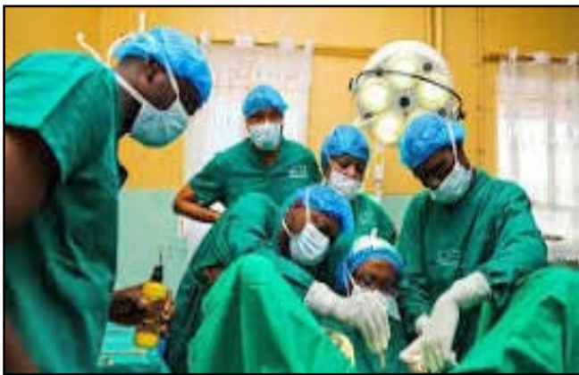
Intervention chirurgicale d'une fistuleuse

«Sa santé est un droit: investir pour mettre fin aux fistules et aux lésions obstétricales», c'est sur ce thème que la communauté a célébré le 23 mai 2026 la 13 e Journée internationale pour l'élimination de la fistule obstétricale. Instituée par les Nations unies, cette journée vise à sensibiliser le public à cette affection et à mobiliser des fonds pour sa prévention, la chirurgie réparatrice et la réinsertion sociale des victimes.