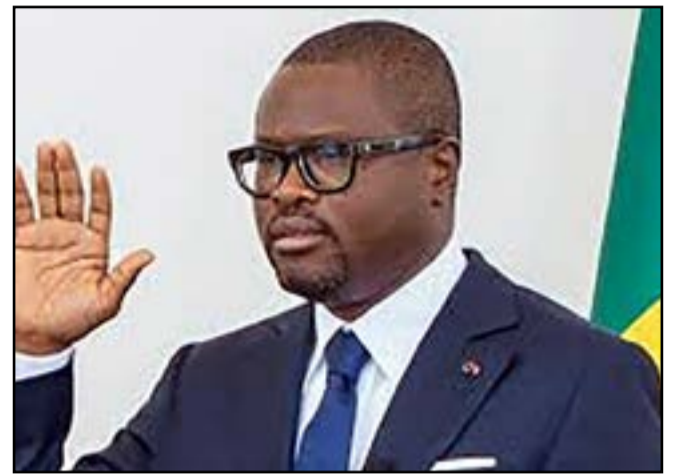
Romuald Wadagni prêtant serment

La cérémonie s'est ouverte par la proclamation des résultats de l'élection présidentielle par la Cour constitutionnelle, installée sur le podium en tenue d'audience solennelle. Quelques minutes plus tard, est intervenu le moment tant attendu. La main droite levée, le président élu a solennellement juré « de respecter et de défendre la Constitution », et a accepté de « subir les rigueurs de la loi en cas de parjure ». Un serment salué par douze coups de canons et les applaudissements des 6 000 invités. Ensuite, le nouveau président a été proclamé Grand Maître des ordres nationaux, avant que le chef d'état-major général monte à l'estrade pour lui remettre le drapeau national. Romuald Wadagni s'est engagé à servir le Bénin avec intégrité, courage et constance, promettant à ses concitoyens une croissance « qui profite-