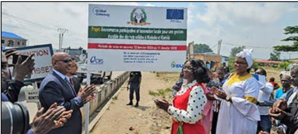
Les officiels face à la communauté, procédant à l'inauguration du panneau marquant le lancement du projet à Kintélé

et le renforcement des clubs scolaires, avec l'objectif de sensibiliser plus de 35 000 personnes aux enjeux environ-