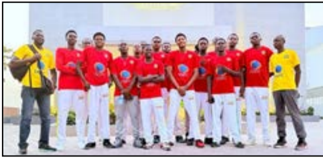
Les 12 jeunes retenus pour Malabo