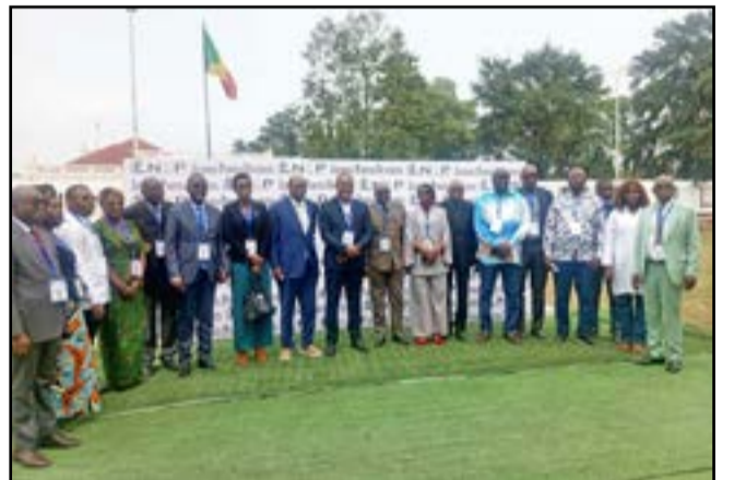
Les officiels à l'issue de l'ouverture des Journées portes ouvertes

Face aux étudiants, professionnels de santé et les usagers de l'institution, le directeur général du laboratoire a relevé l'importance de l'institution dans la chaîne de délivrance des soins et, surtout, son rôle essentiel dans la sécurité sanitaire nationale. «Son rôle s'étend à la surveillance épidémiologique