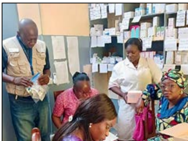
Photo lors du contrôle des produits de santé dans le centre de santé intégré OCH Arrondissement 1 Lumumba département de Pointe-Noire.

opérationnelles standardisées de gestion du médicament et du Manuel d'assurance qualité des médicaments et autres produits de santé. C'est dans la dynamique d'opérationnalisation de ces normes qu'une mission conjointe a été organisée du 8 au 11 juin par les parties prenantes concernées, notamment CRS, la DPM et le PNLP. Déployées dans six Centres de santé intégrés (CSI) du département de Pointe-Noire puis dans cinq CSI du Niari, les équipes avaient pour mission de vérifier les conditions de stockage et de conservation des produits de santé antipaludiques, de contrôler leur traçabilité et leur qualité (les dates de péremption, les numéros de