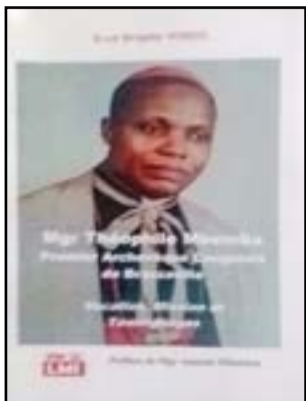
La couverture du livre