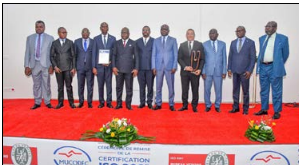
Photo de famille après réception du Certificat