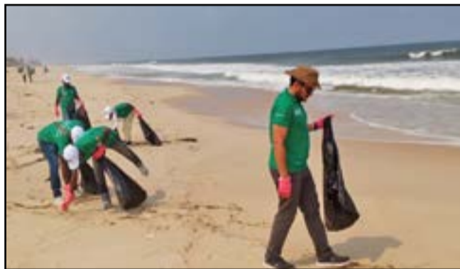
Le Directeur HSE de Trident Energy Congo en pleine opération.