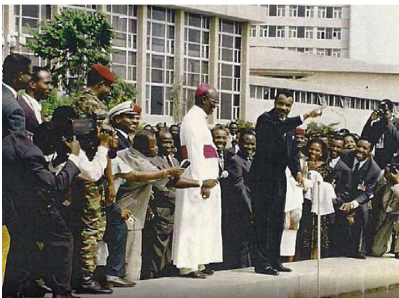
Cérémonie de lavement des mains après la clôture de la conférence nationale souveraine (P.3)