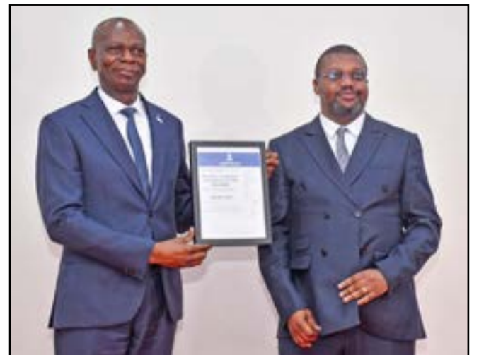
Le DG des Mucodec brandissant le certificat ISO 9001