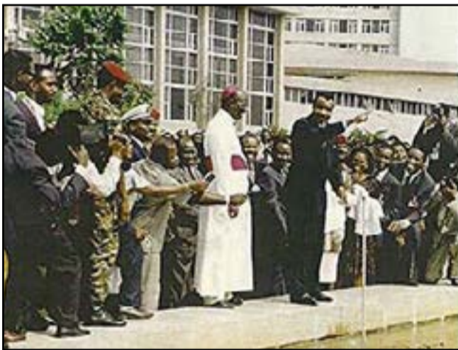
Après la clôture de la conférence nationale souveraine

renoué avec les vieux démons de la division. Avec la contestation des résultats des élections législatives anticipées, les politiques s'injuriaient et se dénigraient à travers les médias et les meetings. A cette guerre des mots avait succédé la vraie guerre civile à l'issue de laquelle plus de 2 mille morts étaient déplorés et dix mille habitations détruites. Les théâtres de ces violences étaient Brazzaville dans sa partie sud, les départements du Pool, du Niari, de la Bouenza et de la Lékoumou. Après ces violences, un pacte de paix était signé le 24 décembre 1995. En l'an 2000, le Programme de réinsertion des ex-miliciens et de ramassage des armes légères était lancé en République du Congo, avec l'appui des partenaires financiers et techniques, en l'occurrence le Programme des Nations Unies pour le développement (PNUD) et l'Organisation internationale pour les migrations (OIM), à travers le thème «Soutenir les ex-miliciens dans leurs