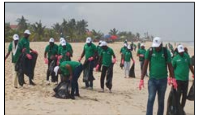
Un groupe de participants à l'opération.

citoyen pour la Journée mondiale de l'environnement », a-t-il conclu.