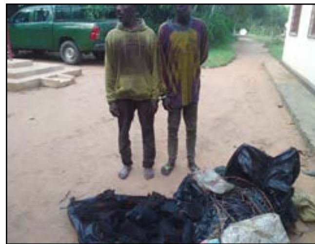
Les deux présumés braconniers avec leur butin

Dans la réserve naturelle de Lesio-Luna (Département du Djoué-Léfini), deux présumés braconniers, la cinquantaine révolue, ont été interpellés le 3 juin 2026. Ils avaient en leur possession soixante morceaux de viande boucanée d'hippopotame.