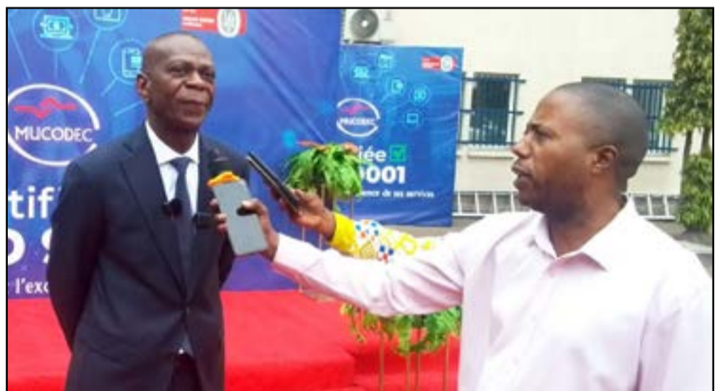
Le DG répondant aux préoccupations des journalistes

à lui qu'est revenu le soin d'en mesurer la portée : «La normalisation consiste à codifier les meilleures pratiques mondiales en référentiels communs; les ISO en sont la référence absolue. La certification est attribuée par les auditeurs externes reconnus à l'échelle internationale qui certifient qu'une organisation fonctionne réellement selon les exigences les plus strictes au monde. En tant que consultant et expert international, j'ai eu le privilège d'accompagner de nombreuses organisations dans plusieurs pays et secteurs depuis plus d'une trentaine d'années. Mais ce que j'ai vécu aux MUCODEC depuis bientôt