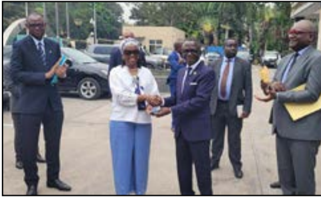
La remise des contacts par le ministre de l'Économie