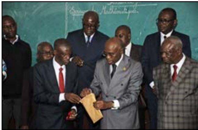
Le ministre Mouthou ouvrant une enveloppe contenant des sujets

Comme prévu, les épreuves écrites du certificat d'études primaires élémentaires (CEPE), se sont déroulées le vendredi 12 juin 2026 sur tout le territoire national. Ils sont au total 149 329 candidats en lice, répartis dans 655 centres pour cette dernière édition de cet examen, à entendre le ministre de l'Enseignement général Jean-Luc Mouthou.