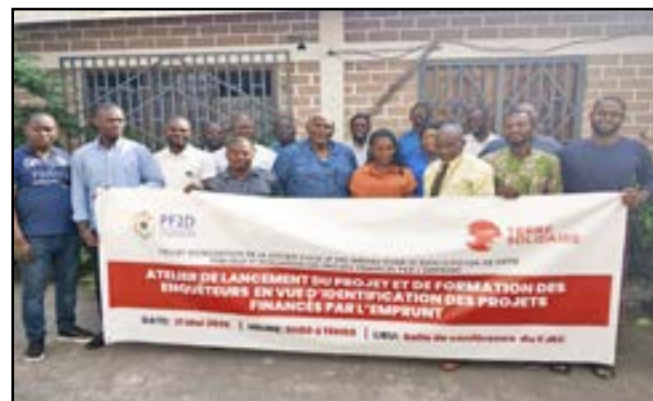
Photo de famille à la fin des travaux

déployé sur toute l'étendue du territoire.