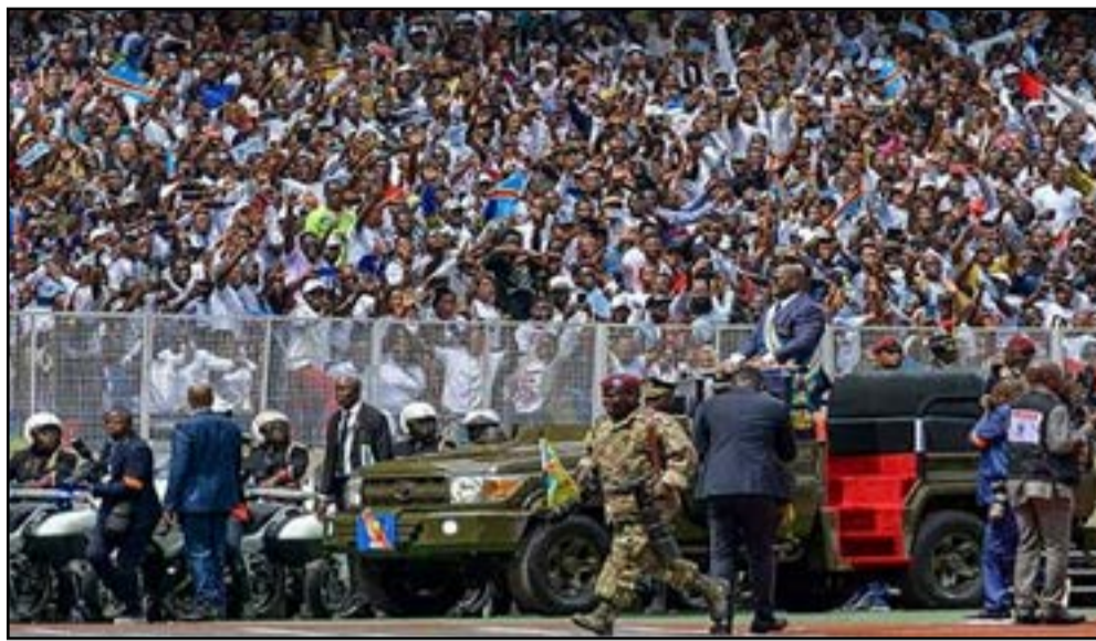
A Kinshasa, l'opposition est déjà hostile au projet de modification de la Constitution

Réunis en séance plénière, les sénateurs ont approuvé le texte à l'unanimité des 89 membres présents sur les 109 que compte la Chambre haute de la RD Congo. Plusieurs modifications ont été introduites, notamment en ce qui concerne la composition de l'Assemblée constituante appelée à examiner les futures réformes. Contrairement à la version adoptée par les députés, les conseillers communaux ont été exclus de cette instance, qui sera désormais composée de sénateurs, de députés nationaux et de représentants des Assemblées provinciales. Si la majorité présidentielle présente l'initiative comme une opportunité de moderniser les institutions et d'adapter la loi fondamentale aux réalités actuelles du pays, l'opposition y voit une démarche, un stratagème aux conséquences po-