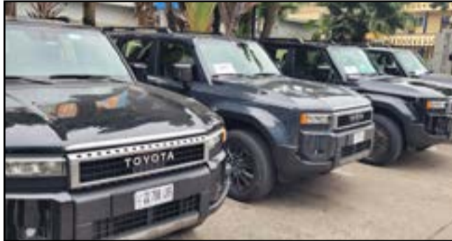
Le don de véhicules

batsa Goma a exprimé sa gratitude à la BAD. Elle a affirmé que ces moyens contribueront à mieux atteindre les bénéficiaires, tout en précisant que l'enjeu ne se limite pas à fournir des équipements aux en-