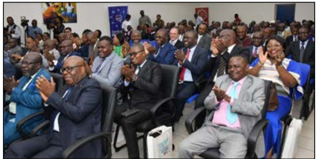
Vue de l'assistance