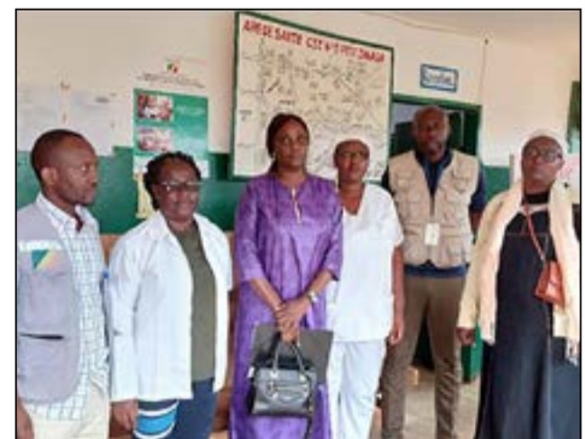
Photo de famille avec l'équipe de CRS, du PNLP, de la DPM et des agents de santé du CSI Petit Zanaga. Dans le département du Niari.

À travers cet accompagnement technique et financier, CRS contribue, aux côtés des autorités sanitaires na-